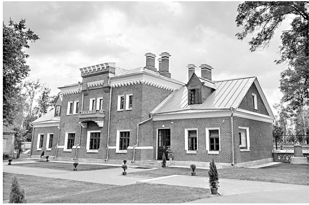
Двухэтажное кирпичное здание, построенное в 1880-е годы для размещения свиты принцессы Ольденбургской. Теперь здесь расположена музейная экспозиция.