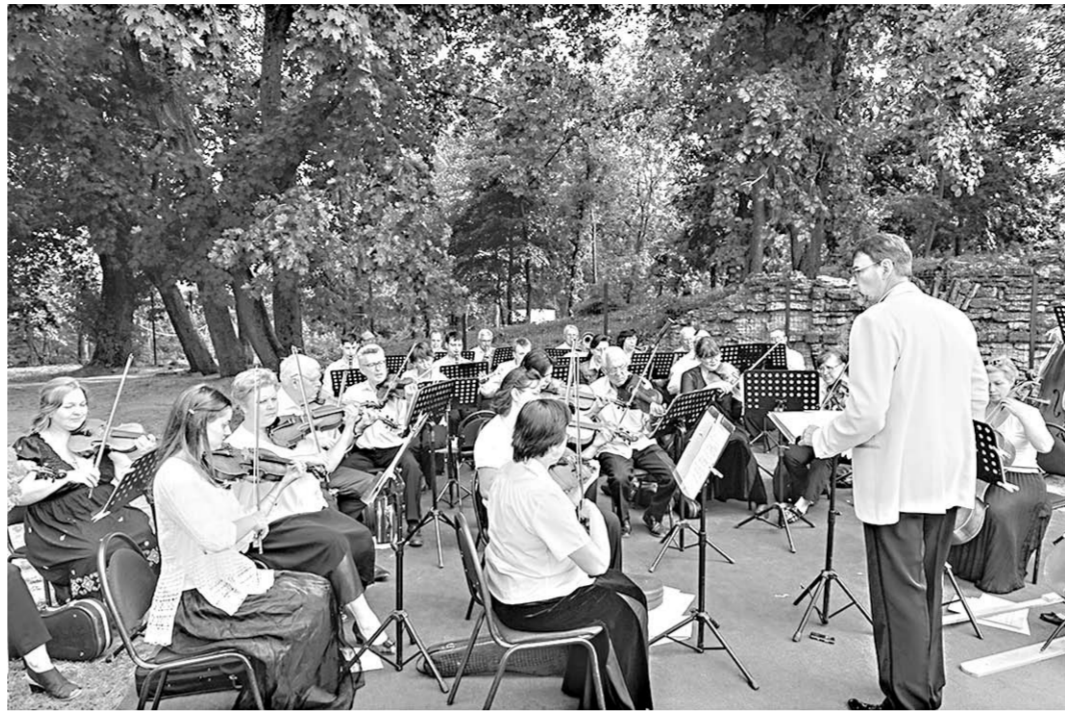
Гостей праздника встречал оркестр.