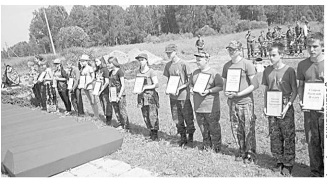
На Поле памяти.

Останки солдата из поворинского села Рождественское перезахоронили спустя 74 года.