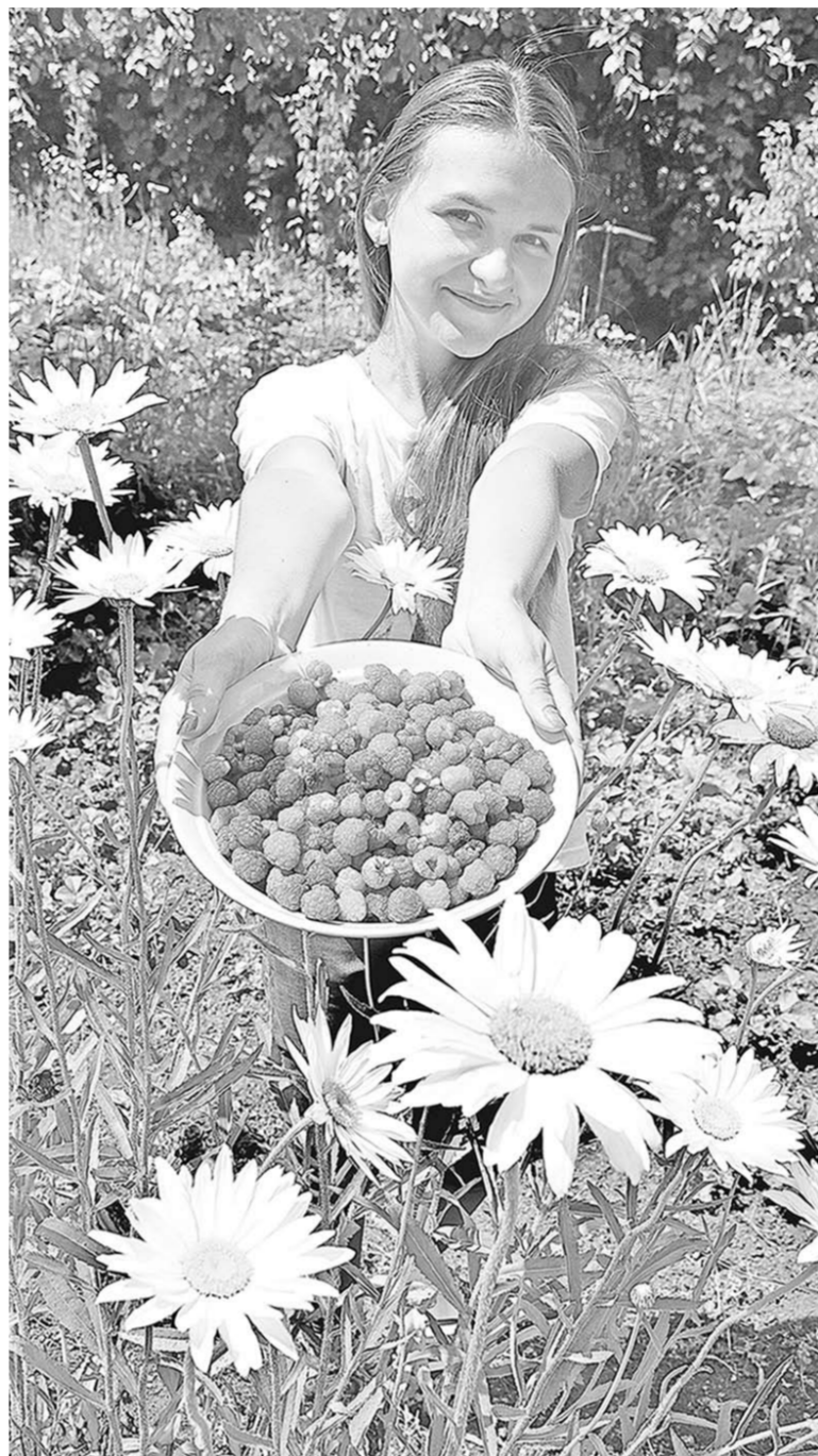
Ничего вкуснее быть не может, чем ягода-малина, собранная на своём дачном участке.