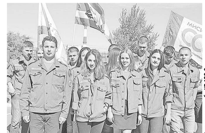
На стройплощадке НВ АЭС-2 будет работать тринадцать строительных отрядов.

Более 200 человек из семи регионов России примут участие в межрегиональной студенческой стройке «Мирный атом-2016». На площадку строящихся энергоблоков Нововоронежской АЭС-2 прибыли 13 строительных отрядов из высших учебных заведений Воронежской, Кемеровской, Архангельской, Оренбургской, Томской, Калужской и Московской областей.