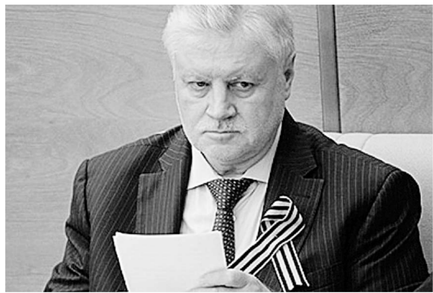
Лидер «Справедливой России» Сергей Миронов: «Хуже всех в России живут те, кто кормит страну».

Для привлечения специалистов «СР» считает необходимым обеспечить льготными кредитами и 50-процентными субсидиями специалистов сельского хозяйства и сельскую интеллигенцию на оплату строительства или покупки частного индивидуального дома. Также в системе образования предлагается установить квоты бюджетных мест в вузах для выпускников сельских школ на специальности, востребованные на селе (сельскохозяйственные,