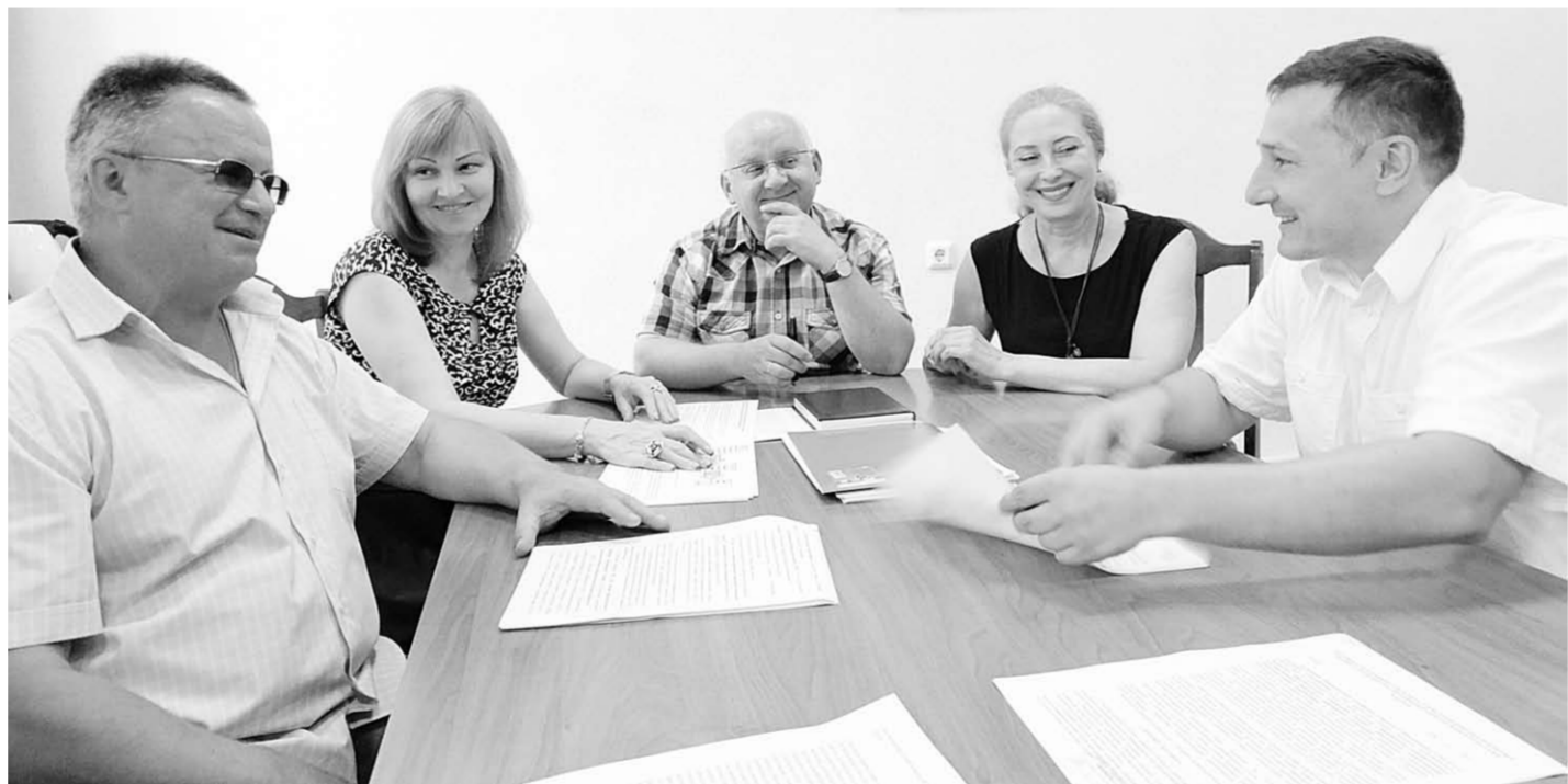
Подготовка специалистов — современный и интересный процесс.

сертификаты получили 50 процентов студентов, серебряные — 46 процентов, бронзовые 4 процента. По результатам участия в ФИЭБ место среди вузов России по направлению под-