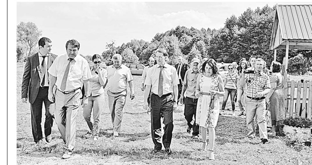
Работу в районе губернатор Алексей Гордеев начал с посещения Кийнова родника в селе Гороховка .

И на достигнутом здесь останавливаться не собираются.