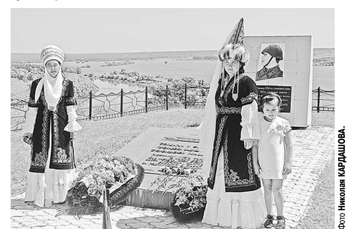
Память Героя Советского Союза

Одиннадцатый год во Втором Селяном киргизы и лискинцы проводят совместную международную акцию памяти Героя Советского Союза Чолпонбая Тулебердиева.