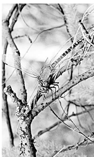
Самец родственного коромысла.

Найденная новая популяция родственного коромысла — изолированная, на близлежащих болотах вид не встречен. Область распространения родственного коромысла — небольшая, она ограничена Западной Палеарктикой (на восток до юго-запада Сибири и северо-запада Китая), информирует сайт заповедника.