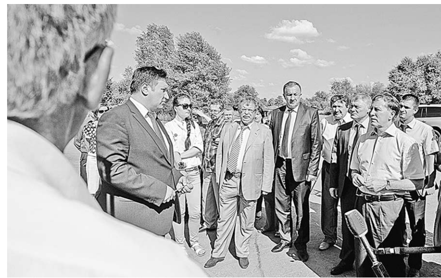
Глава региона побывал на участке новой автомобильной дороги, объединившей сразу два района – Верхнемамонский и Богучарский.