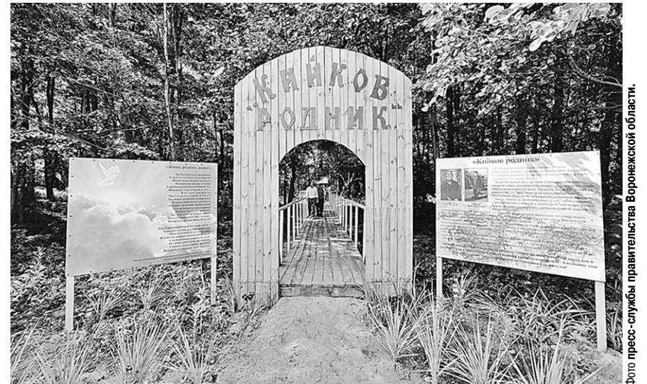
Возрождённый старинный источник вновь одаривает жителей села целебной водой.