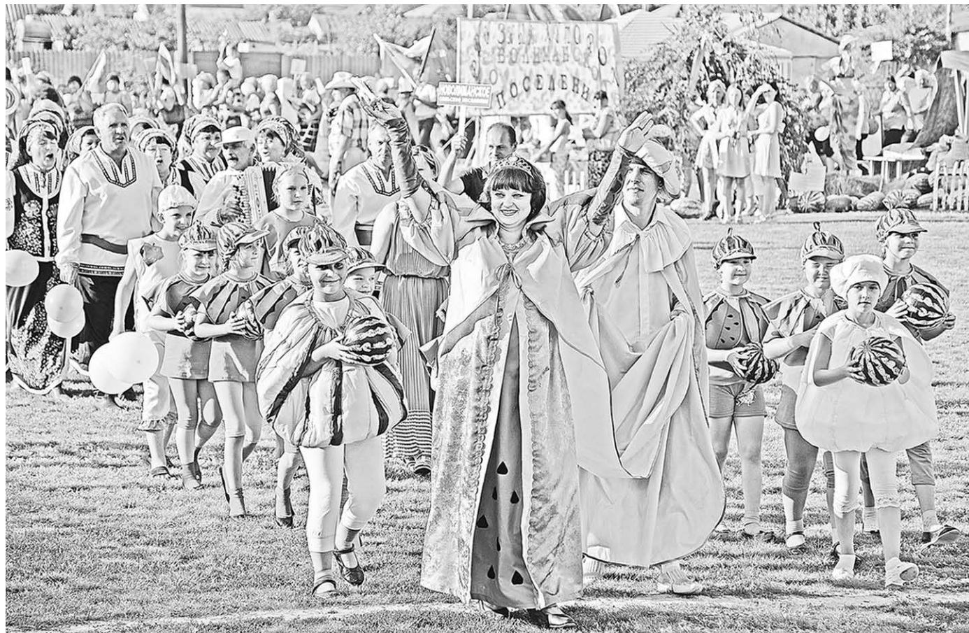
Открыла парад делегаций сельских поселений Королева Бахча в сопровождении арбузных пажей.

Затем праздник переместился на сцену. По традиции слово представили почётным гостям.