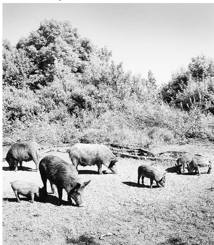
Дикие кабаны могут быть разносчиками АЧС.