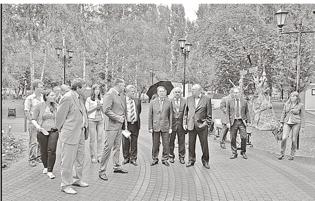
В парке «Юбилейный» губернатору рассказали и показали то, как преобразуются места отдыха россошанцев.

– Это первая практика, когда крупный аграрный холдинг вышел с инициативой заняться социальными объектами и объединить усилия муниципальной и региональной власти. Мы на этот год составили программу на 103 млн. рублей, при этом более 60 млн. рублей – деньги непосредственно холдинга. Теми или иными объектами удалось охватить 21 село,