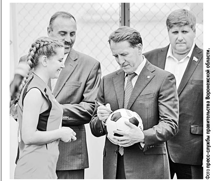
Спорт очень важен в оздоровлении жизни на селе, считает губернатор Алексей Гордеев.