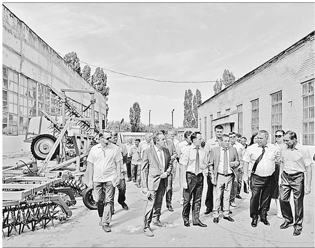
Митрофановский ремонтно-механический завод – яркий пример того, как смена собственника предприятия приводит к возрождению производства.

Сейчас завод работает в режиме полной занятости, вырос объём выпускаемой продукции. Действуют цех холодной