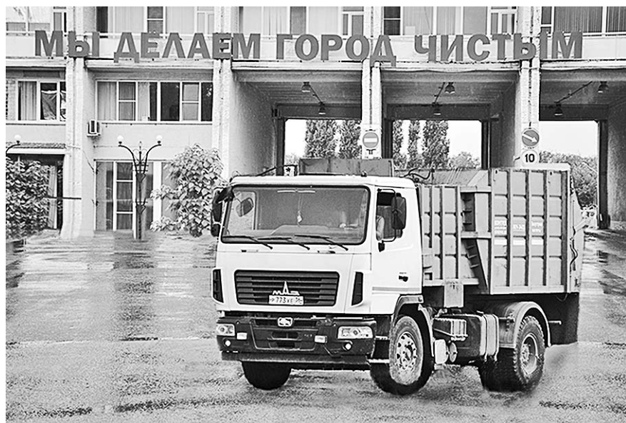
Забора об экологии среды обитания требует взвешенных решений.

– Отходы потребления, которые допустимо и целесообразно направлять на газификацию (либо сжигание), обычно составляют от 25 до 65 процентов от общего объема коммунальных отходов, – говорит Алексей Карякин. – Часть отходов подвергать газификации технологически недопустимо (металлы и стекло), часть недопустимо по экологическим соображениям (химические источники электрического тока, энергосберегающие лампы и другие ртутьсодержащие отходы, отходы электронного оборудования, некоторые виды пластмасс, синтетических материалов, предметы бытовой химии, лаки, краски и т.п.), часть – экономически нецелесообразно