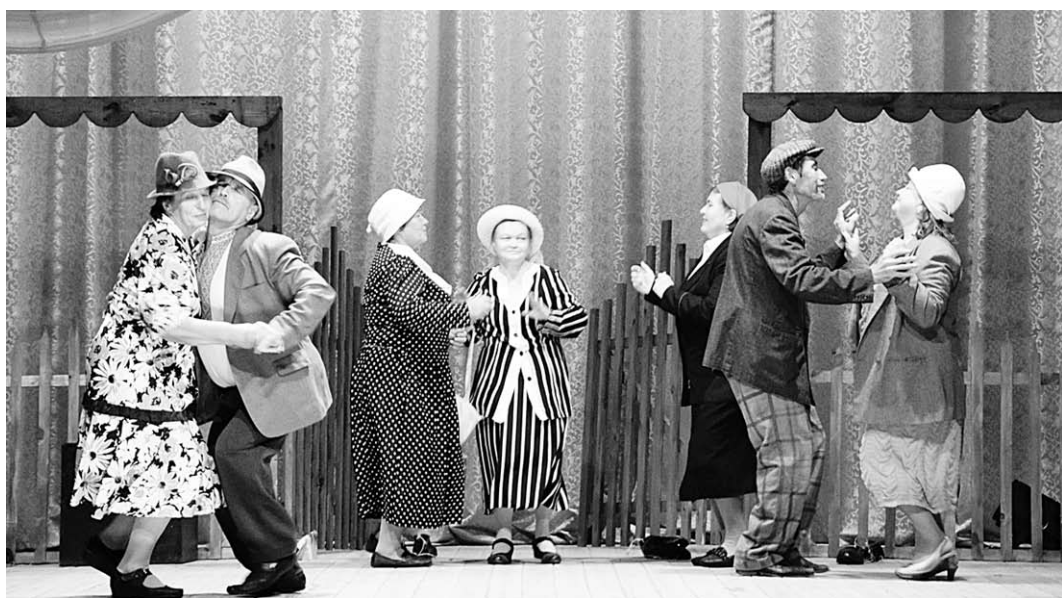
Сцена из спектакля «Путешествия, или Мелкие случаи из личной жизни».

Старейший в области Никольский народный театр показал на фестивале постановку по рассказу Михаила Зощенко «Путешествия, или Мелкие случаи из личной жизни» (ре-