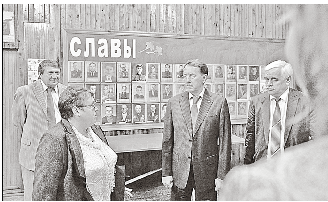
В селе Старая Калитва Алексей Гордеев осмотрел культурно-досуговый центр, который серьёзно обновится благодаря сотрудничеству властей и инвестора.