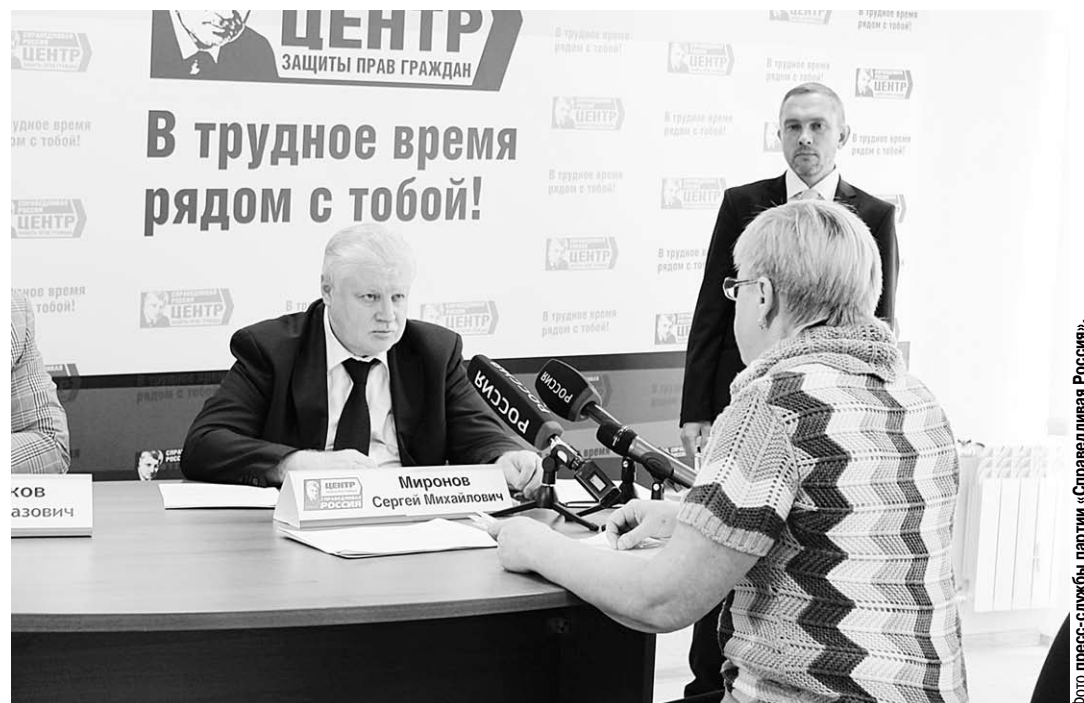
Сергей Миронов ведёт приём воронежцев.

Политик отметил, что обращение жительницы – типичное для всей страны, и нарушения жилищных прав россиян происходят повсеместно.