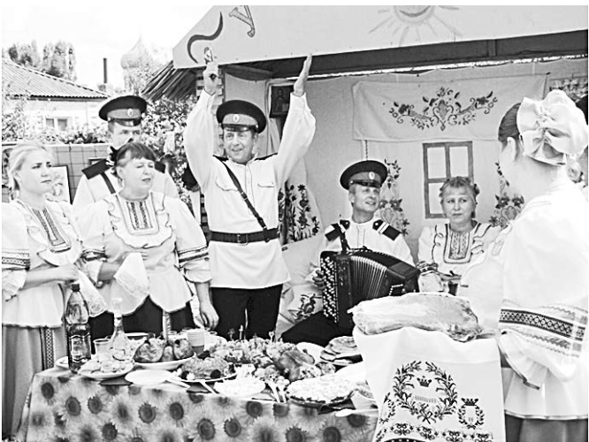
Участники сельских подворий от души поздравляли кантемировцев в праздник.