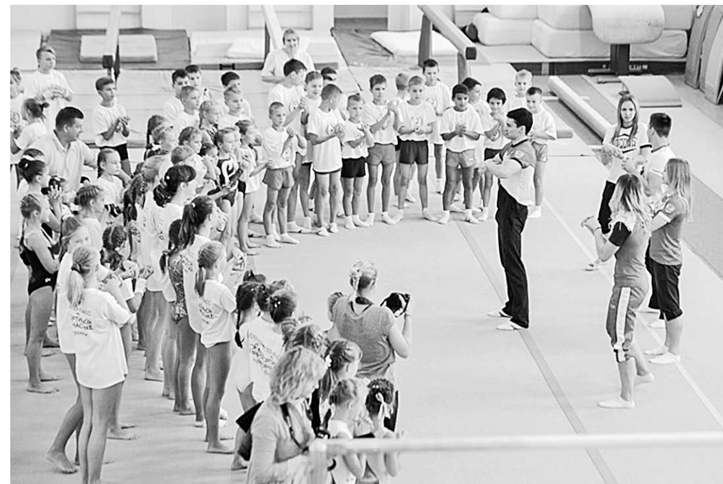
Урок с воспитанниками спортивной школы проводят призёры XXXI Олимпиады.