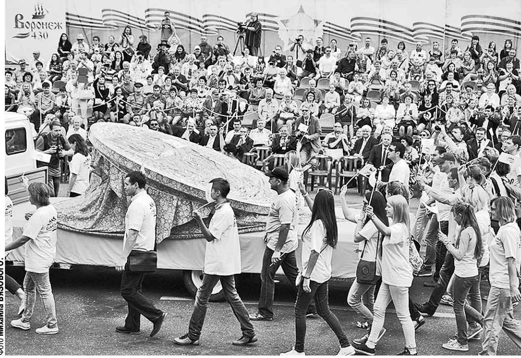
Пряник – звезда программы.