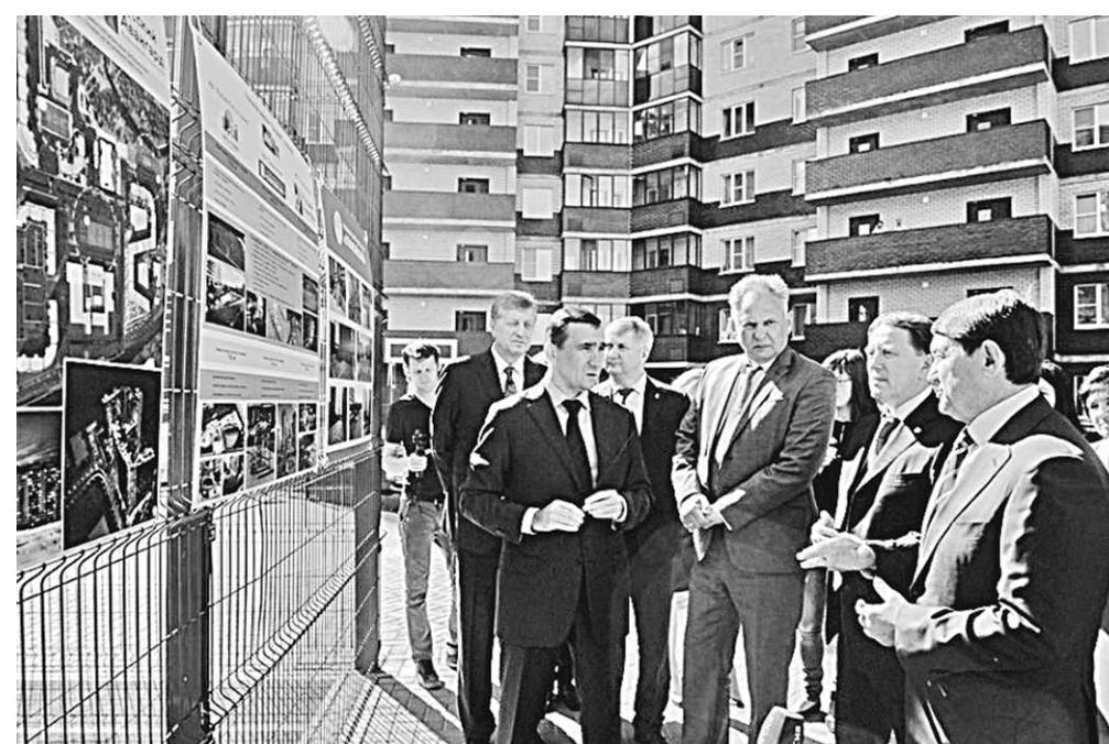
Алексей Гордеев и Игорь Левитин посетили спортивную площадку, расположенную в жилом массиве «Олимпийский».

Сразу по прибытии помощник Президента РФ вместе с губернатором осмотрели перрон и прилегающую тер-