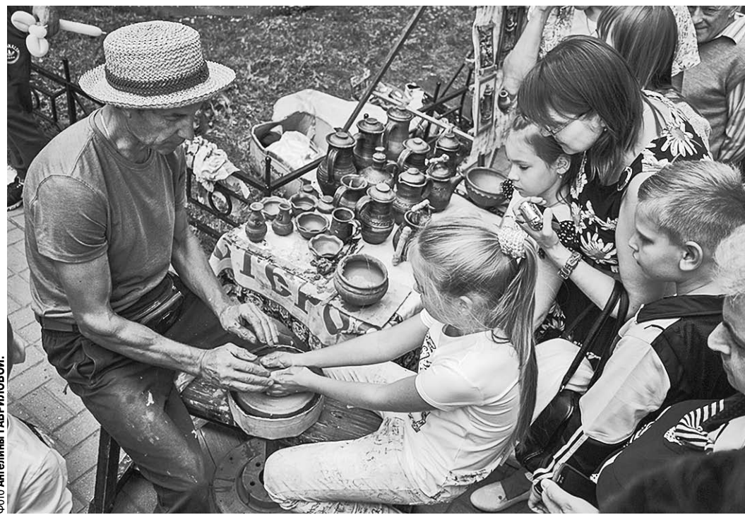
И каждый нашёл дело по душе.