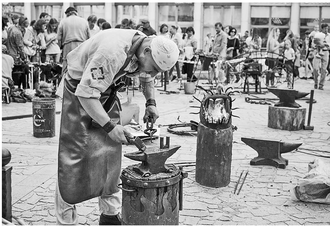
Воронеж – город мастеров.

Праздничную ночную панораму столицы Черноземья лучше всего наблюдать с набережных водохранилища. По многочисленным отзывам наших земляков, это один из самых эффектных по зрелищности салатов. На большом городском торжестве каждый нашёл то, что запомнит и о чём расскажет друзьям из других городов. Прожит ещё один насыщенный событиями и преобразований областной центра отрезок времени. Мы гордимся тобой, Воронеж! Мы любим тебя, наш прекрасный город!