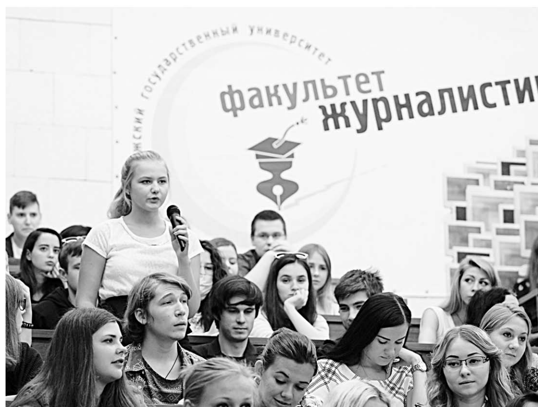
Студенты факультета журналистики не скупятся на вопросы.

Он охотно отвечал на самые разнообразные вопросы – о себе, своей семье, о политике,