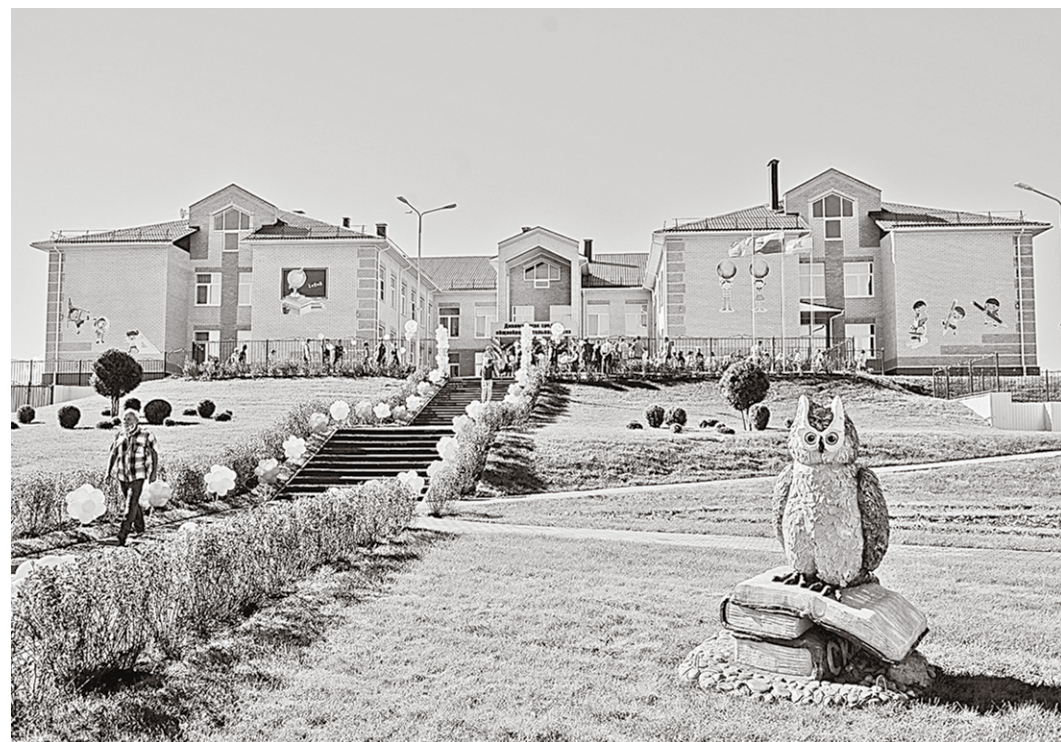
Новое здание Дивногогорской средней общеобразовательной школы в селе Селявное было возведено за один год.

Общество | Губернатор Алексей Гордеев не нарушил своей традиции и в День знаний побывал в сельской школе. А подводя итоги поездки, подчеркнул, что Лискинский район – один из лучших районов Российской Федерации