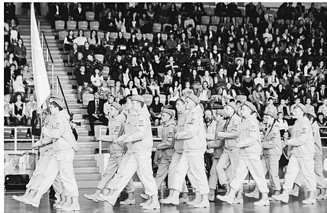
Быть юнармейцем — почётно и ответственно.