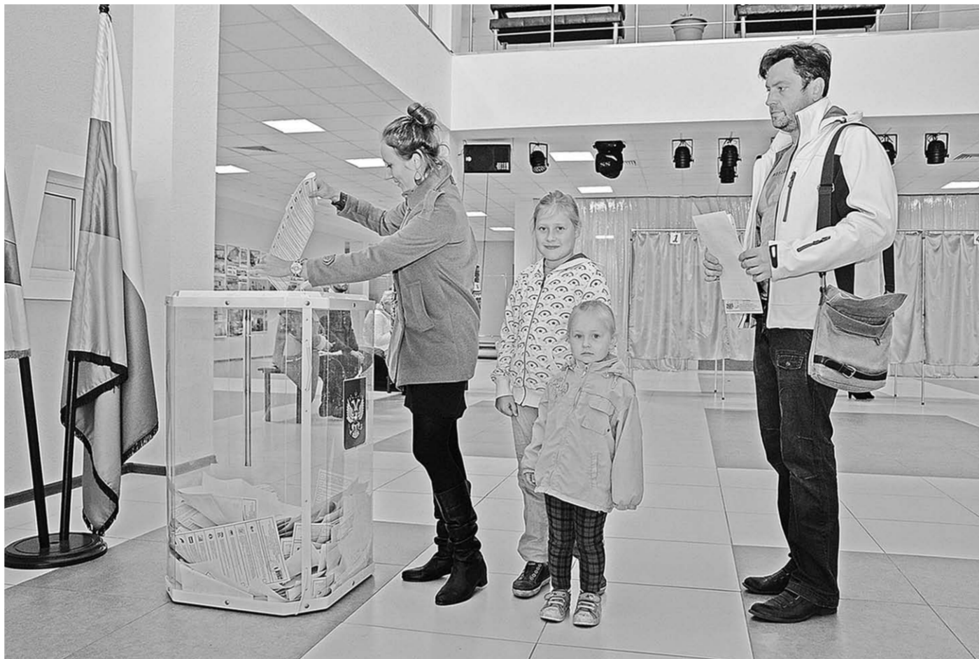
В воскресенье, 18 сентября, жители улиц Ленина, Восьмого марта, Авдеева, Крупской и Юбилейной села Новая Усмьня пришли на избирательный участок № 23/01, чтобы проголосовать за кандидатов в депутаты Государственной думы РФ седьмого созыва. Многие – целыми семьями.