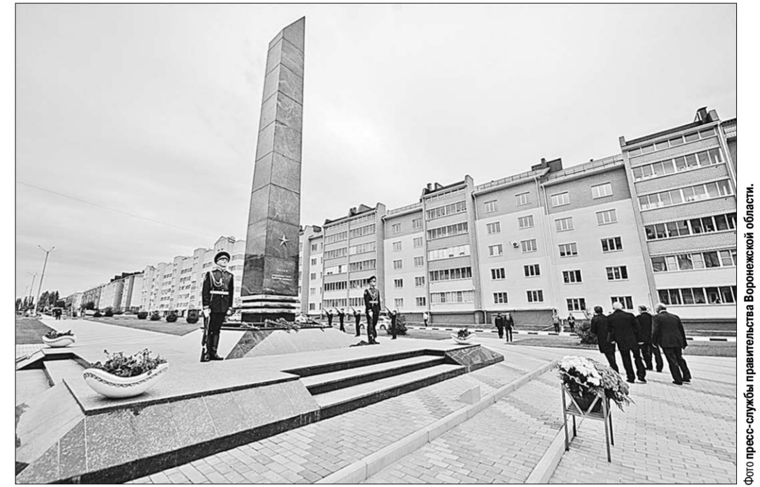
Город Лиски по праву носит звание «Населённый пункт воинской доблести».

Следующим пунктом программы стало посещение памятной стелы «Населённый пункт воинской доблести»,