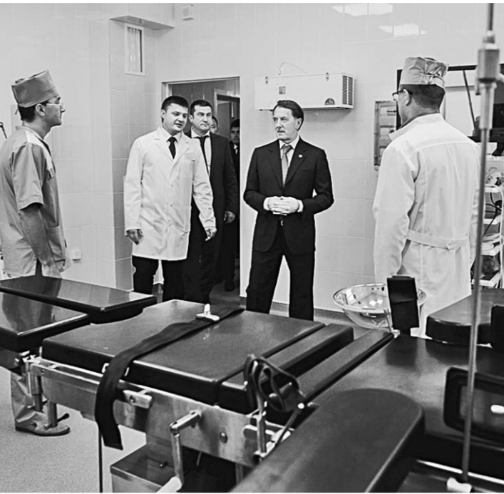
Оборудование больницы отвечает всем современным требованиям.

На площадке рядом с входной группой предполагается организовать музей военной техники под открытым не-