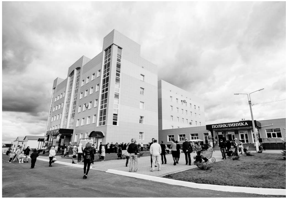
Новое здание поликлиники не только функциональное, но и красивое.

Новая поликлиника состоит из детской консультации на 150 посещений, корпуса для взрослых на 250 посещений, женской консультации на 100 посещений, а также главной входной группы с отделением восстановительного лечения. Кроме того, в новом комплексе есть своя прачечная со стерилизационным и дезинфекционным отделениями и контрольно-пропускной пункт. В честь открытия объекта здравоохранения в Бутурлиновке