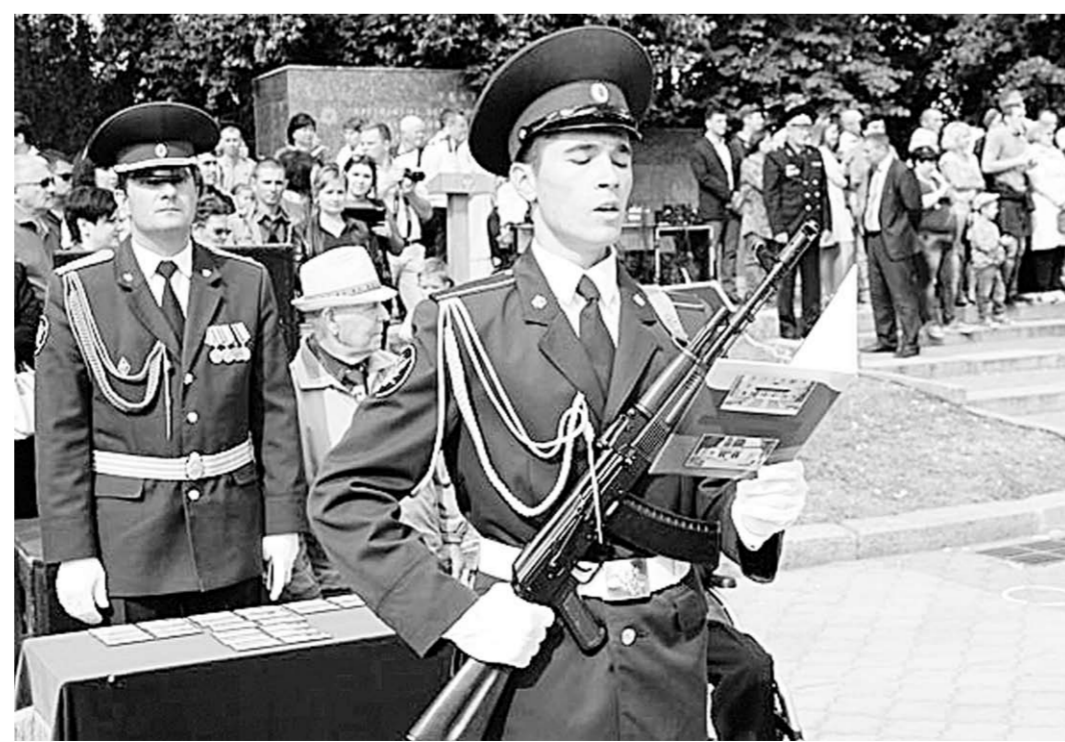
Присяга прошла на площади Победы.