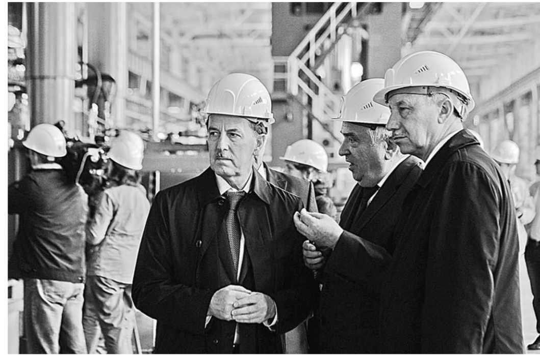
ЗАО «Лискимонтажконструкция» в скором времени начнёт выпуск высокопрочных промышленных электросварных труб большого диаметра.