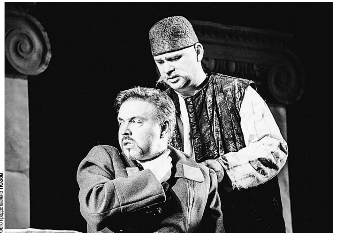
Сцена из спектакля «Страсти по Торчалову».