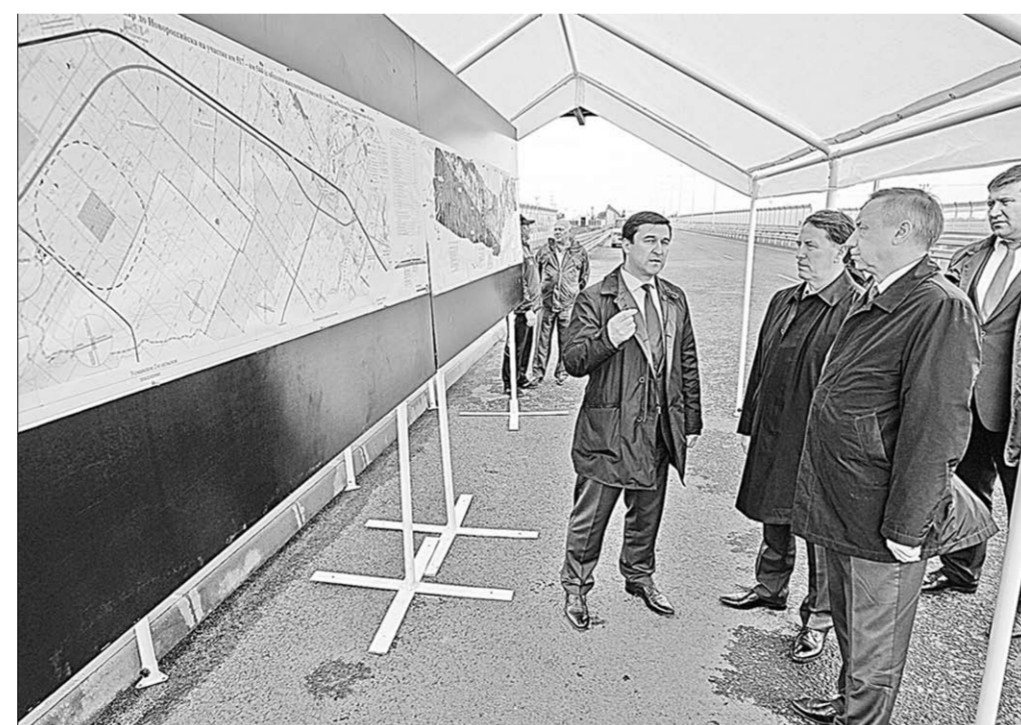
Новый участок трассы М-4 «Дон» станет продолжением обхода города Воронеж.