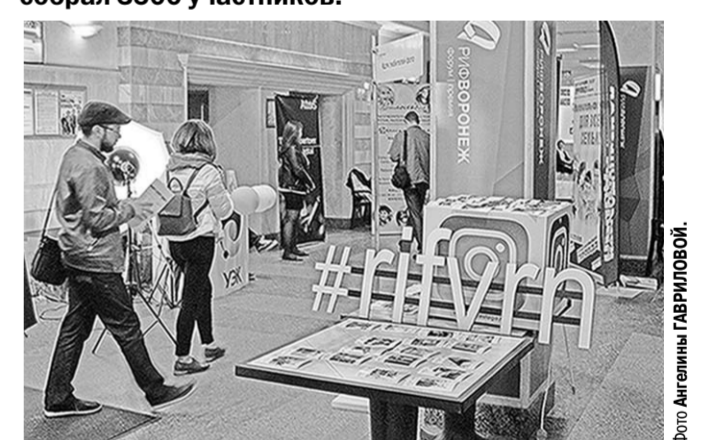
В фойе «Спартака» были развёрнуты выставки.

Воронежский региональный интернет-форум собрал 3500 участников.