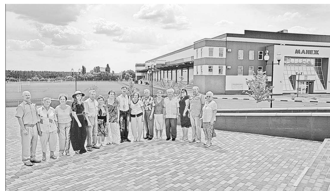
Красавец стадион «Старт» и спортивный манеж по праву являются предметом гордости местных жителей и самым популярным местом времяпрепровождения молодежи.

День работников атомной промышленности учреждён Указом Президента Российской Федерации Владимира Путина №633 от 3 июня 2005 года «О дне работника атомной промышленности». Дата была выбрана не случайно. В этот день, 28 сентября 1942 года, Государственный Комитет обороны СССР выпустил распоряжение «Об организации работ по урану». Этот день принято считать днём рождения атомной энергетики в СССР и России.