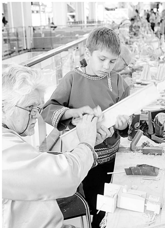
Когда в наставниках — дедушка.