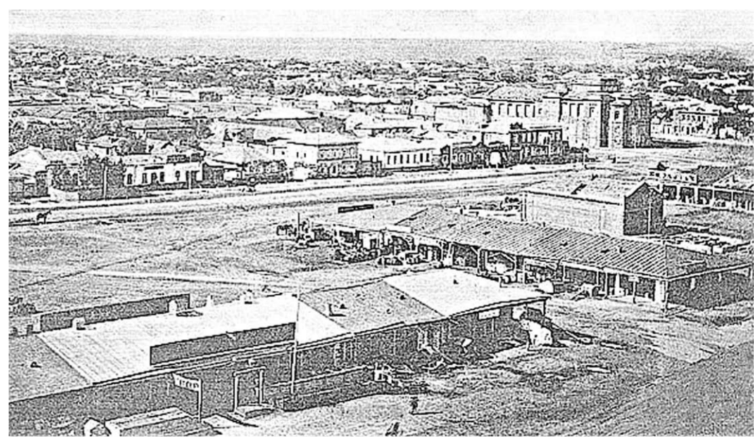
Вид со Сретенской церкви на южную сторону улицы Торговой (Народной) и Народный дом. 1910-е годы.