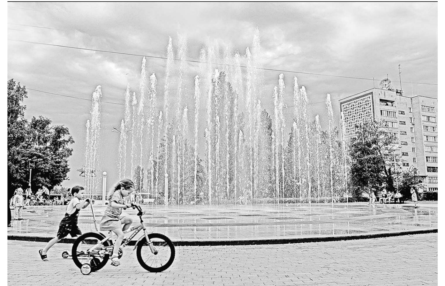
Новый светомузыкальный фонтан-аттракцион «Торнадо» – украшение города атомщиков и любимое место отдыха детворы.

Очередным важным достижением инжинирингового дивизиона в преддверии Дня работника атомной промышленности стало рекордное сокращение времени сварки главного циркуляционного трубопровода второго энергоблока. Всего 72 дня потребовалось специалистам, чтобы прове-