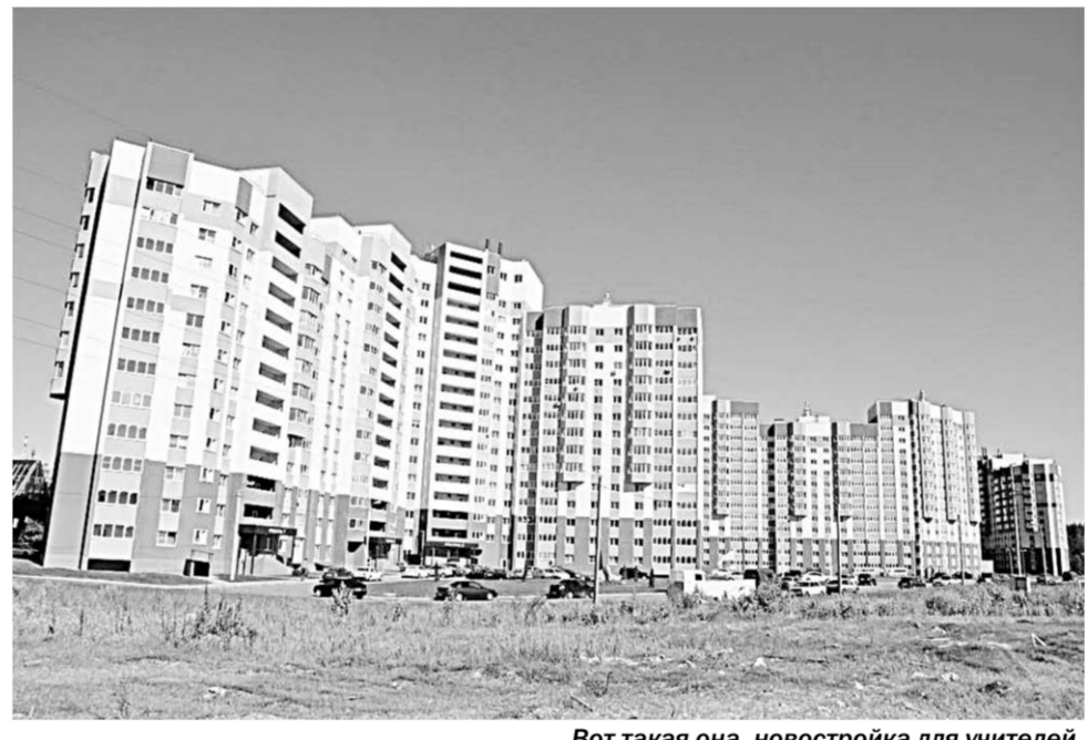
Вот такая она, новостройка для учителей.

ческие присоединения были сделаны для нас или бесплатно, или по адекватным ценам. Это позволило выдержать стоимость строительства на заявленном уровне — 29 тысяч рублей за квадратный метр, несмотря на все дальнейшие трудности, которые встали перед нами. С ООО ИП «К.И.Т.» сотрудничество не получилось из-за неоднократных попыток организации увеличить стоимость квадратного метра. Пришлось, как говорится, «менять коней на переправе». В конце 2014 года заключили договор с ООО «Алтус Инжиниринг и Констракшн». Эту фирму нам порекомендовали в облправительстве. К этому времени проект прошёл экспертизу, и строительство началось. Надо признать, что многие вопросы так и остались бы нерешёнными, если не помощь со стороны областных властей. Например, члены кооператива не имели возможности оформлять ипотеку в банках, потому что наши квартиры не могут быть предметом залога. По этой же причине невозможно было использовать материнский капитал, если ребёнку не исполнилось три года. Эти проблемы мы обговаривали с губернатором Алексеем Васильевичем Гордеевым и заместителем Председателя Совета Федерации Галиной Николаевной Кареловой в августе 2015 года. Тогда первый дом уже готовился к сдаче, а второй и третий стояли ещё в каркасе. По инициативе администрации области для нашего кооператива в Агентстве жилищного ипотечного кредитования разработали специальную программу. Она заработала с ноября 2015 года, что дало возможность будущим новосёлам решить финансовые вопросы.