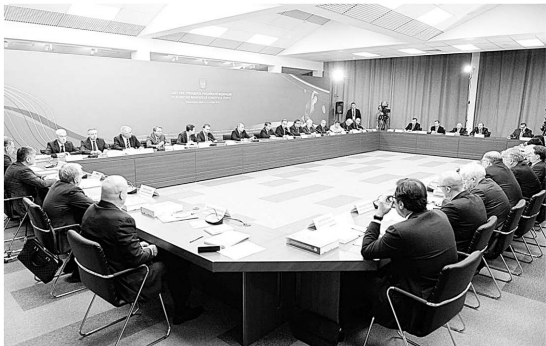
Во время заседания Совета при Президенте РФ по развитию физической культуры и спорта.