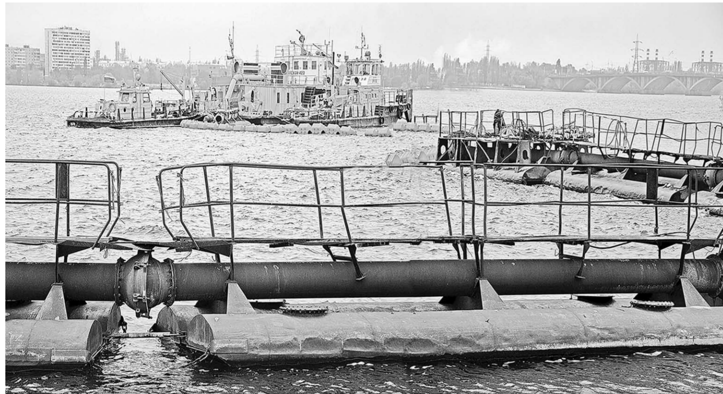
Земснаряд поднимает со дна около 400 кубометров песка в час.

На злобу дня | Стартовал первый этап масштабной реновации главного водоёма Воронежа