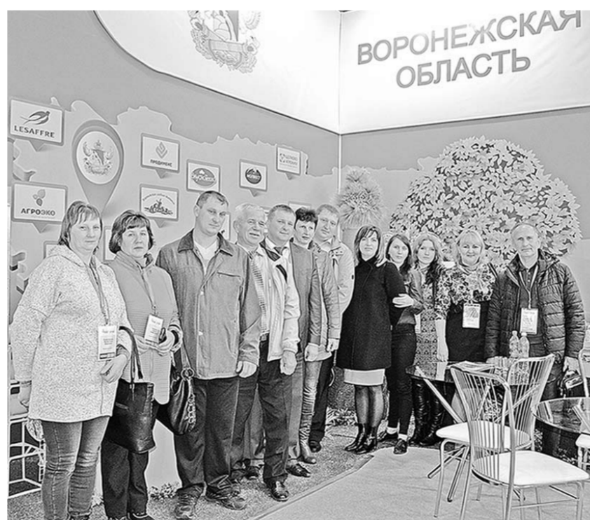
Воронежские аграрии на «Золотой осени» в Москве.

Продолжается также уборка подсолнечника, сахарной свеклы, полным ходом идёт вспашка зяби. В области посеяно без малого 700 тысяч гектаров – тем самым создается хорошая стартовая площадка для новых высоких урожаев.