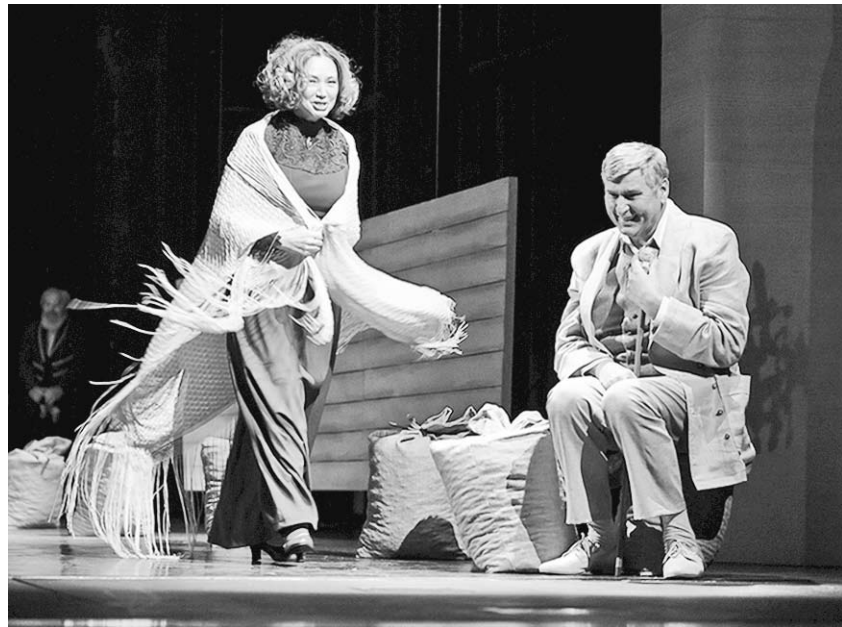
Сцена из спектакля «Вишнёвый сад».

Режиссёр даёт возможность артисту проявить характер своего героя в мощной мизансцене. Являясь также и художником своего спектакля, Владимир Петров выстраивает на диагонали сцены большую стену, на которую проецируются элементы декорации: портреты предков, «дорогой многорукавый шкаф» и т.п. По всей сцене лежат разбросаны мешки, возможно, с вишней, секрет сушки