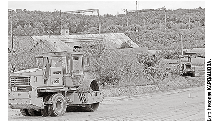
Техника на прокладке асфальтированного проезда к тоннелю.

В Лисках строительство автотранспортного перехода в железнодорожной насыпи вышло на финишную прямую.