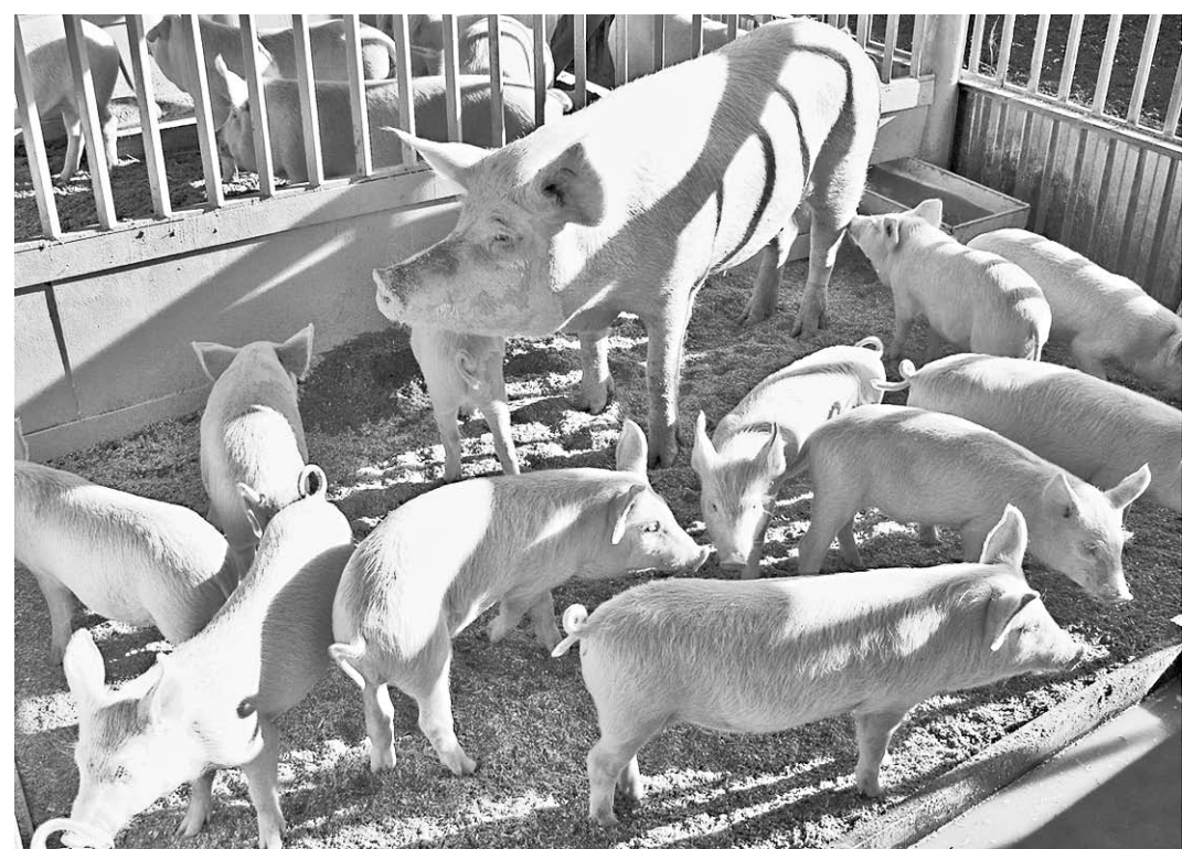
Эксперты считают, что всё-таки главным фактором, способствующим распространению вируса, является слабая ветеринарная защита в хозяйствах малых форм собственности.

В основном болезнь среди свиней регистрируется в ЛПХ и КФХ. Но, учитывая их массовый характер и широкую географию, чума подбирается и к крупным предприятиям. Группе «Черкизово» не удалось избежать полной ликвидации поголовья свиного комплекса в Лев-Толстовском районе Ли-