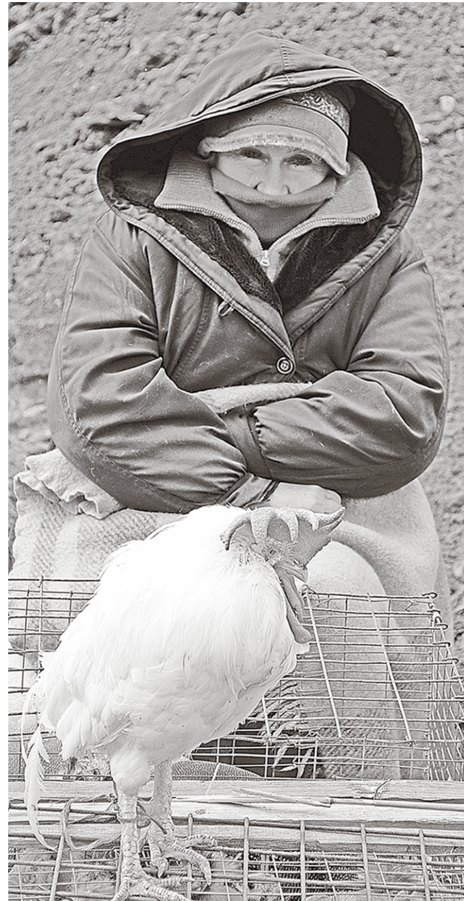
На Птичьем рынке больше продавцов, чем покупателей.