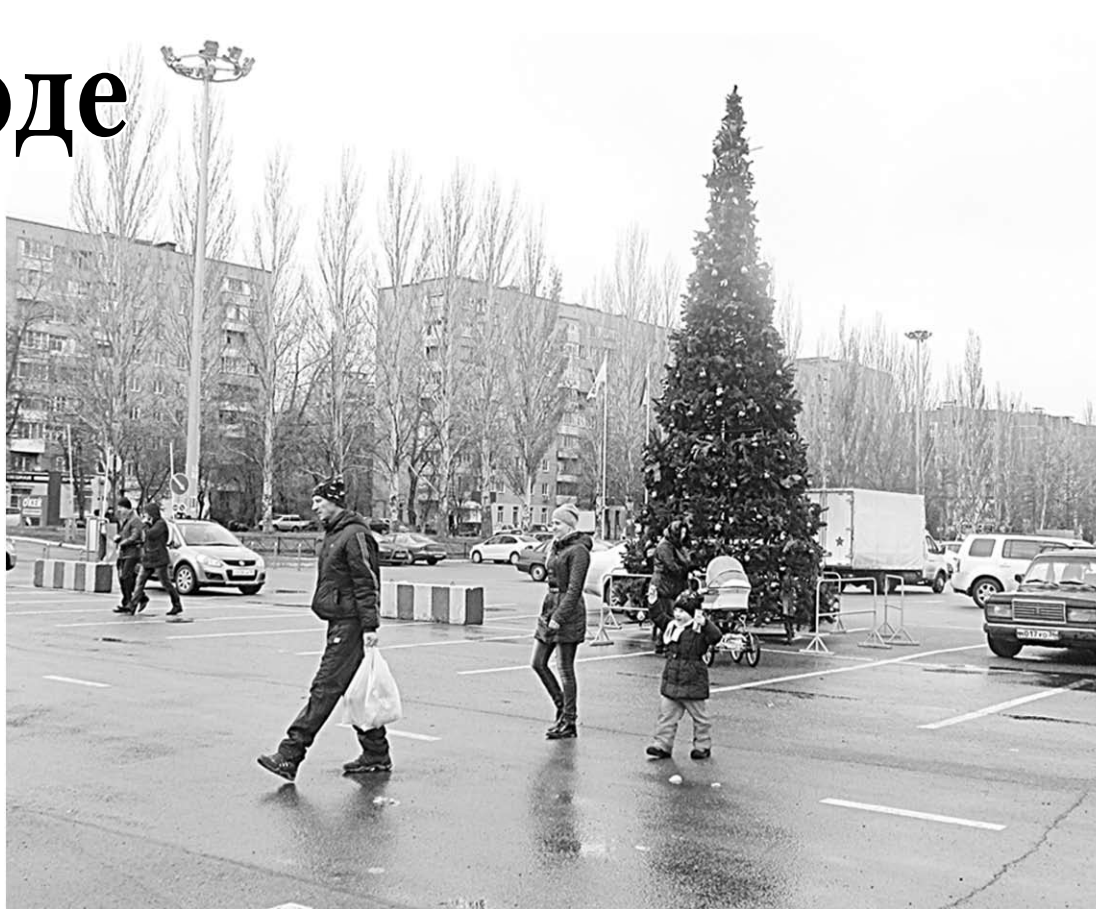
Многим воронежцам столь ранняя установка ёлки подняла настроение.

Сотрудники администрации торгового центра столь раннюю установку ёлки объясняют тем, что уже 3 ноября на их торговые полки поступит новогодний ассортимент. Сейчас новогодний символ на Шишкова украшен не полностью, и в полной своей красе зелёная красавица предстанет к 10 ноября.