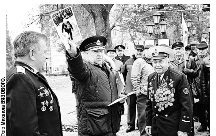
С гордостью за флот!

В Воронеже отметили 320-летие со дня основания российского регулярного Военно-морского флота и День моряка-надводника.