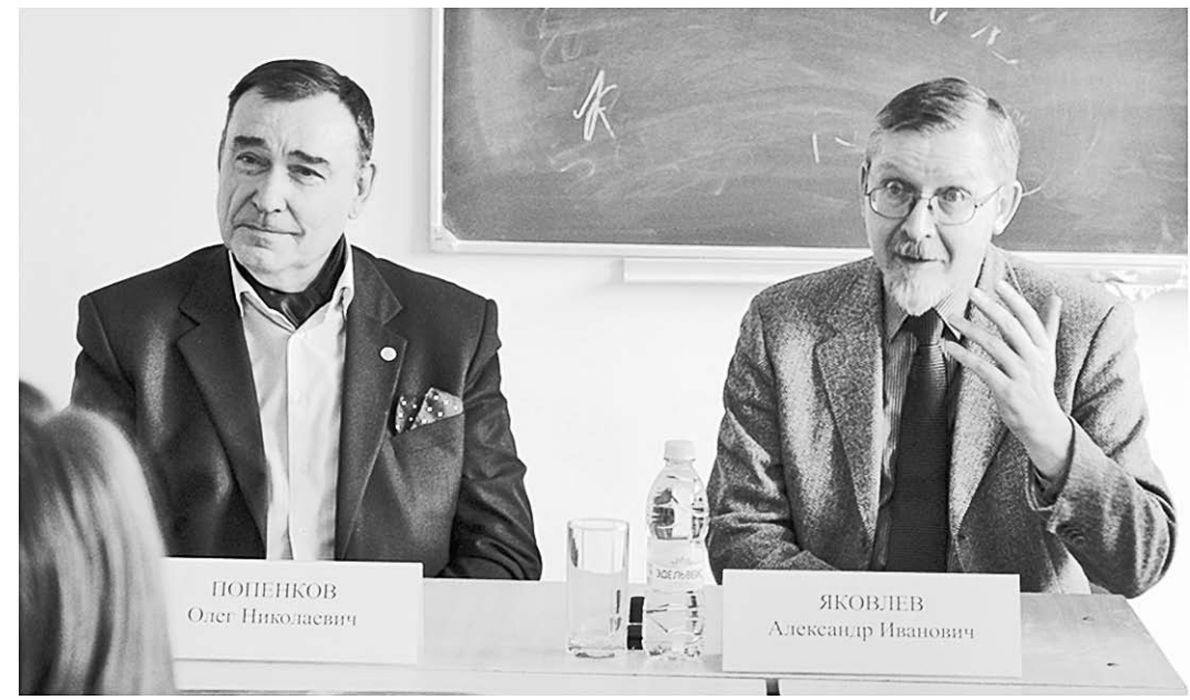
То, что перемены изменяют Восток — это вопрос времени, считают учёные-востоковеды.

«Для арабского мира история — это реальность. Террористический акт в США, который произошёл 11 сентября, вызван не просто желанием убить как можно больше людей. Можно сказать, что это событие — реванш за 500 лет унижения. Это