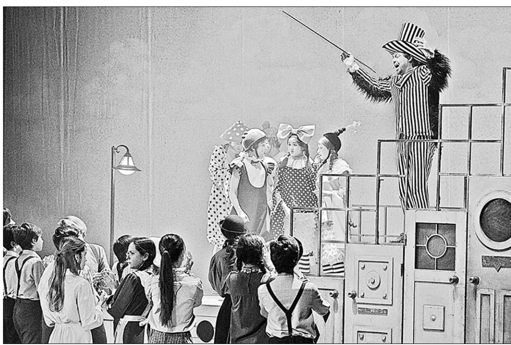
Фестиваль открылся мюзиклом «Пеппи Длинныйчулок».

В этом году «МАРШАК» обрёл международный статус: обещаны спектакли из Германии и Эстонии. То, что фестиваль открылся постановкой Детского музыкального театра