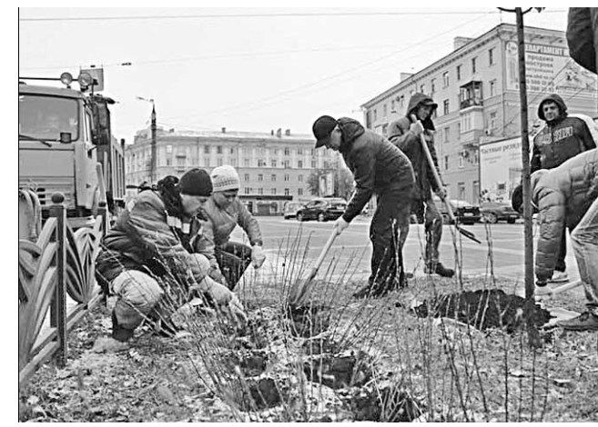
Идёт посадка кустарников.

В субботу, 29 октября, в рамках месячника по благоустройству территорий в Воронеже прошёл общегородской субботник.