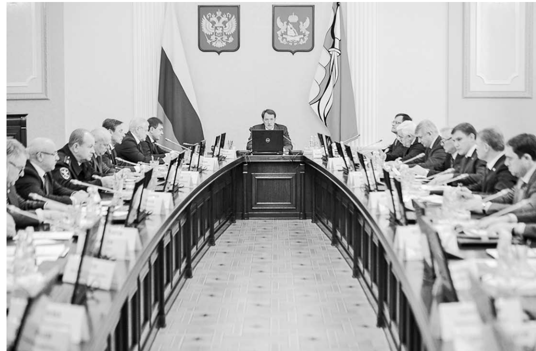
На заседании правительства Воронежской области обсудили важные вопросы.

– Время идёт вперёд, и мы должны хоть как-то успевать за ним. Мы зачастую берёмся ремонтировать клуб, тратим деньги, какую-то будущую делаем кинемеханику. А как туда