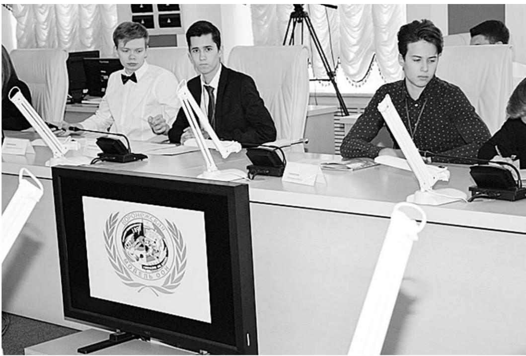
Для молодёжи ролевая игра – великолепный шанс проявить лидерские качества.

Проблемы, которые рассматривались в ходе работы школьной модели, являлись частью реальной повестки дня ООН. Так что, ребятам пришлось потрудиться по-взрослому. Темы комитетов тоже не детские: «Международная миграция, масштабы и социально-экономические