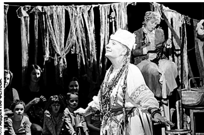
Сцена из спектакля «Мальчик, который ничего не боялся».

Самые юные воронежцы побывали на уроке доброты из Эстонии