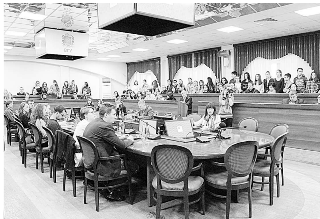
Учёных всё больше волнует не только тема долголетия, но и проблемы старения человечества.