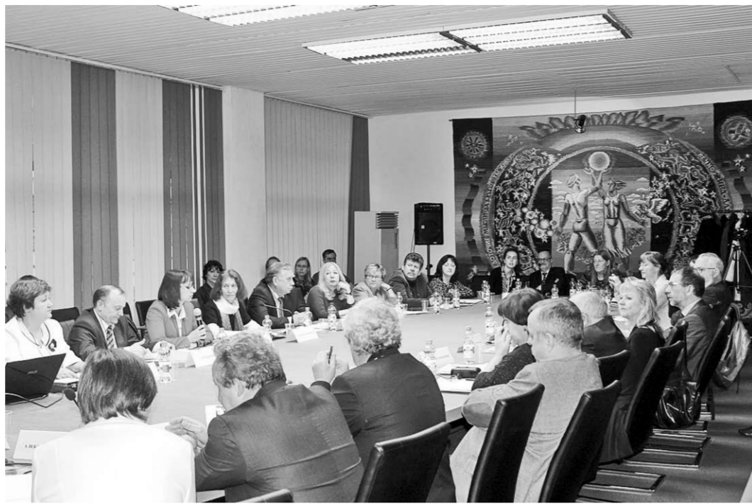
Тема «круглого стола» – международное сотрудничество в сфере высшего образования, его проблемы и перспективы.

тал приветственный адрес от имени заместителя министра образования и науки Российской Федерации Вениамина Каганова . В нем, в частности, отмечается: «Приятно отметить, что после отъезда на родину немецкие выпускники не теряют связь с университетом, ставшим для них родным как время учебы, и продолжают принимать активное участие в его жизни. Одновременно это событие следует рассматривать и как результат реализации российских государством последовательного курса на интеграцию национальной системы образования и науки в мировое сообщество. Уверен, что Форум станет еще одной эффективной площадкой для обсуждения актуальных проблем российско-германского образовательного, культурного и молодежного сотрудничества, поиска новых форм и направлений его развития с учетом богатого опыта Воронежского государственного университета, по праву занимающего лиди-