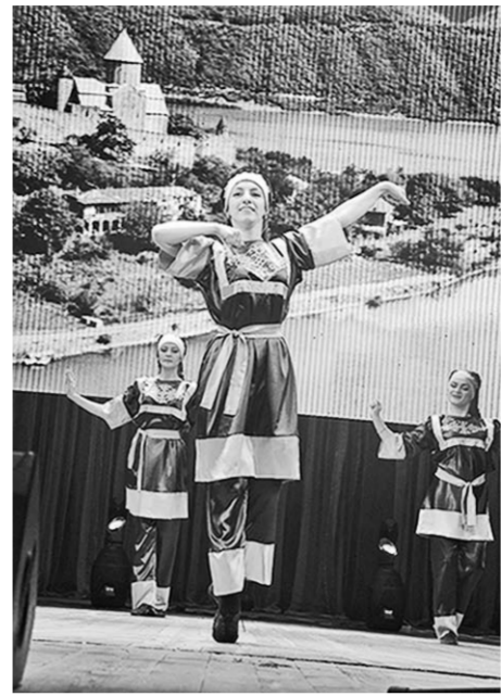
Танцы кавказских гор.

коллективы. В их числе – фольклорный ансамбль «Воля», народные хореографические коллективы «Сударушка», «Надежда», «Родина».