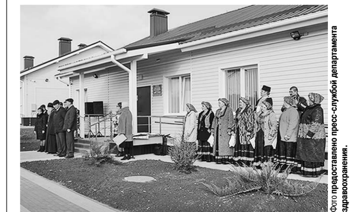
Амбулатория в селе Гремяче.