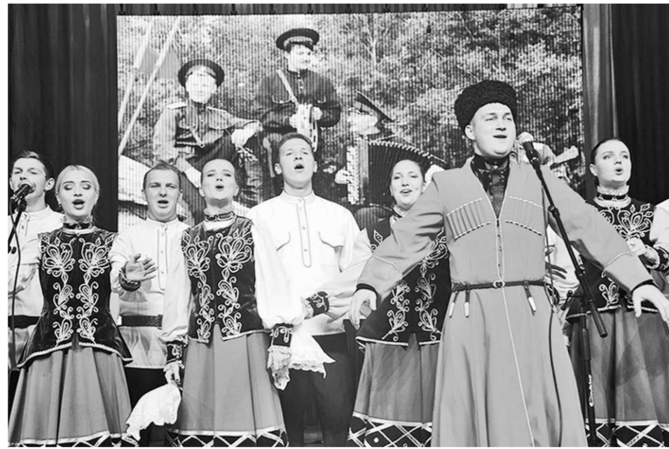
Звучит казачья песня.