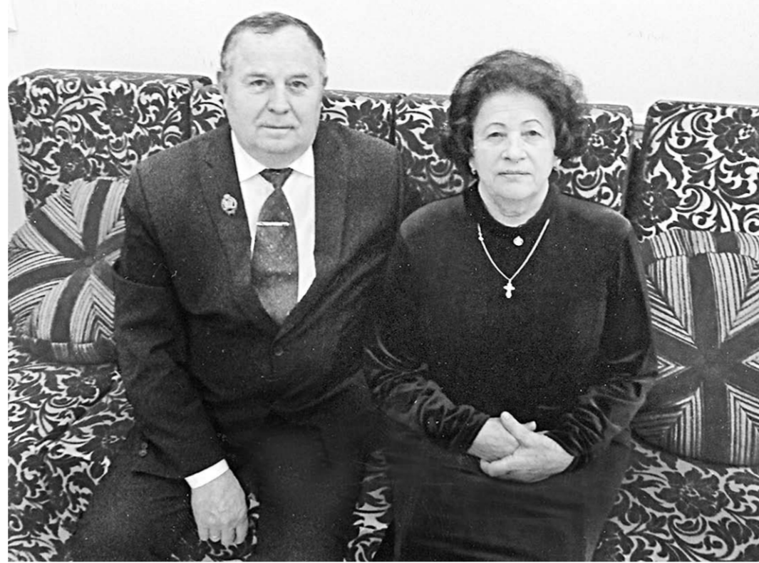
53 года рядом.