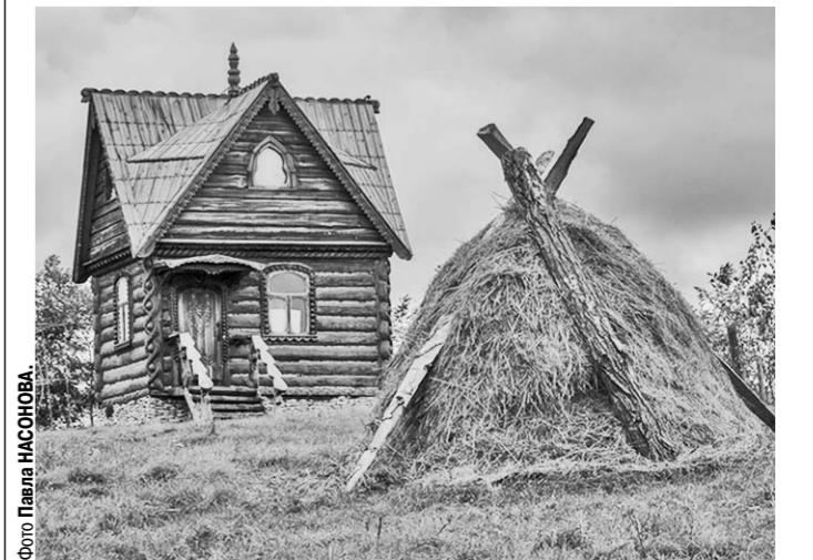
Окрестности парка «Ломы».

Вторым шагом пленэра станет совместная выставка креативной фотографии как воронежских, так и воробьёвских фотолобителей, над которой они сейчас и работают.