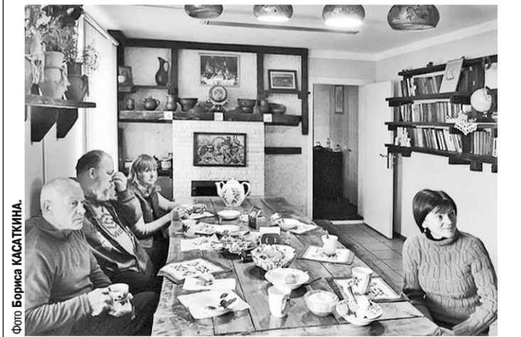
Фотографы в интерьере гостиницы.

На несколько дней члены Воронежского фотоклуба «Экспресс» Дворца культуры железнодорожников погрузились в будничную жизнь Воробьёвского района.