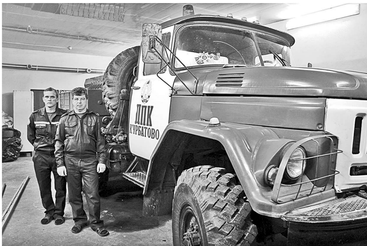
Пожарная дружина несёт службу круглые сутки.

Пожарная дружина занимается профилактической и просветительской работой.