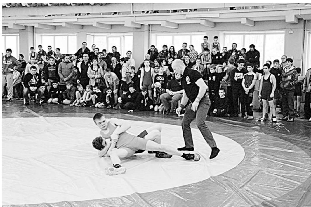
На борцовском ковче — будущие чемпионы.