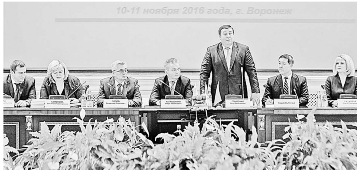
В правительстве Воронежской области обсудили перспективы российско-китайского партнёрства в медицинской сфере.

Официальный визит китайской делегации в Воронежский государственный медицинский университет имени Н.Н. Бурденко был приурочен к открытию на его базе первого в России университетского Центра традиционной китайской медицины. Основной темой заседания Ассоциации Совета ректоров в Воронеже стало обсуждение перспектив российско-китайского академического партнёрства как основы