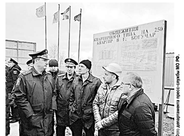
Разговор со строителями у замминистра обороны получился нелицеприятным.

Гражданских подрядчиков строительства военного городка под Воронежем призвали соблюдать сроки.