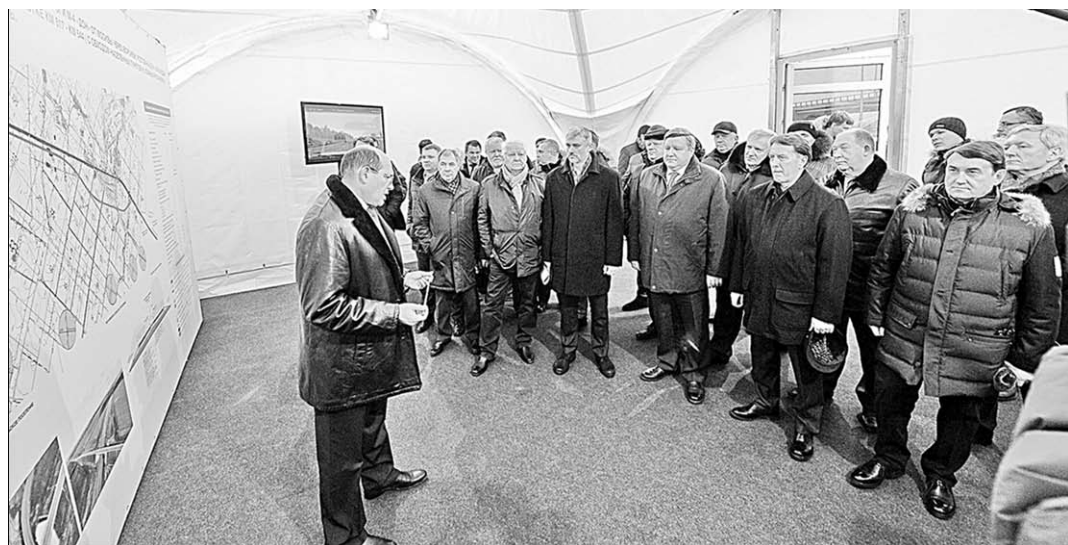
Игорь Левитин и Алексей Гордеев ознакомились с новой дорогой.

Игорь Левитин подчеркнул необходимость своевременной и полной реализации решений, принятых по итогам заседания президиума Госсовета «О безопасности дорожного движения в Российской Федерации». – Сегодня мы говорим о том, что нам надо сохранить жизни тысяч людей: тех, кто как водитель пользуется автодорогами, так и пешеходов. Кроме того, безопасность дорожного движения напрямую влияет и на экономическое развитие