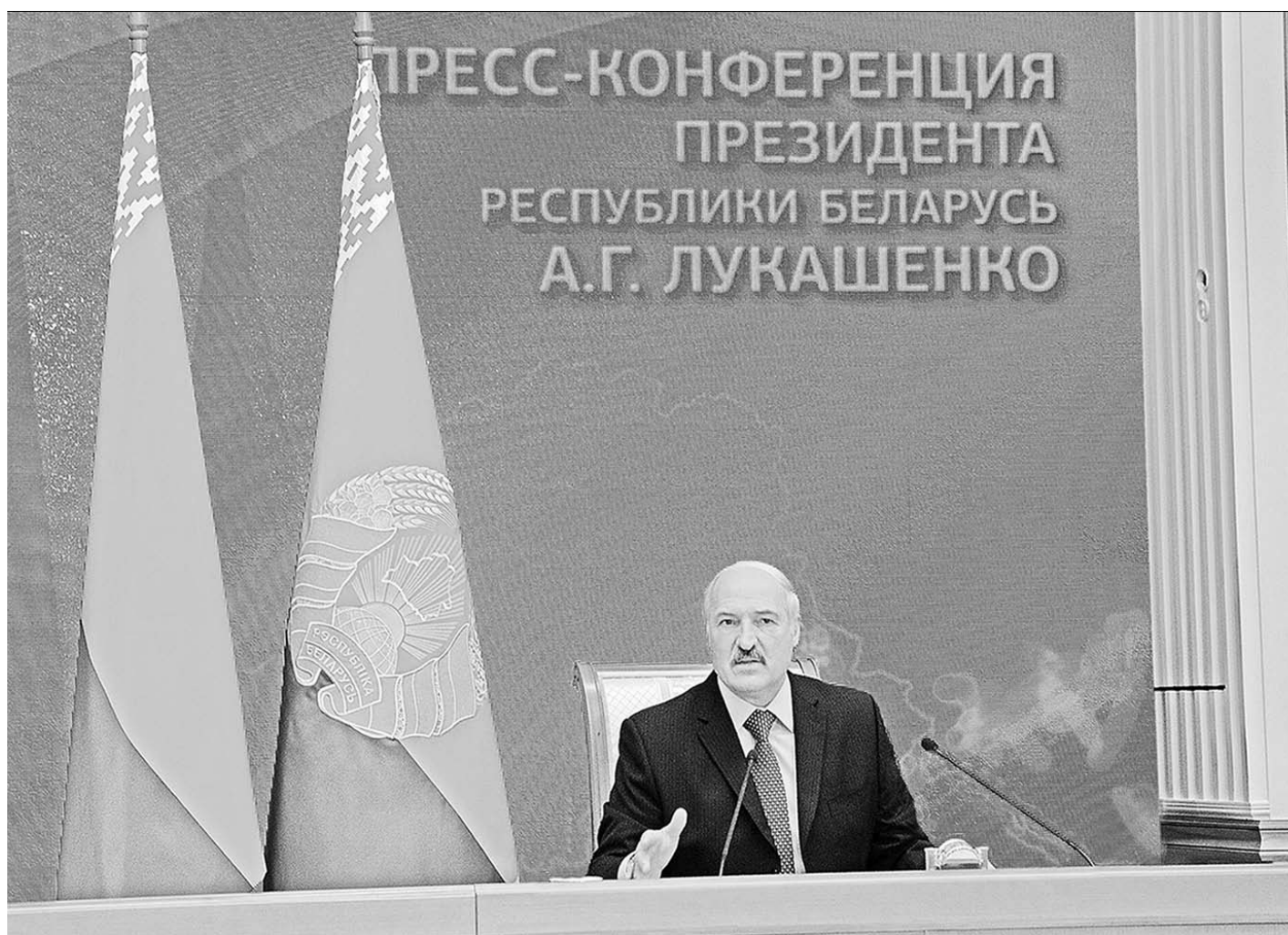
Александр Лукашенко почти шесть часов отвечал на вопросы российских региональных журналистов.

На какие проблемы власти следует обращать особое внимание? Александр Лукашенко считает, что это в первую очередь сферы, связанные с обычной жизнью людей. «Питание, одежда, спокойствие, безопасность – все, что вокруг человека, это главное. Потому что другие – обороноспособность и прочее – да, это важно, это одна из основных сфер нашего сотрудничества, но давайте говорить откровенно: никто на нас нападать завтра не будет и послезавтра тоже, зная,