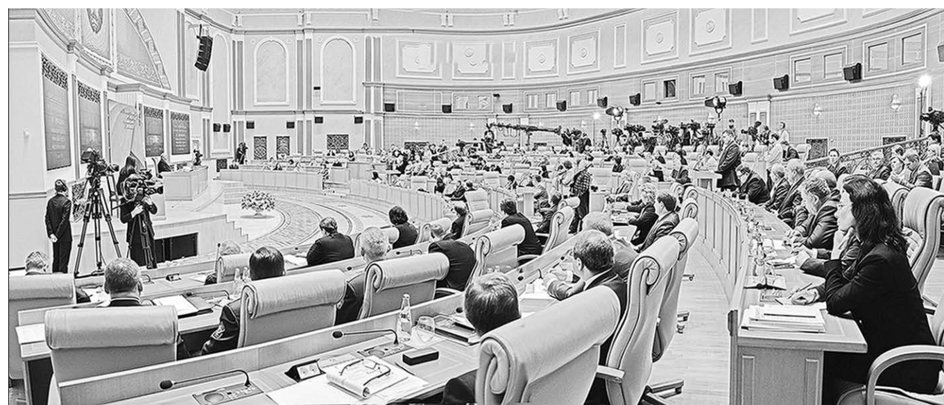
Пресс-конференция президента Республики Беларусь Александра Лукашенко. Минск, 17 ноября 2016 года.

«Главная цель таких встреч — сближение наших народов, возможность достичь объективную информацию о самой близкой и, надеюсь, самой родной для вас земле, — ска-