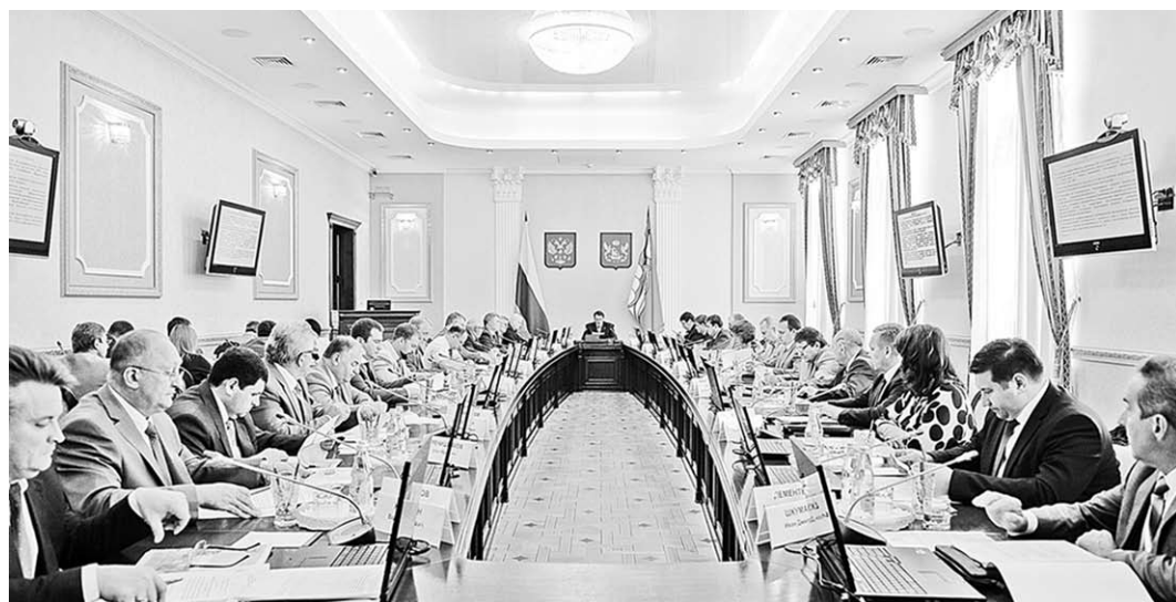
Об оптимизации нагрузки на областной бюджет речь шла, в частности, на состоявшемся 17 ноября заседании правительства Воронежской области.