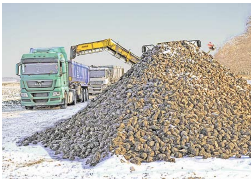
С копкой сахарной свёклы справились в положенные сроки, а вот вывезти её приходится уже по зиме.