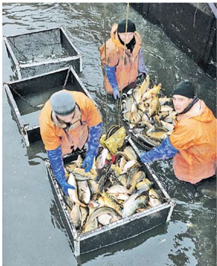
Полным ходом идёт промышленный вылов рыбы в нагульных прудах.

Одна из самых острых проблем – процесс формирования и распределения рыболовных участков. Ведь что по-