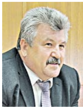
Сергей БЫЧУКОВ, глава администрации Эртильского района:

– Подводя основные итоги уходящего сельскохозяйственного года, мы можем отметить, что Эртильский район полностью выполнил целевые индикаторы по растениеводству. При плане производства зерновых и зернобобовых 116 тысяч тонн получено 143 тысячи тонн, сахарной свеклы планировалось получить 199 тысяч тонн, а произведено почти в два раза больше – 377 тысяч тонн, подсолнечника собрано свыше 27 тысяч тонн.