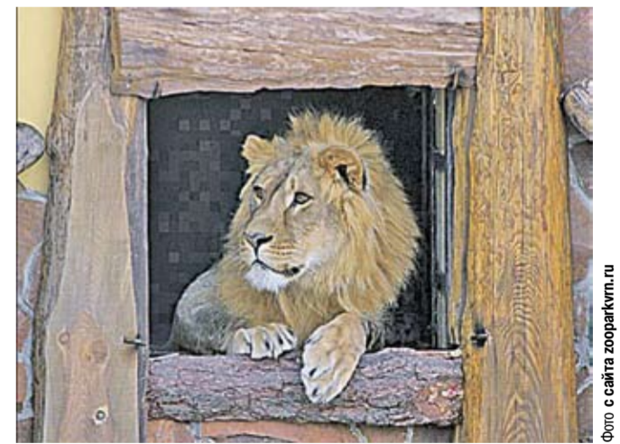
Альф изучает обстановку на «улице».

В Воронежском зоопарке имени А.С. Попова, несмотря на морозный ноябрьский день, выпустили в открытый вольер самца африканского льва.