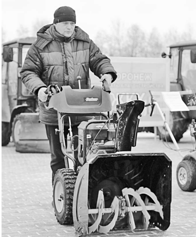
К новой технике – большой интерес.