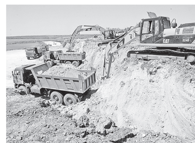
На строительстве железной дороги в обход Украины.

Заместитель министра обороны России Дмитрий Булгаков сообщил, что железная дорога в обход Украины будет введена в эксплуатацию на год раньше запланированного срока – 15 августа 2017 года.