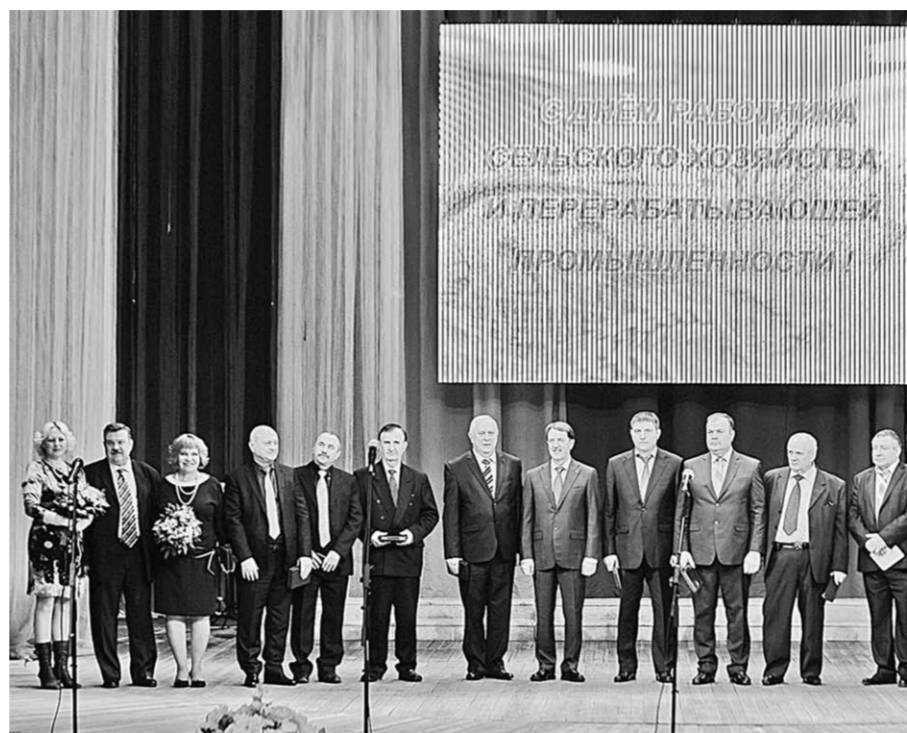
На сцене — главные герои праздника.

Успешно развивается в регионе мясной кластер. Воронежская область — лидер по приросту производства