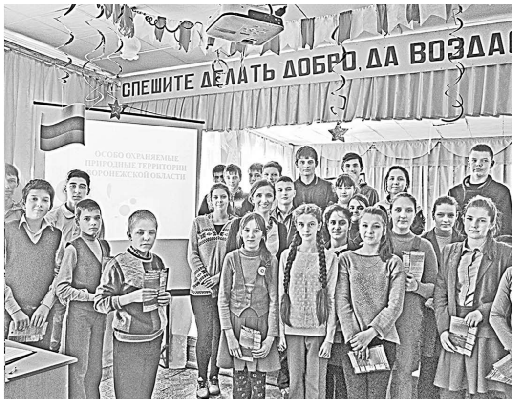
На уроке экологии в Охровской средней школе Кантемировского муниципального района.

Воронежской региональной общественной организацией «Центр экологической политики» реализован эколого-просветительский проект «Природное достояние воронежского края»