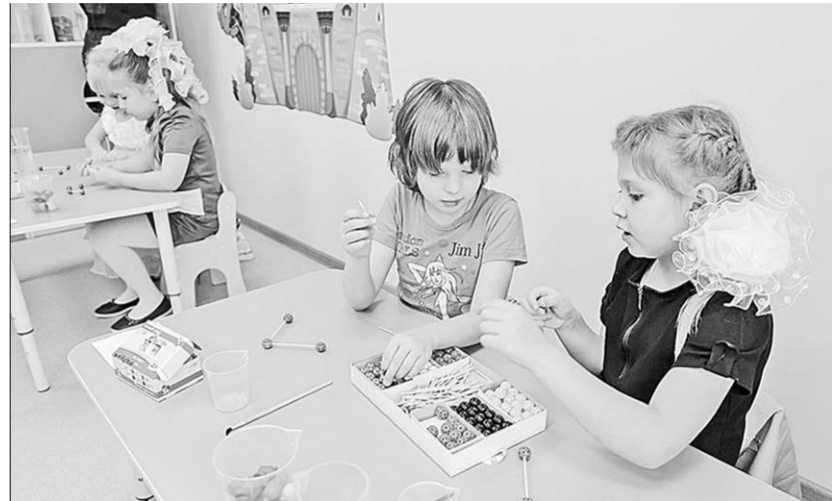
В детском саду ребята не только играют, но и готовятся к школе.

— Нам важно посмотреть, как у нас в селах сегодня развивается социальная инфраструктура. Мы, благодаря принятым программным мерам, уже восстанавливаем в селах социальные объекты, занимаемся благоустройством. Теперь надо сделать всё возможное, чтобы сохранить эти темпы и в ближайшие годы. Возможно, что какие-то крупные объекты, которые планировали, будут отложены до следующих лет. Однако всё, что касается благоустройства наших сельских районов и развития социальной инфраструктуры, мы про-