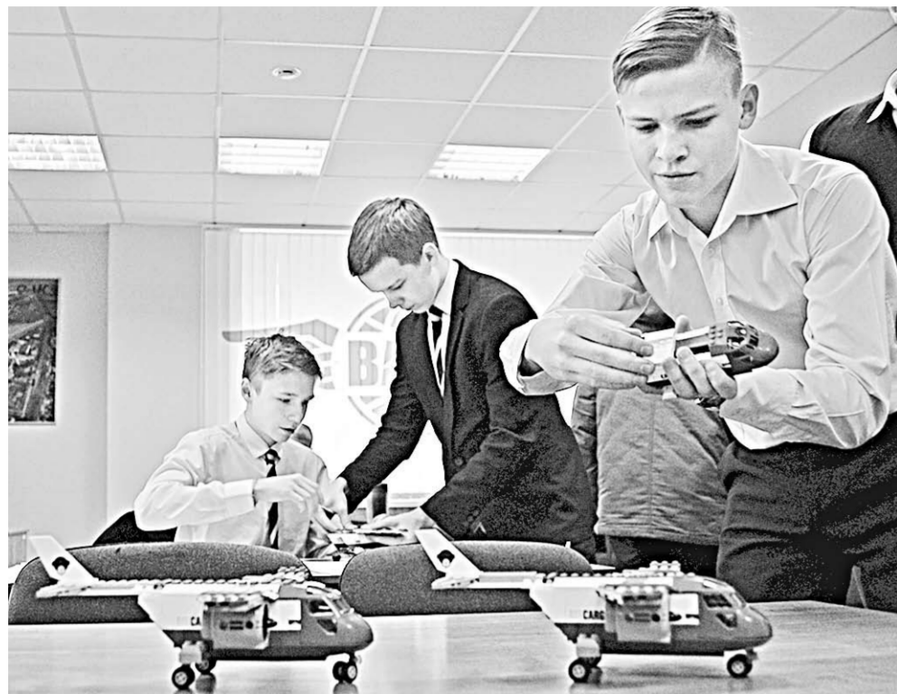
Школьники собирают самолёт.

Экономика | В Воронеже, на площадке ВАСО, прошёл День Объединённой авиастроительной корпорации