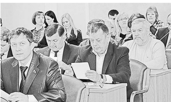
Депутаты особое внимание уделили проблемам двенадцати бывших городских сёл и посёлков.