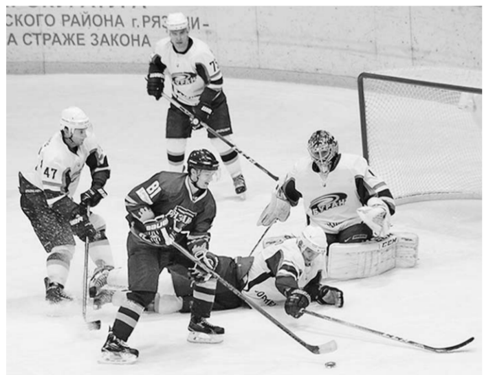
Хоккеистам «Рязани» удалось сломить сопротивление воронежцев лишь в серии буллитов.

Хоккейная «Рязань» отчаянно борется за попадание в число участников плей-офф, поэтому терять очки в поединке с аутсайдером в её планы явно не входило. И когда в середине матча на табло ДС «Олимпийский» горели цифры 4:1, вряд ли кто-то из игроков или болельщиков «Рязани» мог подумать, что дело дойдёт до овертайма и буллитов. Но всё вышло именно так.