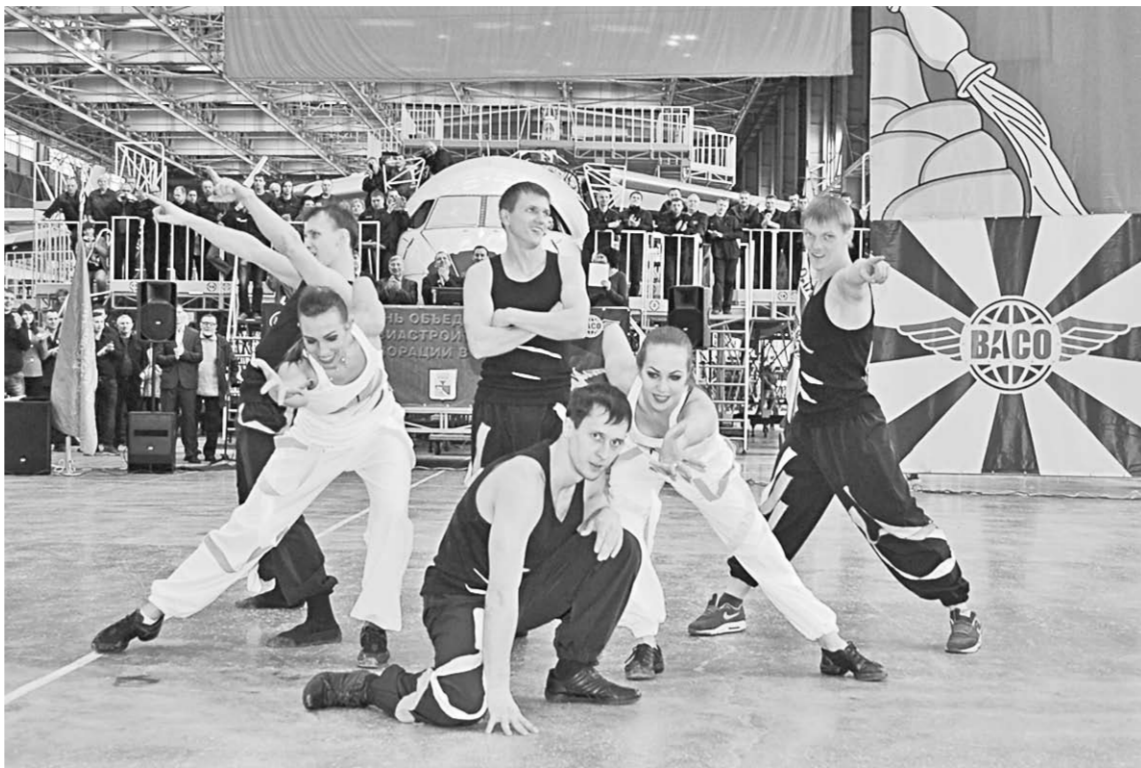
В День ОАК на авиазаводе были и музыкальные номера.

Юноши и девушки, которые раньше могли лишь мечтать о том, чтобы вволю посмотреть, как делают современные самолёты, в сопровождении сотрудников предприятия посетили заводские цеха, музей и даже собственноручно собрали летающие машины. Правда, не настоящие, а модели. Кто знает, может, спустя время некоторые из этих ребят свяжут свою взрослую жизнь с самолётостроением и будут решать те амбициозные задачи, какие стоят перед отечественным авиапромом.