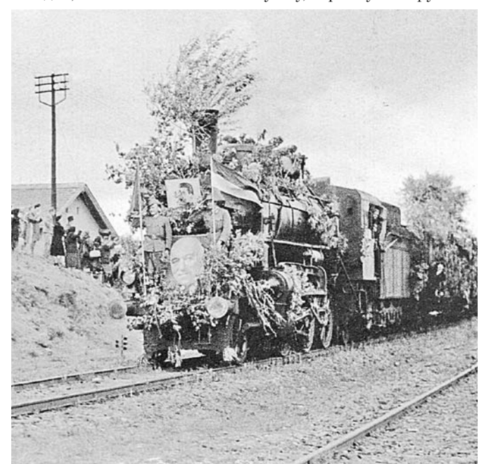
Поезд с бывшими венгерскими военнопленными прибывает из Советского Союза, г. Дебрецен, 17 июня 1947 г.

8 часов утра. Везде снег, холодно, но очень солнечная