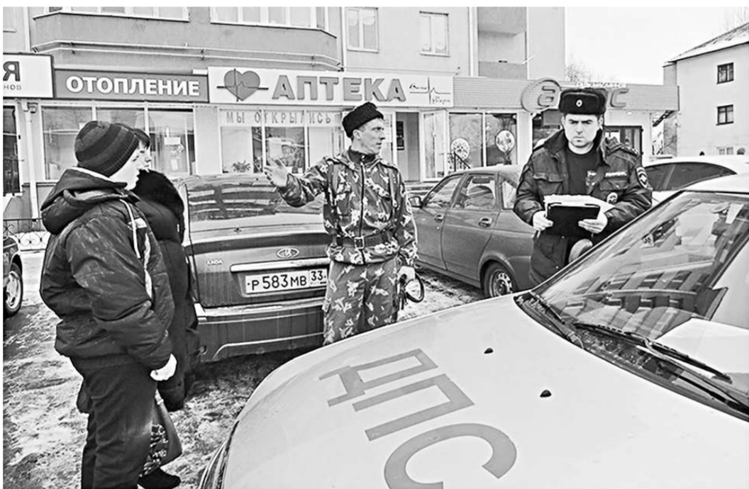
Выявлен ещё один нарушитель Правил дорожного движения.

Г.Лиски Уже первые минуты рейда показали: полное пренебрежение Правилами дорожного движения свойственно не только водителям и пешеходам, но и дорожникам, и даже городским чиновникам. У пересечения улицы Мира и проспекта Ленина чья-то безответственная голова умудрилась установить знак «Остановка по требованию», и маршрутки, останавливаясь, создают аварийную ситуацию, мешая обзору едущим в попутном направлении водителям. А пешеходы вынуждены обходить автобус спереди. Проблемной является и остановка у магазина «Зеркальный»: из-за отсутствия «кармана» автобусы тормозят прямо на проезжей части и тем самым создают угрозу и пешеходам, и водителям. Частая аварийность на пересечении автодорог на Давыдовку и Калач заставляет задуматься о необходимости установки здесь регулирующего светофора. По