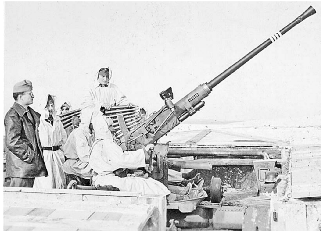
Венгерские зенитчики на берегу Дона. Декабрь 1942 г.

В Болдыревке госпиталь был переполнен. Но персонал больницы сменился. И они брали на лечение только раненных еврейских участников трудовых батальонов. Солдаты лежали и сидели у стены, никто ими не занимался. Мы попробовали ухаживать за ними, давали им есть и пить. Врачи и персонал