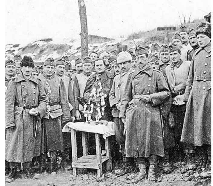
Венгры встречают Рождество в 1942 году в Придолье.