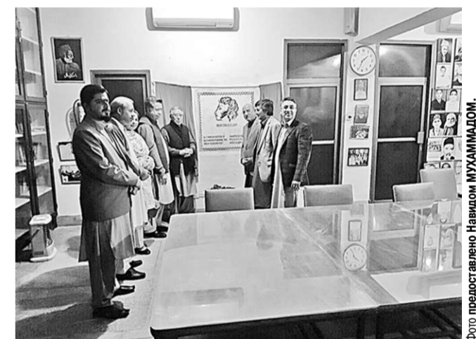
Пакистан, город Пешавар, 15 декабря 2016 года.

В пакистанском городе Пешавар вчера была открыта памятная доска и российский культурный уголок, посвящённые великому русскому поэту А.С. Пушкину.