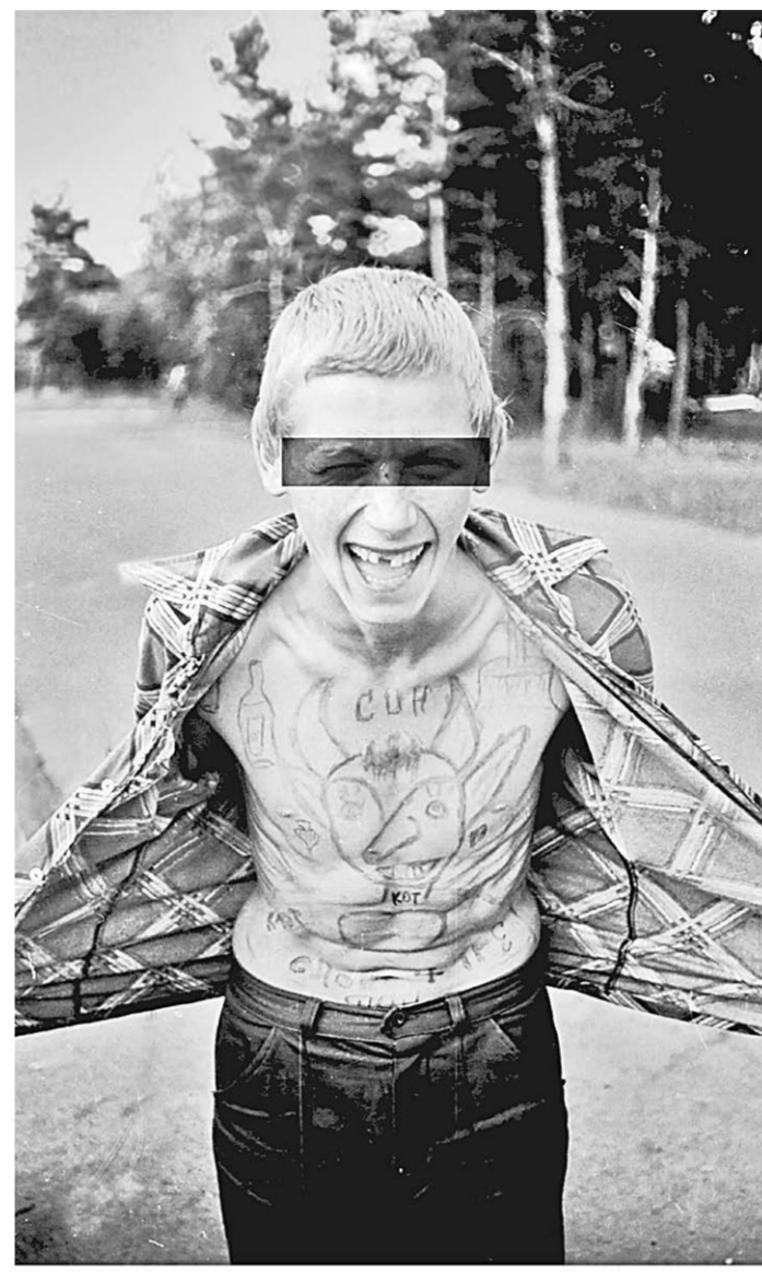
У родителей нелёгкая задача: уметь управлять эмоциями ребёнка.

Далее для каждого ребёнка начинал разворачиваться свой жизненный сценарий.