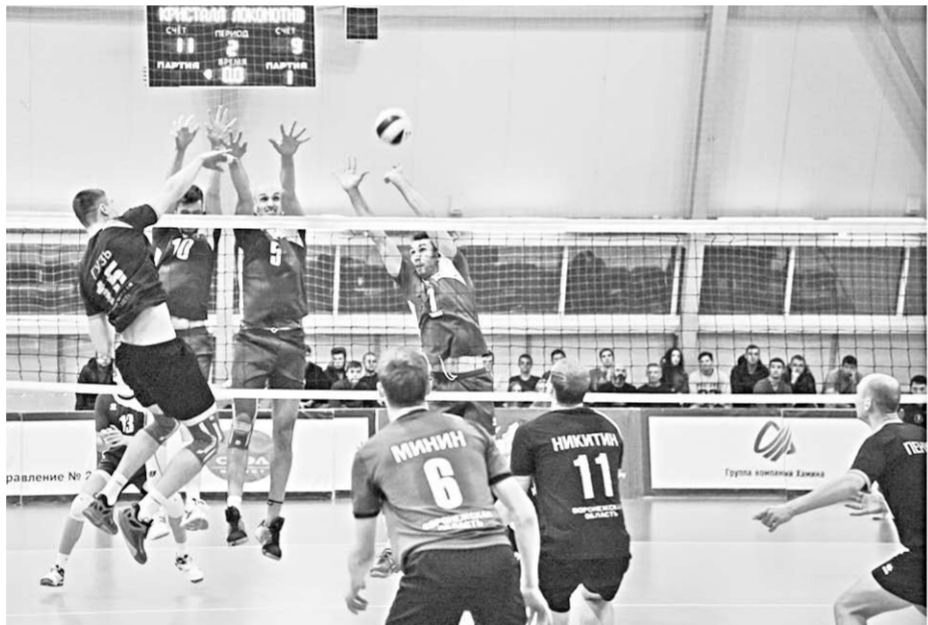
Победив в повторной встрече «Локомотив-Изумруд», воронежцы превалили череду неудач.