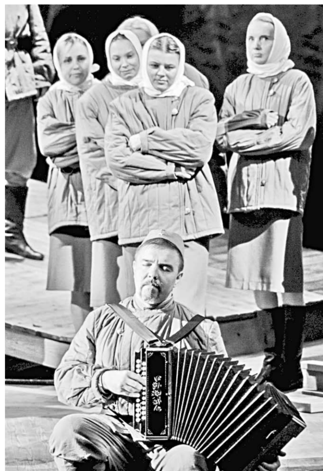
Сцена из спектакля «Василий Теркин».