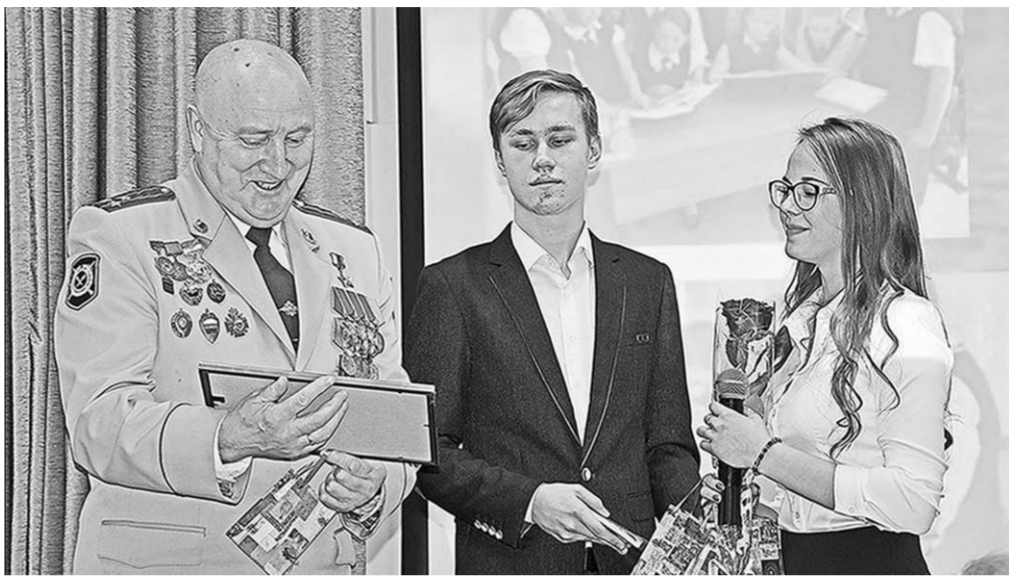
Молодых кантемировцев напутствовал Герой Российской Федерации Юрий Анохин.

В районном Доме культуры состоялся праздничный театрализованный концерт под