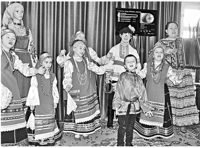
Чаепитие прошло под весёлые народные песни.

В России чай известен с первой половины XVII века. Повсеместное же его распространение произошло в начале XIX.