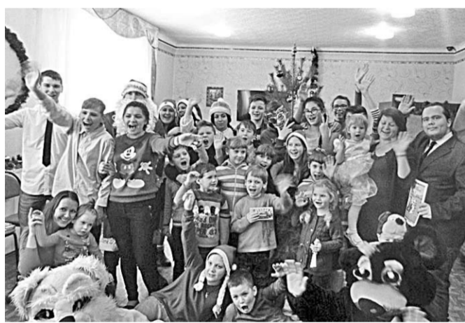
Вот так весело было в «Лучистом».