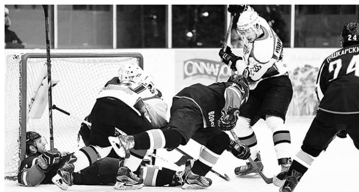
Домашний поединок с тюменским «Рубином» стал одним из худших в сезоне для нашей ледовой дружины.