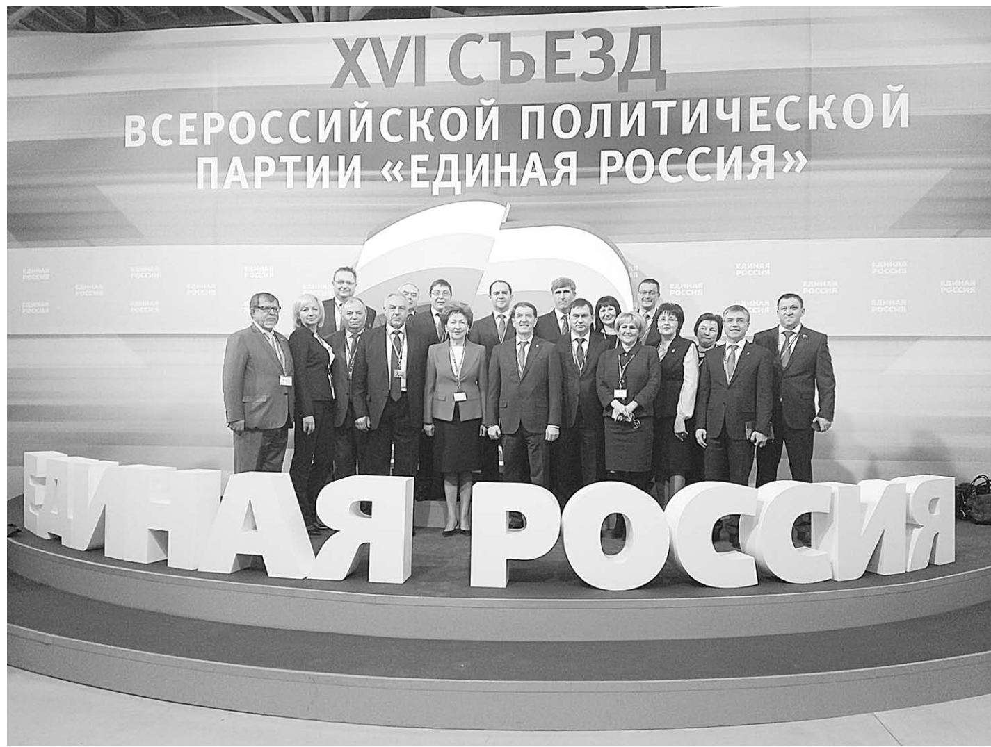
Делегация Воронежской области на съезде «единороссов».