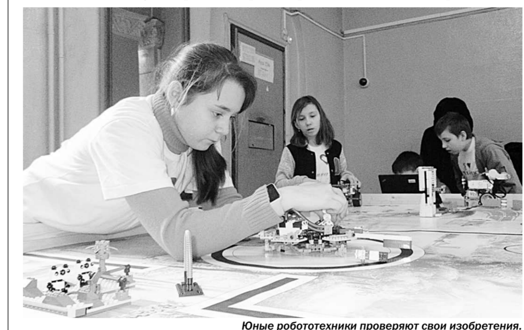
Юные робототехники проверяют свои изобретения.

Время молодых | В Воронеже прошёл робототехнический фестиваль