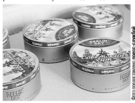
Эти банки и подвели фирму.

В адрес одного из воронежских предприятий, занимающего производством кондитерских изделий, поступило из Китая 15300 металлических банок с крышками.