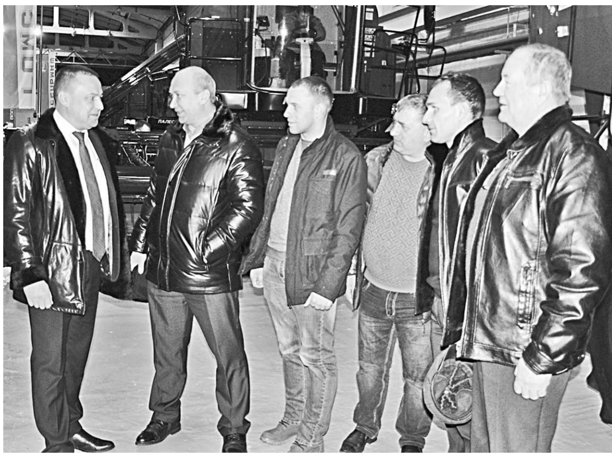
О комбайнах ПАЛЕССЕ – живой и заинтересованный разговор.

Широкий ряд такой техники и выпускает знаменитый завод в белорусском городе Гомель. К нему, к «Гомсельмашу», во многих отношениях можно применить слова «первый», «впервые в стране», «впервые в мире». В годы индустриализации выпуск первой партии приводных дисковых силосорезок на строящемся «Гомсельмаше» стал первым шагом к созданию в Советском Союзе ранее не существовавшей отрасли – машиностроения для кормопроизводства. В пятидесятые годы «Гомсельмаш» впервые в стране начал производство нового вида техники – прицепного силосуборочного комбайна СК-2,6А. За ним последовали модели СК-2,6А, СКБ-2,6, КС-2,6, КС-1,8 «Вихрь».