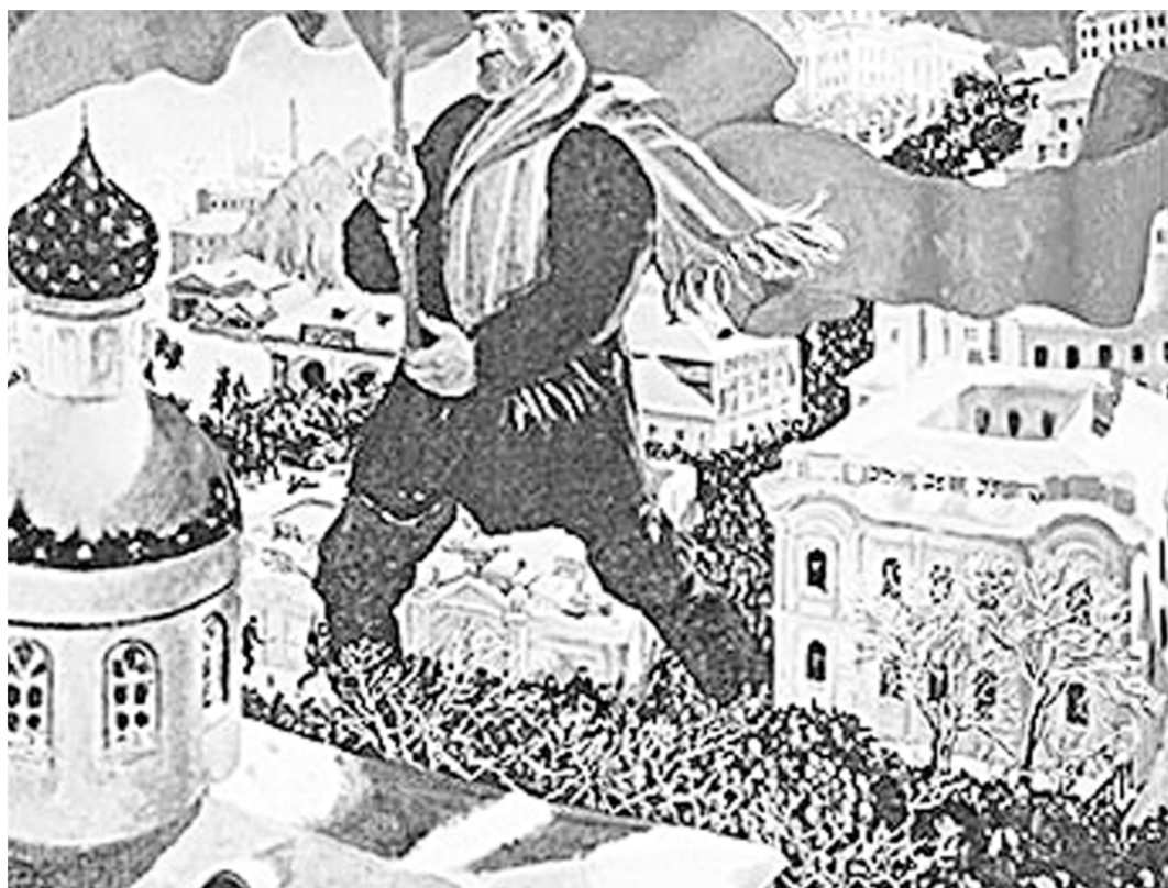
Б. Кустодиев. Большевик.