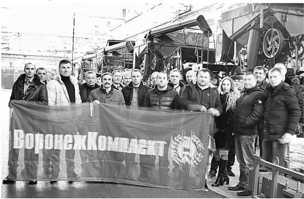
Организатором поездки в Гомель стала компания «Воронежкомплект» – официальный дилер ОАО «Гомсельмаш».

хорошо знакомы. Особенно популярны на полях Черноземья двухбарабанные ПАЛЕССЕ GS 12. Двухбарабанная система обмолота, благодаря предварительному ускорению движения хлебной массы, обеспечивает максимальную эффективность всех последующих процессов. Пропускная способность этих машин по хлебной массе составляет 12 килограммов в секунду. К тому же двухбарабанные комбайны, как считают специалисты, всегда имеют определенные преимущества, и прежде всего при уборке влажных и скрученных хлебов или той же кукурузы.