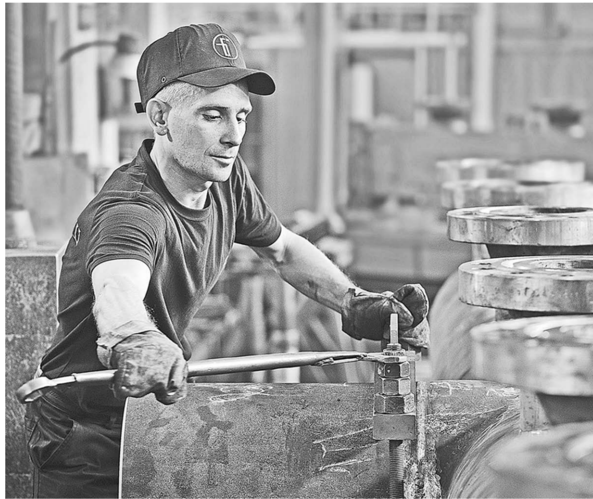
К 2020-2021 годам экономически активный потенциал страны сократится на два миллиона человек. И вот таких молодых квалифицированных рабочих будет не хватать на производстве.