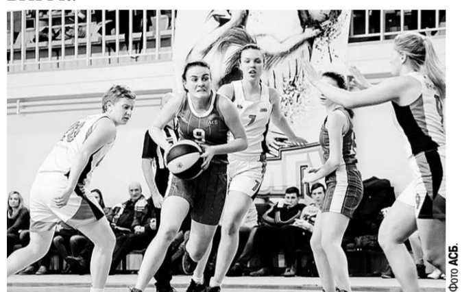
Студентки Воронежского института физкультуры (в светлой форме) стали триумфаторами финального турнира АСБ.

В Орле состоялся финальный турнир Ассоциации студенческого баскетбола (Высшая лига, группа «Сентр»), победителем которого стала женская команда ВГИФК.