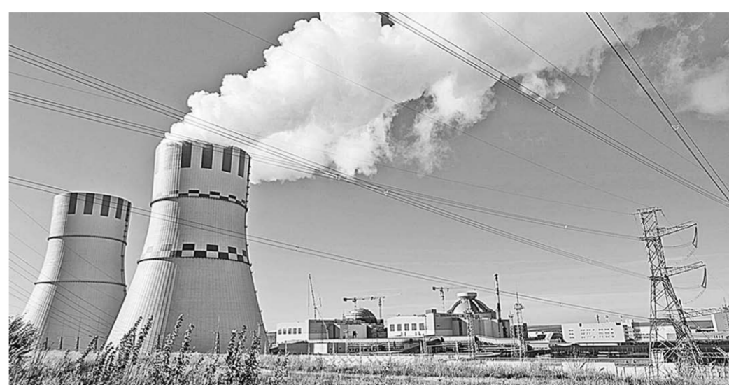
Строительство НВ АЭС-2 — самый масштабный инвестиционный проект на территории Центрально-Чернозёмного региона.

По сравнению с традиционными энергоблоками с реактором типа ВВЭР-1000 проект «АЭС-2006», по которому построен первый блок НВ АЭС-2, обладает рядом преимуществ, которые существенно повышают его экономические характеристики и безопасность. Так, электрическая мощность реакторной установки повышена на 20 процентов — с 1000 до 1200 МВт; срок службы основного оборудования (корпуса реактора и парогенераторов) увеличен в два раза — с 30 до 60 лет; за счёт высокой автоматизации и внедрения новых технологических решений количество персонала уменьшено на 25-30 процентов. Кроме того, энергоблок отвечает всем так называемым «постфу-