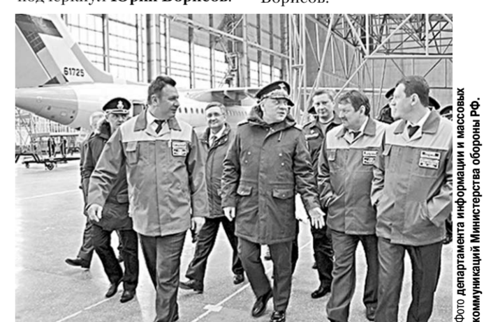
Заместитель главы военного ведомства уверен, что заказ будет выполнен в срок.

– Мы рады, что управление Юго-Восточной железной дороги находится в Воронеже, и гордимся традициями железнодорожников, их успехами, благодарны им за вклад в экономику и стабильность региона. Сегодня мы наметили пути решения накопившихся проблем, а они есть и в основном связаны с передачей профильных активов, со строительством тех или иных инженерных сооружений. Договорились, что мы поднимем совместный план действий и все эти вопросы возьмём под контроль. Я удовлетворён, как мы совместно работаем, – подвёл итог совещания губернатор Алексей Гордеев.