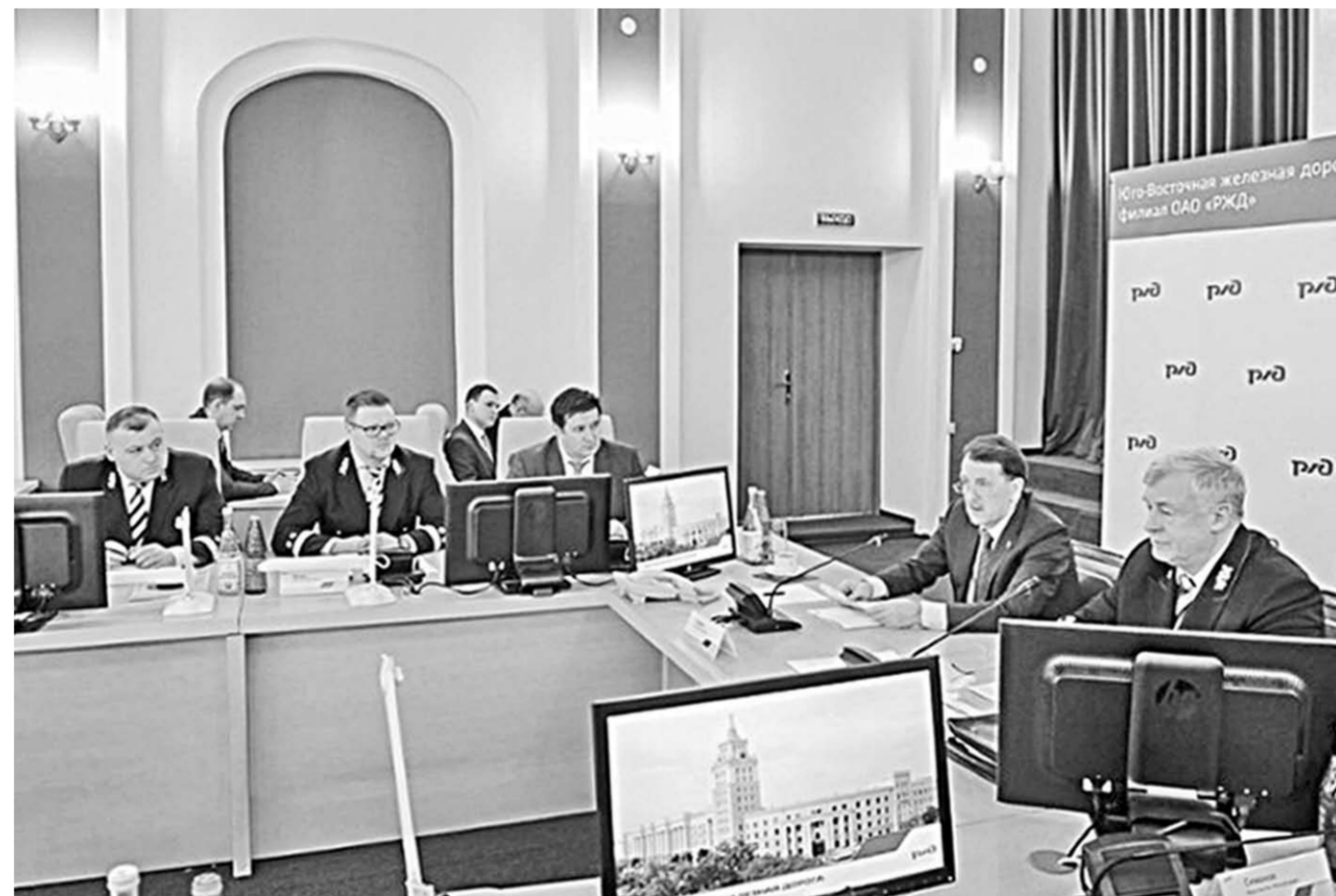
Алексей Гордеев: «ЮВЖД играет важную роль в развитии экономики Воронежской области».

– Сегодня Воронежская область выделяет более 300 миллионов рублей в год,