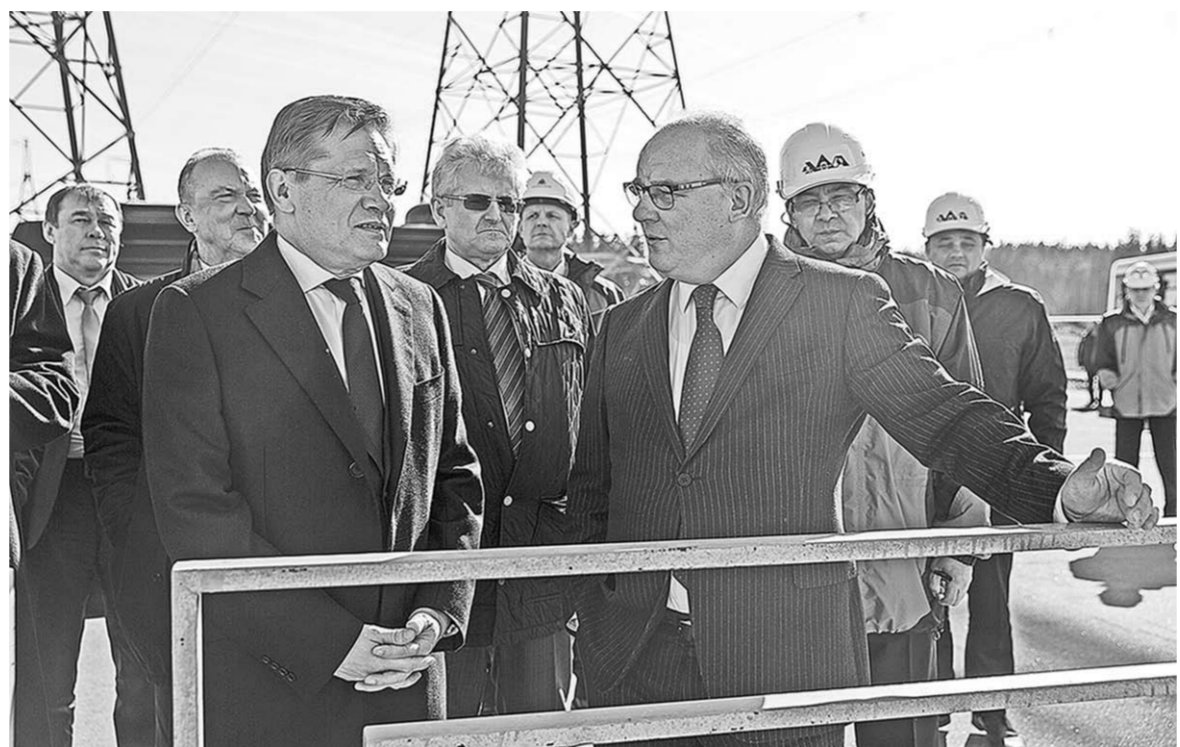
Алексей Лихачёв (слева) на смотровой площадке.