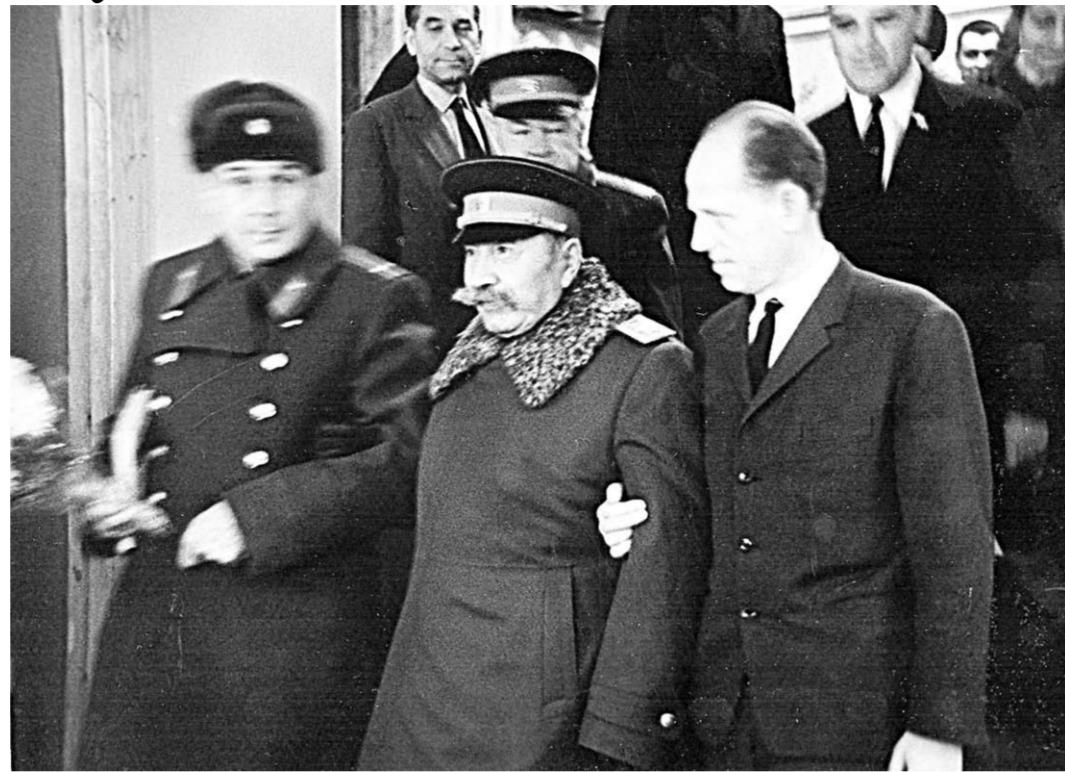
Маршал Будённый и Георгий Струков (справа).