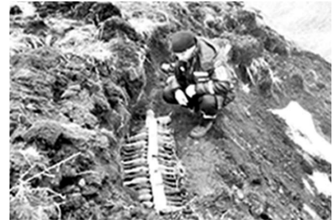
Эти найденные снаряды и мины уничтожены.

С наступлением тепла и началом работ на земле повышается вероятность найти снаряд или мину. Так, при производстве земляных работ в Хохольском районе были обнаружены боеприпасы.