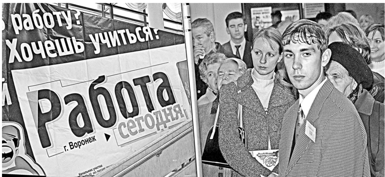
Число желающих получить работу в 2017 году почти в три раза превышает количество вакансий.

Аналитика | В 2017 году темпы роста числа соискателей на российском рынке труда почти втрое обгонят темпы увеличения числа предлагаемых вакансий