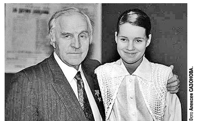
Народный артист СССР Михаил Ульянов с внучкой.

На факультете журналистики Воронежского государственного университета открылась не совсем обычная выставка фотографий.