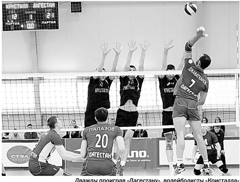
Дважды проиграв «Дагестану», волейболисты «Кристалла» крайне усложнили своё турнирное положение.