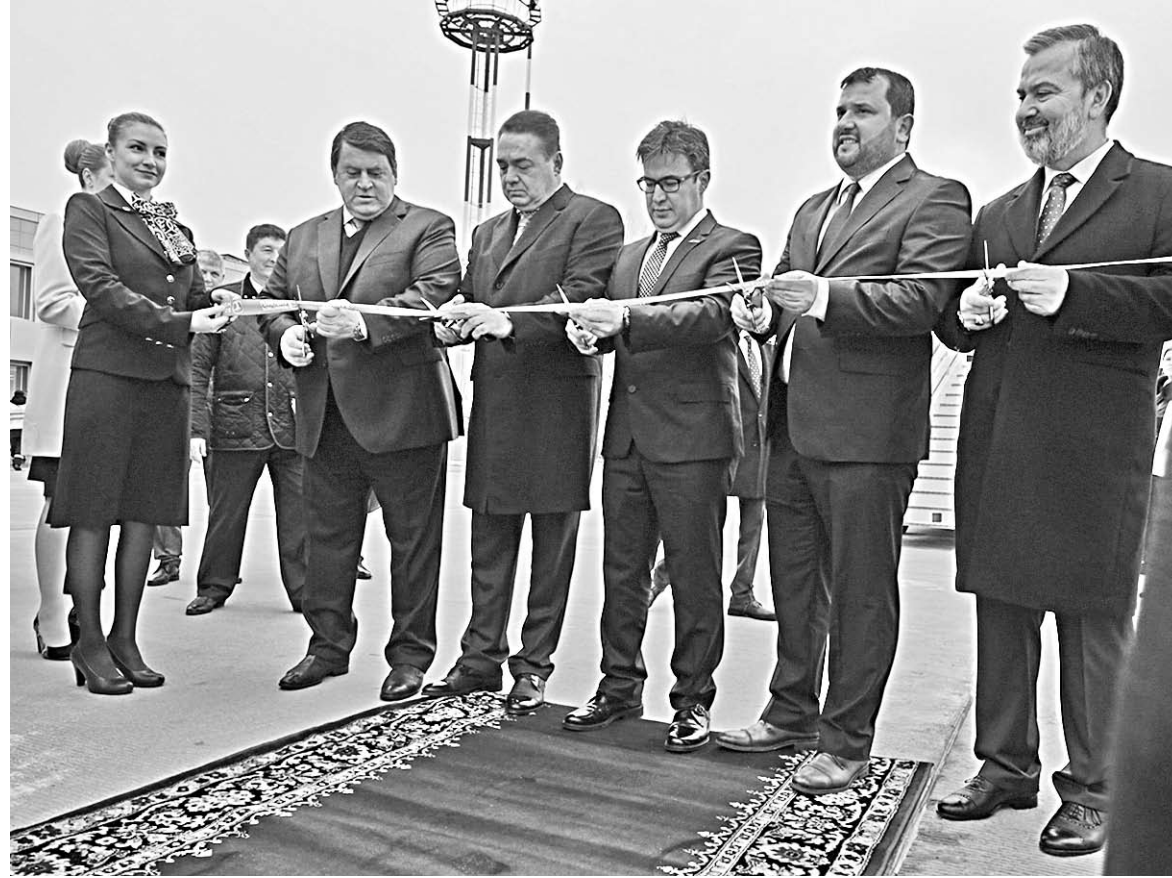
Торжественная встреча первого регулярного рейса из Стамбула в Воронеж.

– Не сомневаюсь, что новое направление будет пользоваться спросом не только у воронежцев, но и жителей соседних регионов.