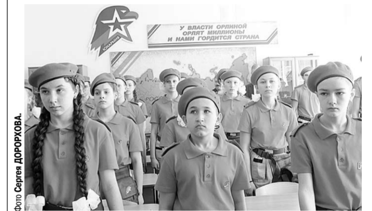
Быть юнармейцем для воронежских школьников – большая честь.