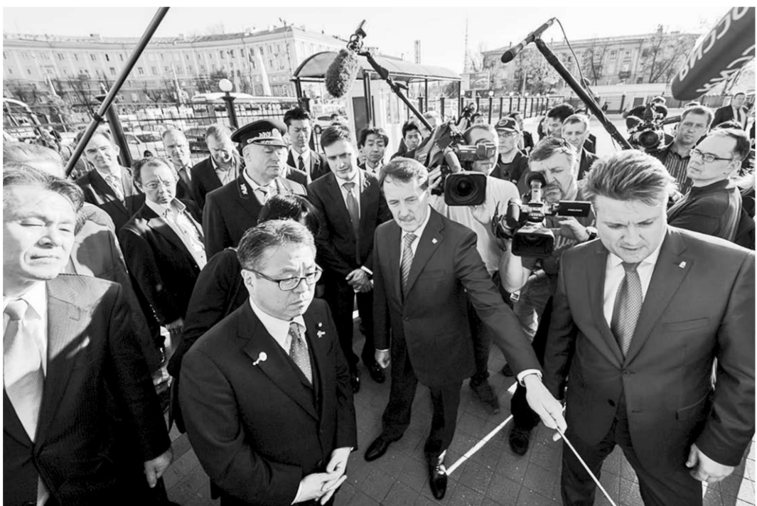
На территории вокзала был презентован проект транспортно-ориентированного развития городского пространства.

Здесь же состоялось подписание договора подряда на строительство «умного дома» между Nice Corporation, ОАО «ДСК» и ВГАСУ в присутствии губернатора Алексея Гордеева, министра экономики, торговли и промышленности Японии, министра по развитию экономического сотрудничества с Россией Хиросигэ Сэко и заместителя министра строительства и жилищно-коммунального хозяйства Российской Федерации Андрея Чибиса.