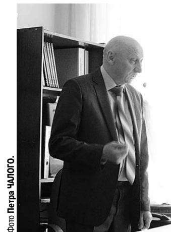
Выступает поэт Александр Нестругин.