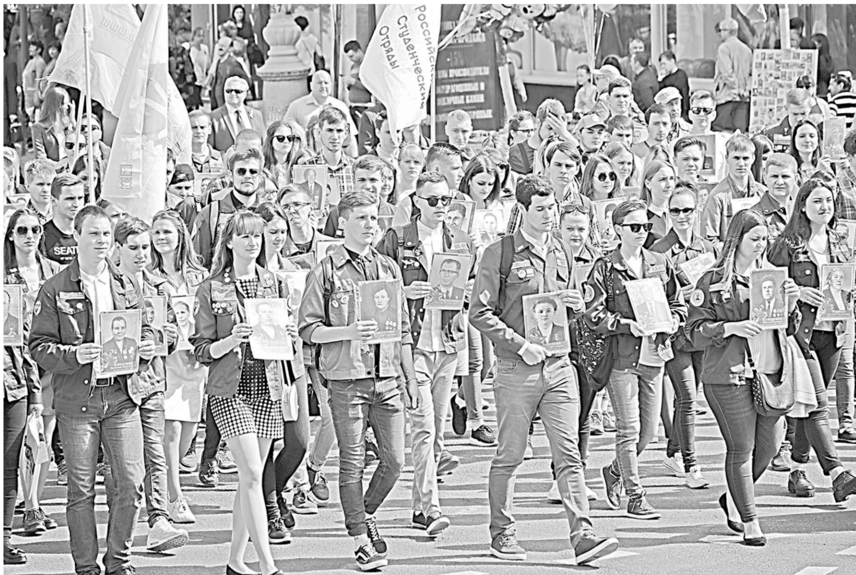
«Марш Труда» — первый шаг к созданию новой патриотической традиции.

Цветы, воздушные шары, флаги и транспаранты — в руках у участников шествия были все атрибуты Первомая. В этот раз к традиционным лозунгам «Мир! Труд! Май!» добавились и более конкретные, отражающие ту ситуацию в экономике страны, которую