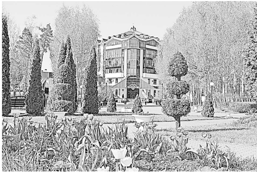
Чарующее великолепие природы средней полосы России вкупе с обширной лечебной базой создают невероятную атмосферу здравницы.

Санаторий «Красиво» – это специализированное лечебно-оздоровительное учреждение предназначено для оздоровления и восстановления сердечно-сосудистой системы, органов пищеварения, опорно-двигательного аппарата и нервной системы, органов дыхания. Здесь проводятся современные виды диагностики: клинические, биохимические исследования крови, все виды ультразвуковой диагностики, функциональной диагностики, видеофиброгастроскопии, денситометрия. Применяются новейшие методики по исследованию гормонов щитовидной железы, онкомаркеров. В практике лечения больных широко используются различные виды климатотерапии, водолечения, шунгитолечения, грязелечения, глинотерапии, магнито- и лазеротерапии, гирудотерапии, всех видов массажа, фитотерапии, рефлексотерапии, мануальной терапии, вытяжения позвоночника. Большой популярностью пользуется процедура внутривенной и внутримышечной озонотерапии, мониторинг очищения кишечника. Освоена и успешно применяется лечебная методика скандинавской ходьбы. Востребована современная кинезотерапевти-