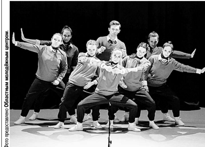
На сцене – самодельные артисты ВГУ.

Итоги фестиваля самодельного творчества студентов образовательных организаций высшего образования «Студенческая весна – творчество молодежи» обнародовали на гала-концерте. Во время финального шоу по традиции показали лучшие номера конкурсного отбора, заочные туры которого проходили в вузах нашей области с начала весны. Очные отборочные туры заняли три насыщенных концертных дня.