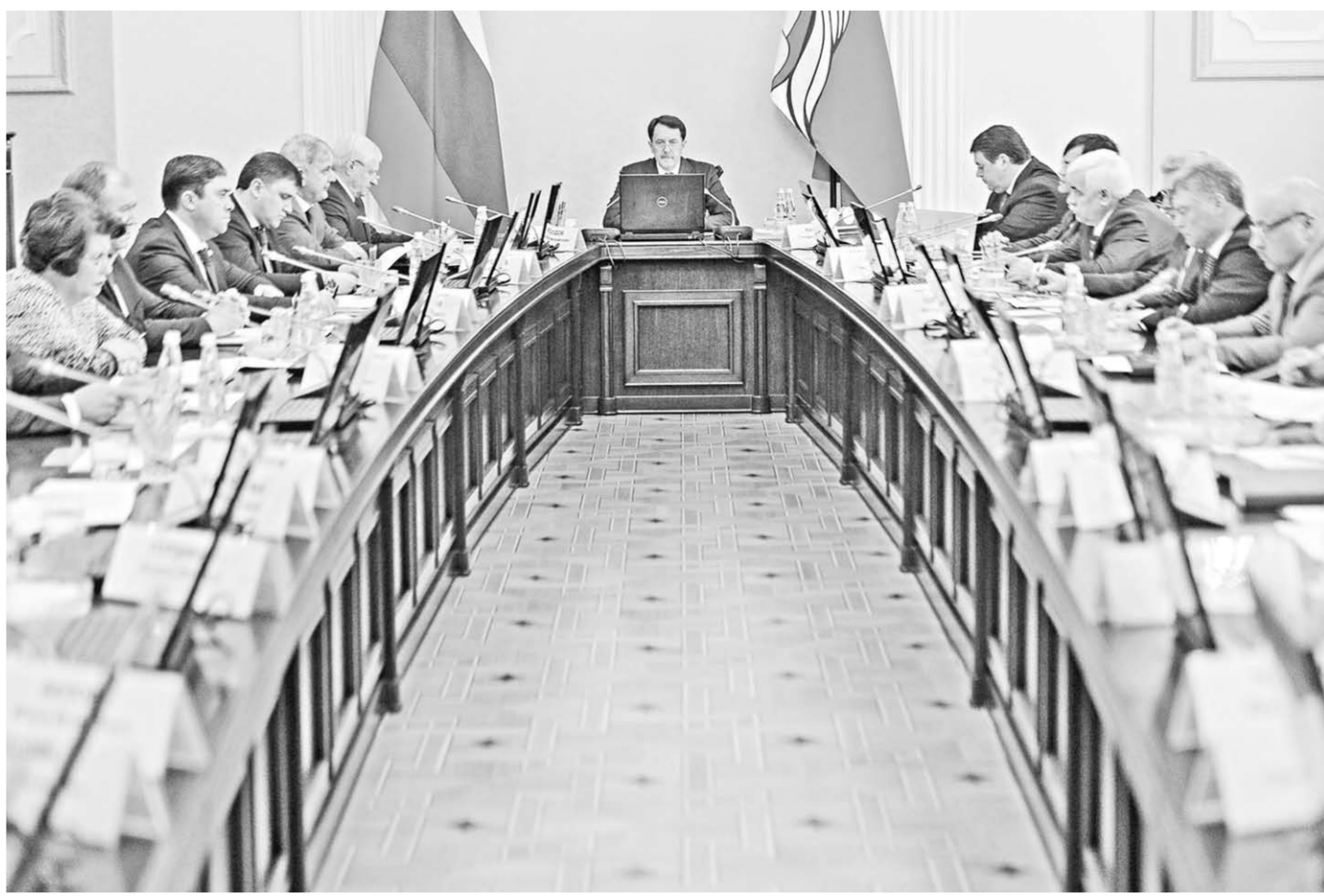
Заседание правительства Воронежской области ведёт губернатор Алексей Гордеев.

всматривались в более крупные от времени фотокарточки. На них навсегда застыли значимые для завода события: митинг рабочих после успешного завершения полёта на Ан-10 по маршруту Воронеж – Ташкент – Тбилиси в 1958 году, торжественное шествие в честь награждения предприятия орденом Трудового Красного Знамени в 1981-м, сборка дальнего реактивного бомбардировщика Ту-16... А ещё здесь представле-