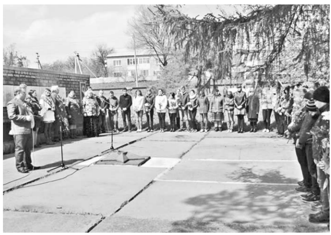
Акция «От обелиска к обелиску» прошла в каждом населённом пункте Кантемировского района.

Акция памяти с таким названием завершилась в Кантемировском районе.