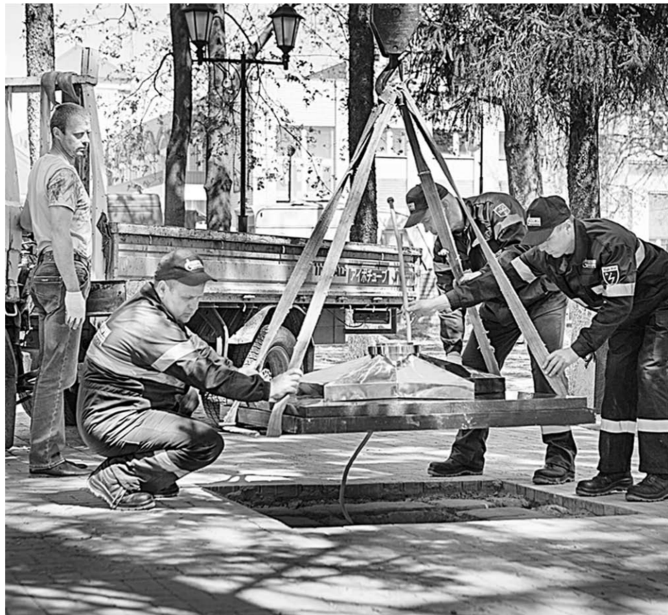
Теперь Вечный огонь в Боброве будет гореть круглосуточно.

Обустроить быт участников войны – самое малое, что можно сделать для подаривших нам мирное небо над головой. В преддверии Дня Победы газовики безвозмездно газифицируют домовладения ветеранов, устанавливают газовое оборудование, а также производят его ремонт, замену или обслуживание. К 72-й годовщине Победы такую поддержку и «наркомовский паёк» получили многие участники Великой Отечественной войны, которые проживают в столице Черноземья и в районах Воронежской области.