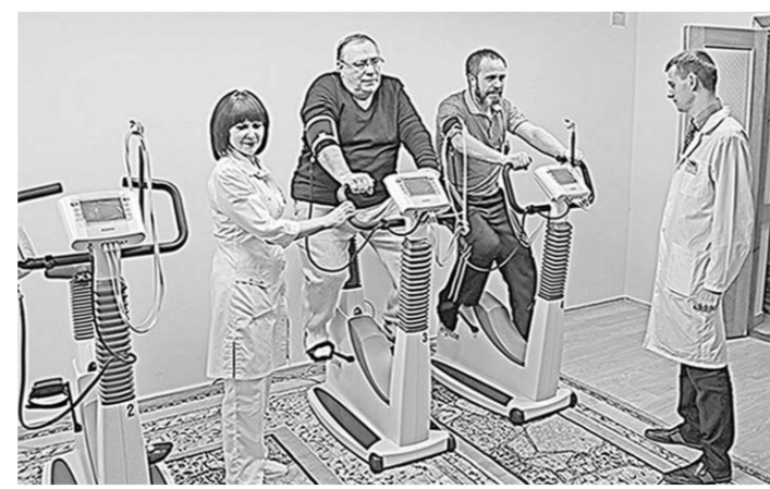
В санатории применяются современные лечебные технологии.

Гарантируем вам максимальное внимание, высокое качество обслуживания, эффективное лечение, отличный отдых.