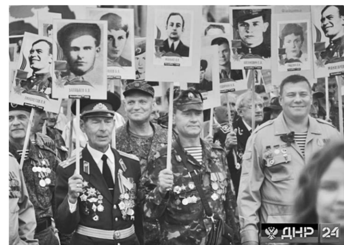
9 мая 2017г. «Бессмертный полк» шагает по главной улице Донецка.

«Армия ДНР – это исключительные алкоголики, наркоманы и эзки, люди массово бегут из республики на Украину, в Донецке нет ни работы, ни еды, ни медикаментов, ничего – в общем, все умерли». Вот так украинские СМИ пляшут под дудку киевского режима в Киеве и преподносят ситуацию как в Донбассе, так и на Украине в выгодном для него свете. Но как же обстоят дела на самом деле? – задают вопросы журналисты «Новостного агентства Харьков».