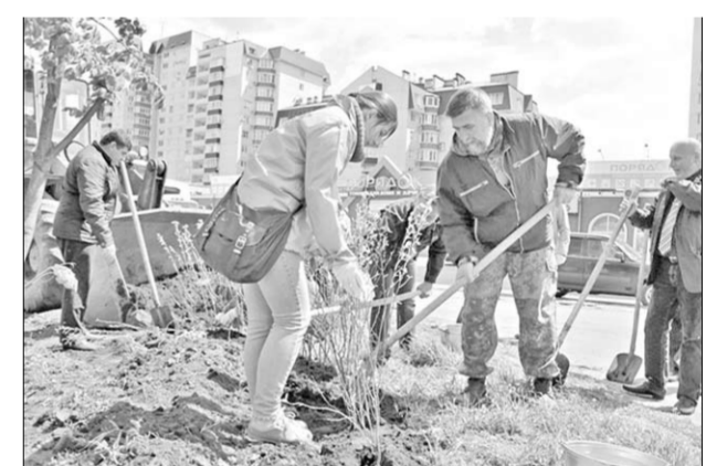
Всего лишь за один день у дома появилась липовая аллея.

В прошедший четверг у дома №55 по улице Владимира Невского сотрудники комбината по благоустройству Коминтерновского района и активисты Общероссийского народного фронта высадили липовую аллею.