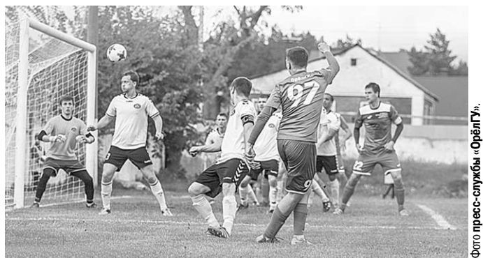
Футболисты новоусманского «Олимпика» (в светлой форме) ушли от поражения в поединке с коллективом «Орёл-ГУ», заработав первое очко в первенстве.

После четырёх туров без очков потерь идут новомосковский «Химик» и курский «Авангард-2». «Атом» занимает пятое место, «Локомотив» – восьмое, а остальные представители Воронежской области пока обосновались на нижних этапах турнирной таблицы.