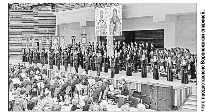
В праздничном концерте приняли участие 36 хоровых коллективов Воронежа.

В Воронеже торжественно отметили День славянской письменности и культуры.