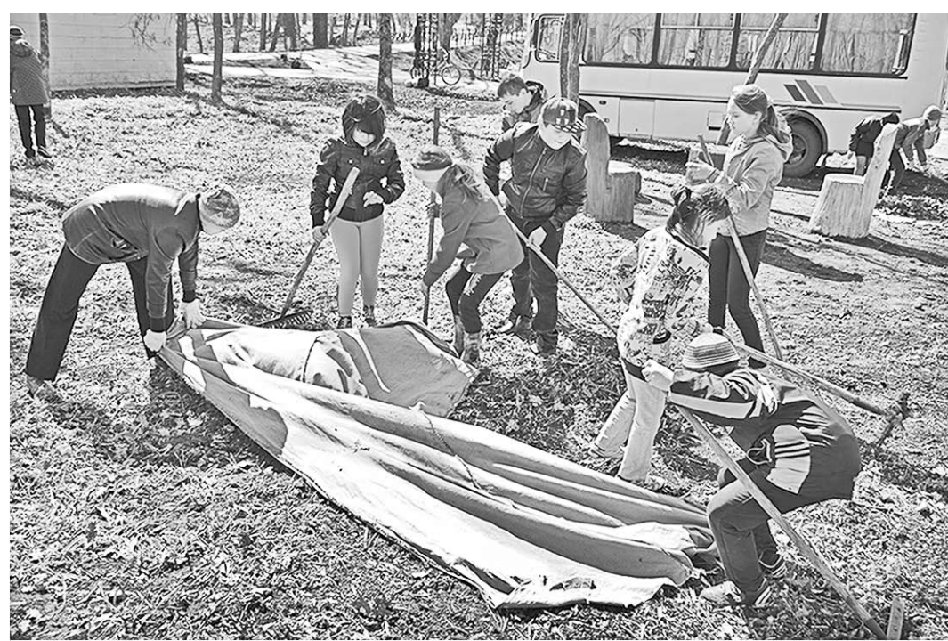
Школьники на очередном субботнике в парке.

В этом мы и сами убедились, когда подошли к недавно установленному в парке бюсту