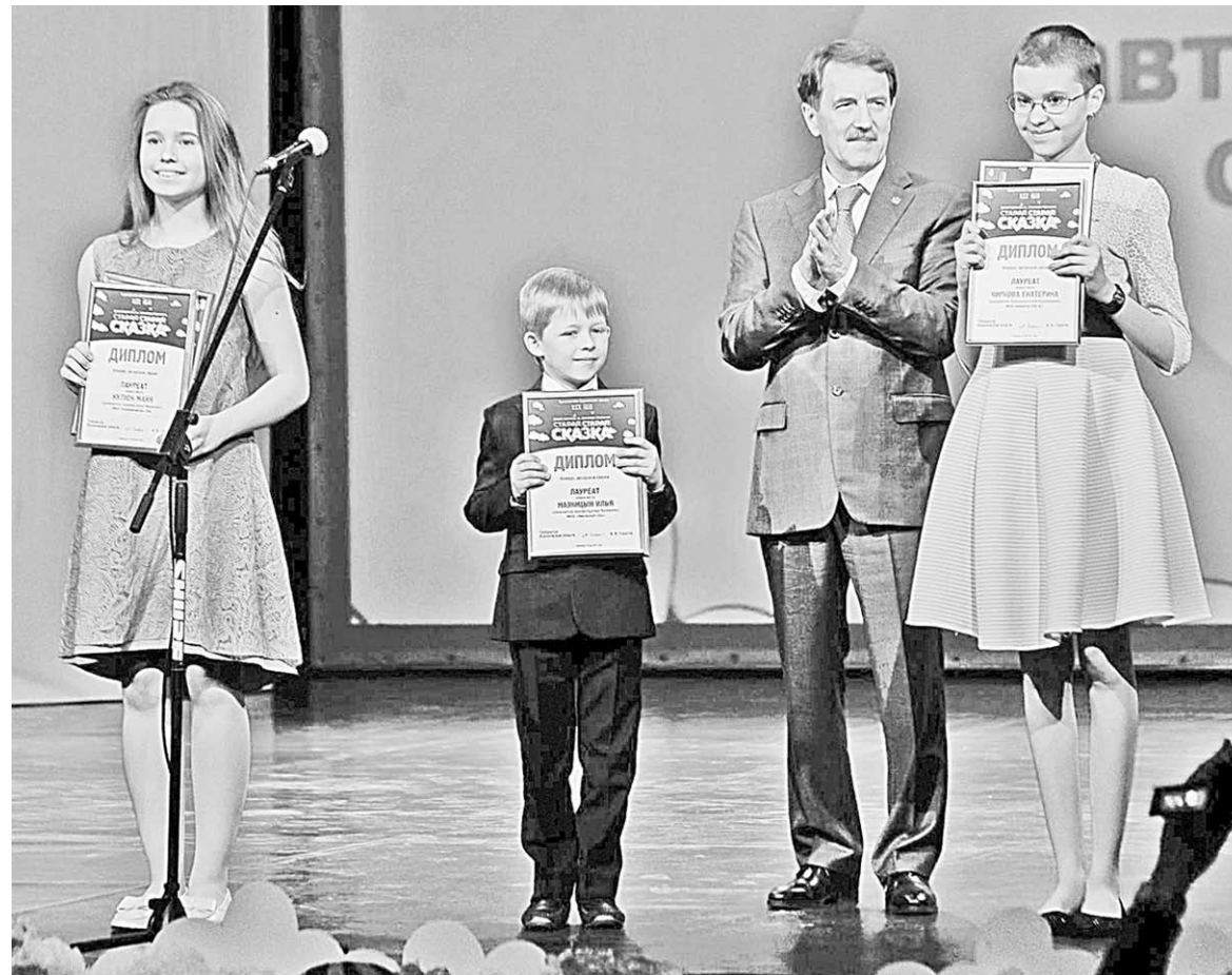
Алексей Гордеев с победителями в номинации «Конкурс авторской сказки».

Обращаясь к ребятам, губернатор выразил уверенность в том, что опыт, полученный ими на фестивале, обязательно пригодится в дальнейшей жизни. Здесь такая веселая, добрая, непринужденная атмосфера, и когда ты видишь много талантливых ребят, то понимаешь, что это – наше будущее. И хочу вам сказать, ребята, как здорово, что вы участвуете в фестивале, который собрал более семи тысяч детей, и в котором много номинаций. Все это пригодится вам в жизни. Человек, который смолоду имеет опыт, знания, принимает участие в творческих конкурсах, потом уверенно идёт по жизни. Это – мощный фундамент для того, чтобы человек был сильным и счастливым. Фестиваль выполняет очень важную