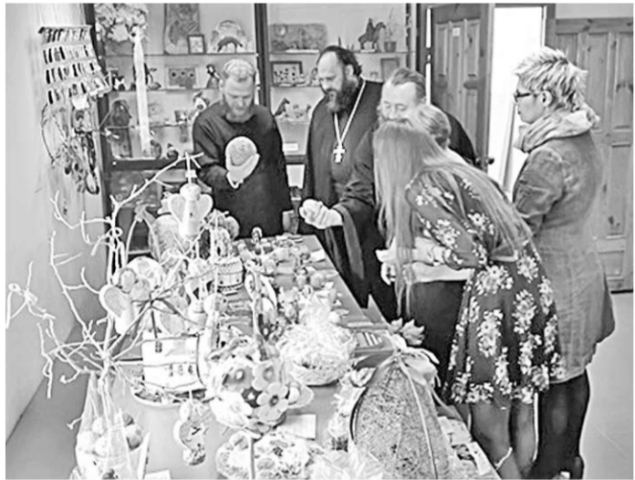
На выставке работ участников конкурса.

Подведены итоги епархиального конкурса детского художественно-декоративного творчества под таким названием.