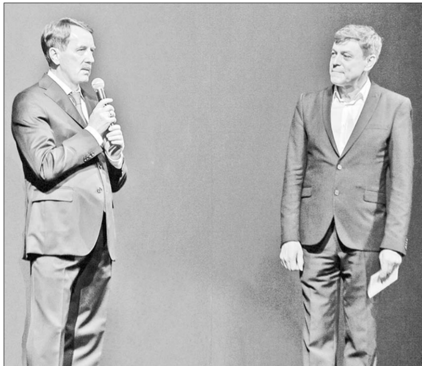
Губернатор Алексей Гордеев: «Седьмой Международный Платоновский фестиваль искусств открыт».

– Это ожидаемое событие, – подчеркнул Алексей Васильевич. – Фестиваль завел зрителей не только в Воронежской области. Его знают по всей нашей стране.