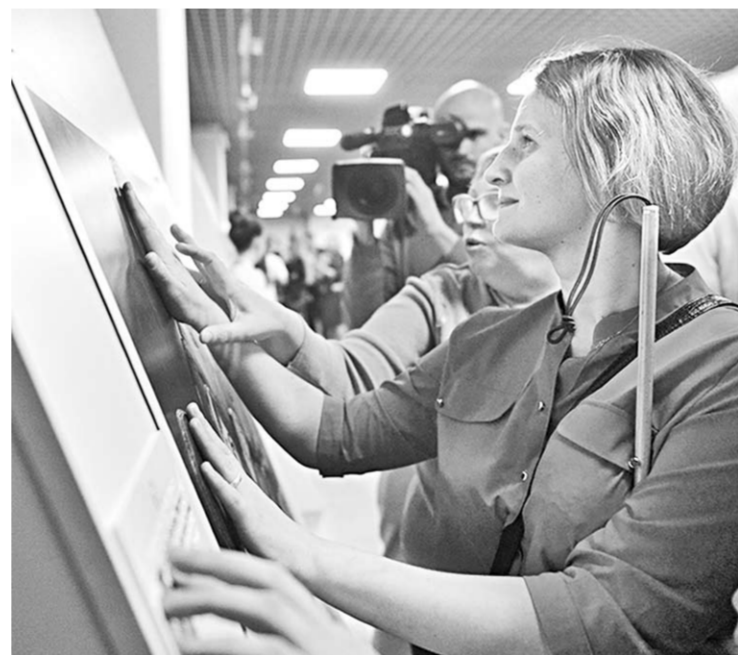
Общение с тактильной картиной – незабываемый опыт.

Зрячие посетители также могут открыть для себя принципы