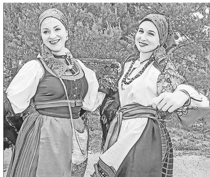
Фестиваль «На Троицу» стал замечательным праздником народной культуры.

В минувшее воскресенье в Новой Усмани прошёл XIX Межрегиональный фестиваль «На Троицу».