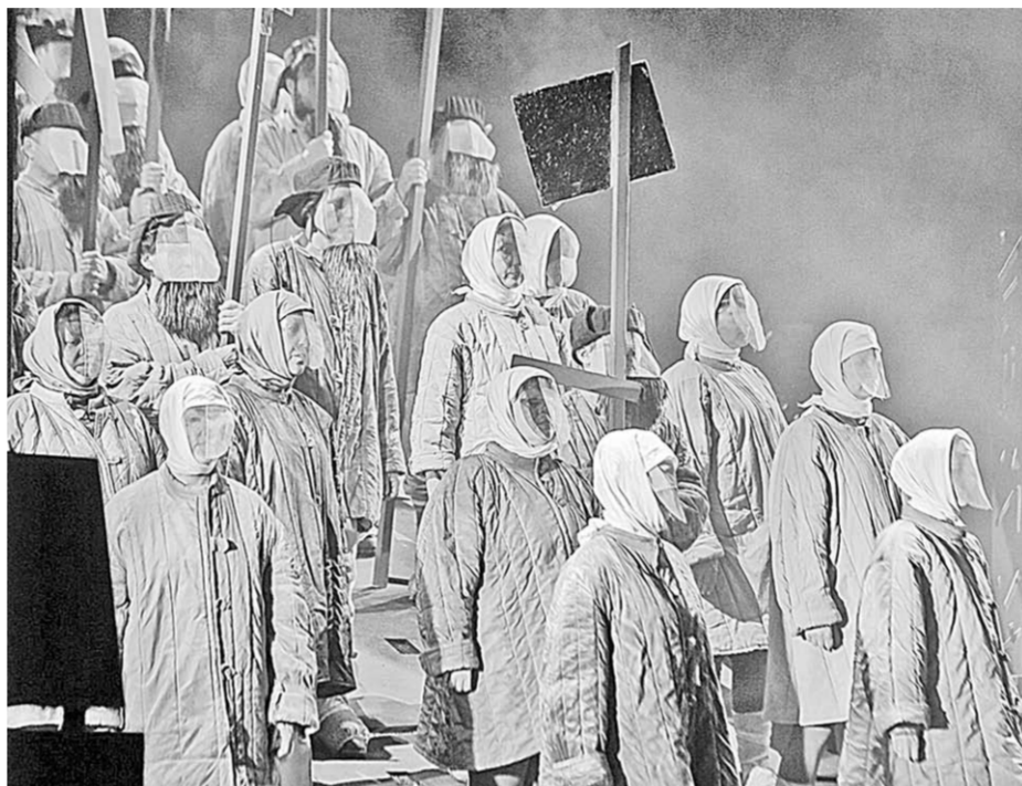
Сцена из оперы «Родина электричества».

...После того как стихли долгие овации, зрители были приглашены к обсуждению премьеры. Участники дискуссии сошлись на том, что попытка постижения эпохи, пережитой в прошлом веке нашей страной и ее людьми, удалась создателям спектакля.