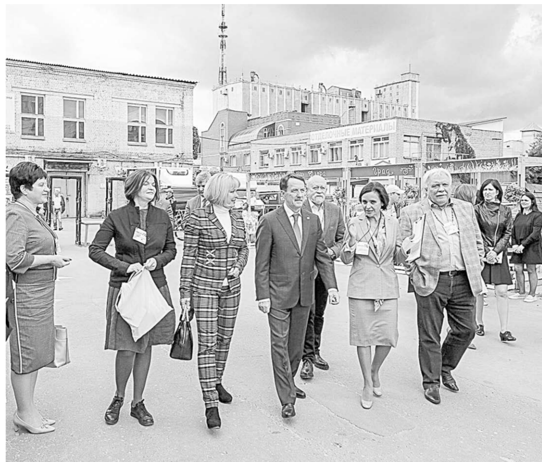
Губернатор Алексей Гордеев посетил форум «Зодчество VRN».

располагается на третьем этаже бывшего ликеро-водочного завода. Сотрудники центра готовят проекты планировки территории для размещения объектов регионального значения, актуализируют схему территориального планирования Воронежской области, создают