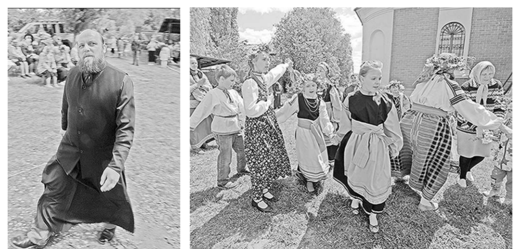
День Святой Троицы в посёлке Латная прихожане отметили широкими народными гуляньями и открытием школы звонарей.

В праздничное воскресенье на территории Троицкого храма в посёлке Латная Семилукского района собрались сотни прихожан. Здесь по завершении торжественной службы дали старт широким народным гуляньям. А кульминацией праздника стало открытие первой в районе школы звонарского мастерства.