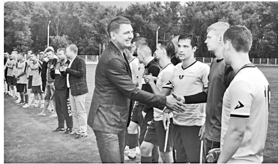
Участников состязаний приветствовал депутат Государственной Думы РФ Андрей Марков.

Спорт | В Воронежской области прошёл турнир по футболу между сборной «Российского футбольного союза глухих» и командами четырёх муниципальных районов