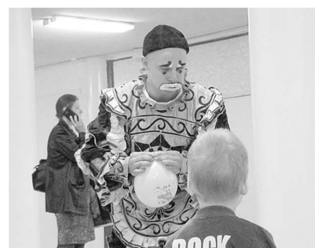
Представление началось уже в фойе цирка.