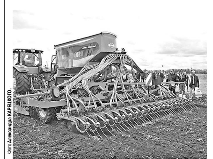
Демонстрация нового посевного комплекса минимального цикла почвообработки KUHN ESPRO 6000 RC.

Впервые российские аграрии смогли познакомиться и с новым посевным комплексом минимального цикла почвообработки KUHN ESPRO 6000 RC, позволяющим высевать зерновые с одновременным внесением удобрений.