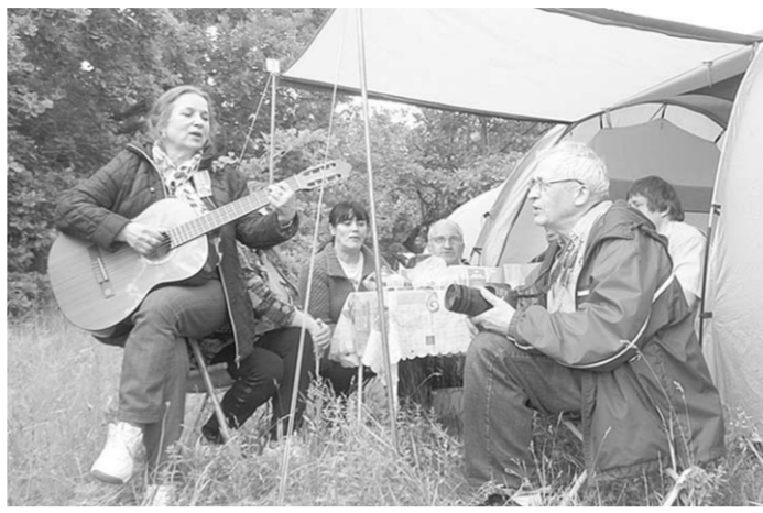
Вот уже 22 года подряд под большим и уютным «Парусом надежды» вместе собираются верные друзья.