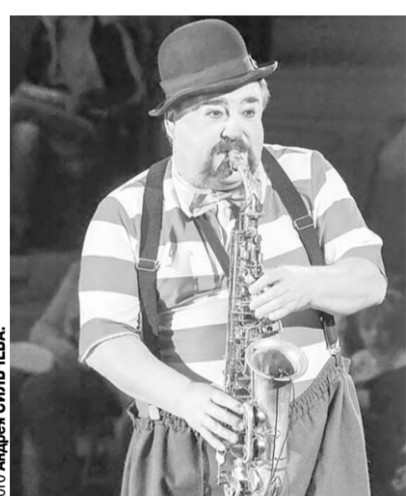
Заслуженный артист РФ Сергей Просвирнин.

фойе. Всё было построено на этюдах, которые тут же возникали (проявлялись) в общении будущих артистов с пришедшей публикой. И при этом ребята не произносили ни слова. В ход же были пущены пластика тела, мимика, язык жестов. И зритель, настроенный на позитив, принявший такую игру, уже вдохновленный шел в зрительный зал.