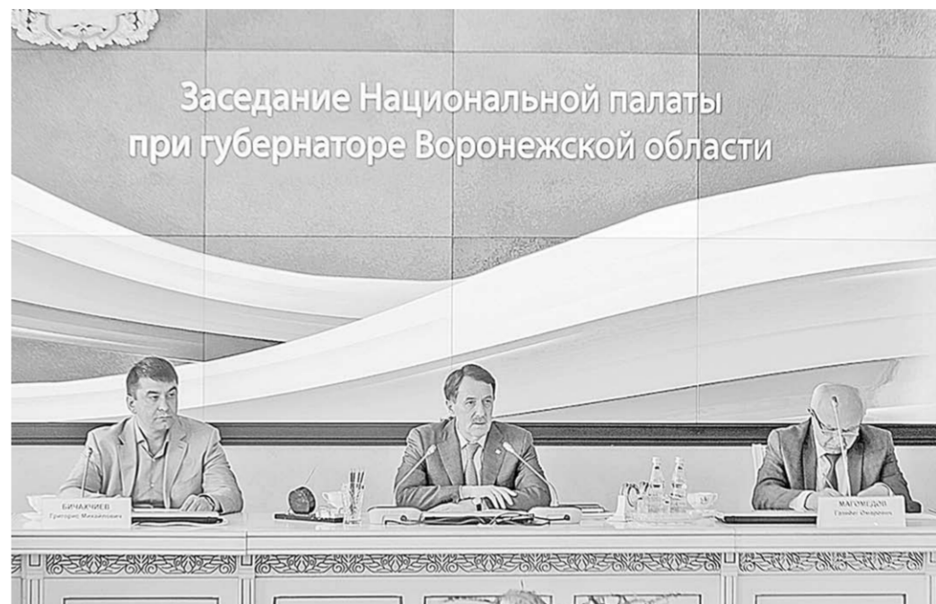
Губернатор Алексей Гордеев отметил, что сейчас в области разрабатывается программа по реализации государственной национальной политики, и к её созданию, помимо различных ведомств, важно привлечь Национальную палату региона.

Губернатор Алексей Гордеев отметил, что сейчас в области разрабатывается программа по