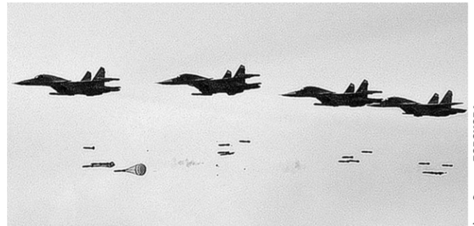
В воронежском небе – лётчики-асы России.

Сотни воронежцев 17 июня присутствовали на проведении Всероссийского этапа конкурса по воздушной выучке лётных экипажей ВС РФ «Авиадартс-2017».