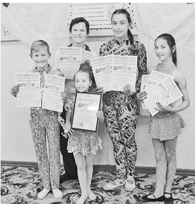
Победители конкурса «Цветы России».

Народная цирковая студия «Пластилин» из районного центра Ольховатка заняла первое место в открытом Российском фестивале-конкурсе любительского циркового искусства «Цветы России. Белые Ночи».