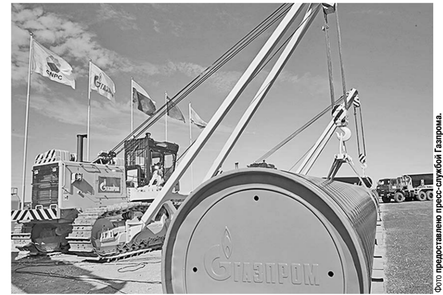
Новые технологии на службе Газпрома.

В области электроэнергетики Газпром проводит планомерное обновление генерирующих мощностей. Со времени вхождения Группы в электроэнергетический сектор в 2007 году по настоящий момент в рамках договоров о предоставлении мощности (ДПМ) Группой введено более 8,5 ГВт новой генерации. Из них в 2016 году было