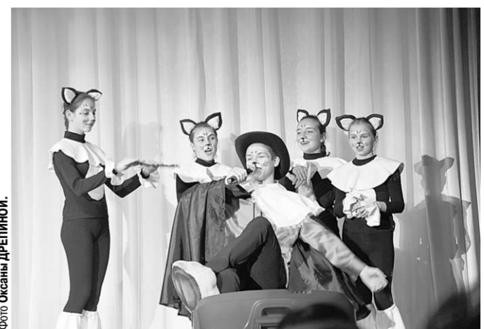
Сценка из мюзикла.