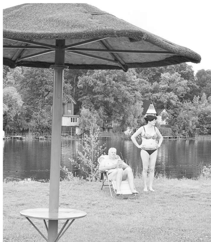
«Путь к себе» привлекает многих.

первом месте, конечно же, природы: вода и воздух. Вообще хотелось бы, чтобы хозьяева пляжа постепенно улучшали состояние общественных объектов. В разгар сезона не хватает на всех туалетов. Очень бы хотелось, чтобы был душ, в котором можно ополоснуться после купания в реке.