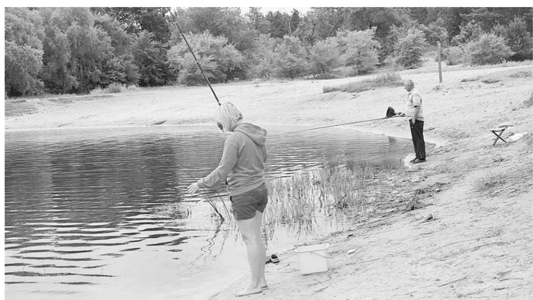
На пляже в Боровом не только купаются, но и ловят рыбу.

– Вода здесь такая чистая, что видно даже, как рыбки плавают, – делится впечатлениями Валентин, который сегодня пришёл вместе с внуком. – Хорошо, что проход бесплатный, надо только платить за проезд на автомобиле. Конечно, кафе и прочие услуги стоят денег, но мы всегда берём с собой всё необходимое. Из плюсов – можно снять домик в этом живописном месте. В этот день было немногочисленно, поэтому на пляже отдыхали около десяти человек. Но, как рассказал Валентин, когда бывает намного больше. Каждую минуту акваторию инспектирует лодка со спасателями. Из минусов, которые отметили отдыхающие, недостаточное количество кабинок для переодевания.