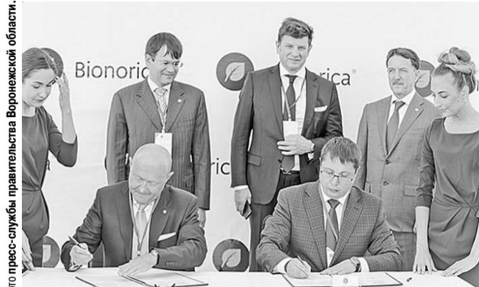
Соглашение о сотрудничестве подписали Воронежский государственный университет и компания «Бионорика СЕ».

После закладки капсулы в основание строительства фармацевтического завода здесь же в Индустриальном парке состоялось подписание Соглашения о сотрудничестве Воронежского государственного университета и компании «Бионорика СЕ». В рамках этого Соглашения планируется проведение совместных образовательных, научно-исследовательских и научно-технических проектов, конгрессов, симпозиумов, конференций, семинаров, разработка и осуществление совместных фундаментальных и прикладных исследований в научной, образовательной и инновационной сферах, а также студенческий обмен.