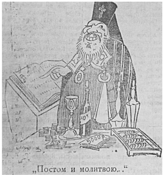
Карикатура из «Воронежской бедноты», 1918 год.