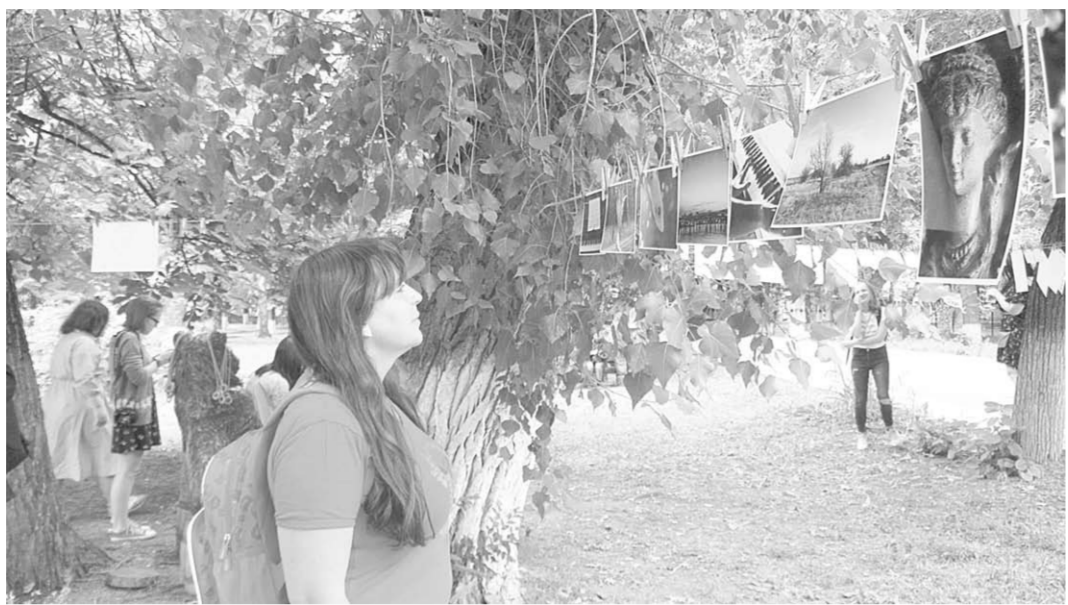
Каждый раз необычная фотовыставка собирает десятки воронежцев от мала до велика, увлечённых фотографией.

Портреты детей и взрослых, изображения всевозможных животных и предметов быта, природные пейзажи и достопримечательности многих городов России. Всё это и многое другое можно увидеть в одном месте столицы Черноземья в воскресенье. В сквере ДК железнодорожников между деревьями натянули белевые веревки. А на них прищепками прикрепили фотокарточки, на которых застыли яркие истории реальных людей. Здесь собрались профессиональные фотографы и любители, молодые люди и воронежцы в возрасте. Они пришли сюда, чтобы обменять мимолётные мгновения из своей жизни, запечатленное на фото, на не менее интересный снимок других людей.