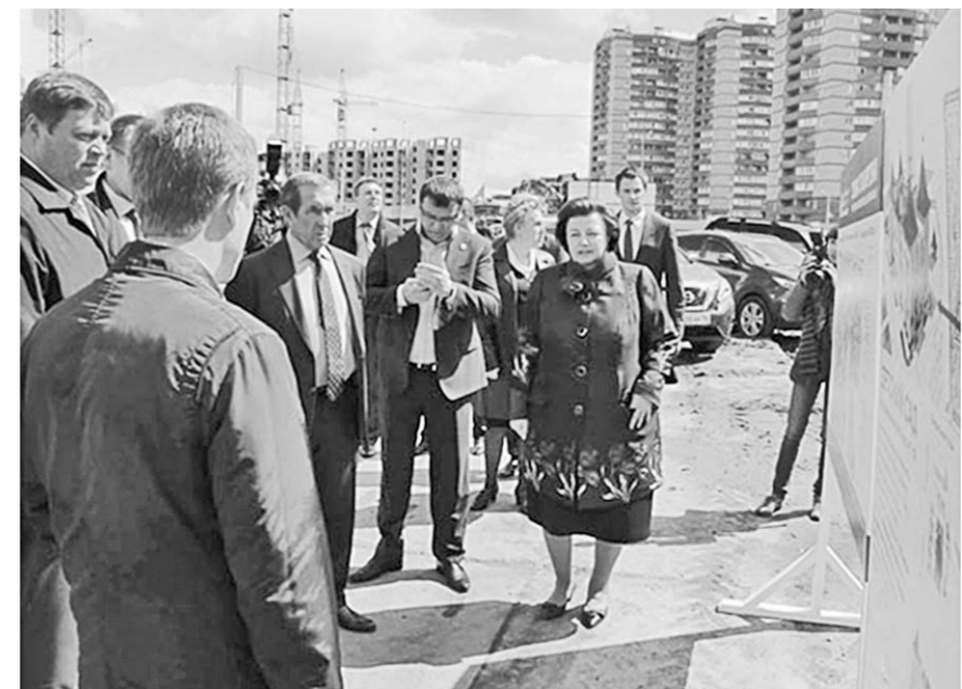
На выездном заседании профильных Комитетов в Шиловском районе рассмотрели, в том числе, вопрос строительства социальных объектов в микрорайоне.