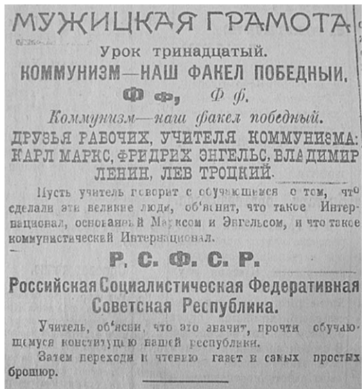
Рубрика в «Красной деревне» для читателей, овладевающих грамотой.

Привечала поэтов и «Воронежская беднота». 17 декабря в пятом номере сатирическое стихотворение «Поп» некоего Дяди Митяя (он и после пе-