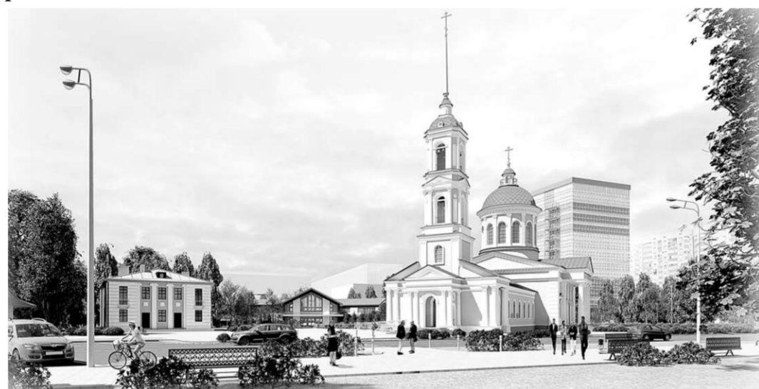
Эскизный проект реставрации храма Рождества Христова на Придаче.