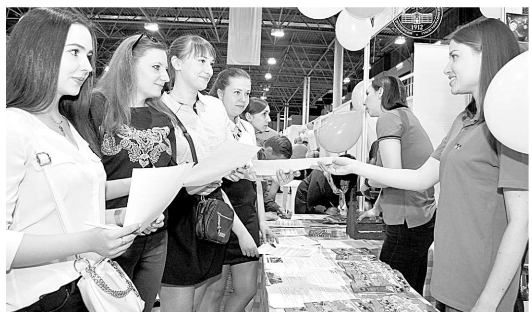
На практику – с удовольствием!

Молодые люди, задумываясь о своей будущей сфере деятельности, хотят, чтобы она отвечала следующим условиям: была престижной и востребованной на рынке труда, нравилась и соответствовала способностям, хорошо оплачивалась и давала карьерный рост.