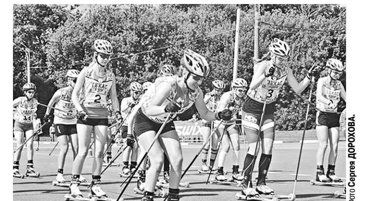
Несколько часов набережная Массалитникова была заполнена сотнями роллеристов из разных регионов России.

В столице Черноземья на набережной Массалитникова 15 июля прошёл масс-старт участников чемпионата и первенства России по лыжероллерам.