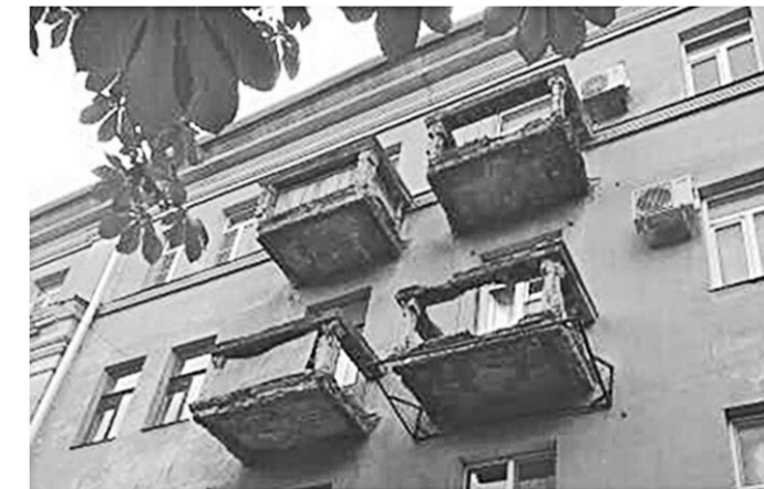
Аварийные балконы – опасность для горожан.

Всего в областном центре выявлено 28 аварийных балконов. Самую большую опасность для прохожих, по мнению активистов общественного движения «Гражданский патруль», представляют дома по улице Студенческой, 33, а также несколько зданий на улице Фридриха Энгельса.