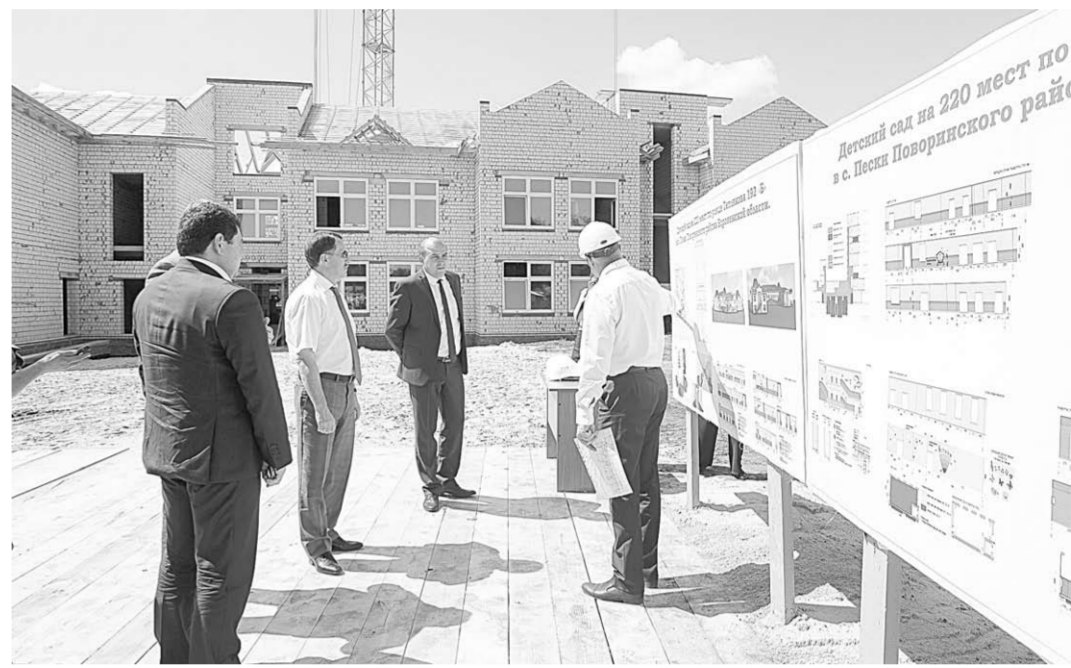
Алексей Гордеев проинспектировал ход строительства детского сада в Песках.

Также глава региона осмотрел многоквартирный жилой дом, построенный для расселения граждан из аварийного и ветхого жилья. Он возведён в рамках реализации муниципальной адресной программы по переселению граждан, проживающих на территории городского поселения Поворинского района в аварийном жилищном фонде в 2013–2017 годах с долевым участием в строительстве. Пятиэтажный жилой дом общей площадью