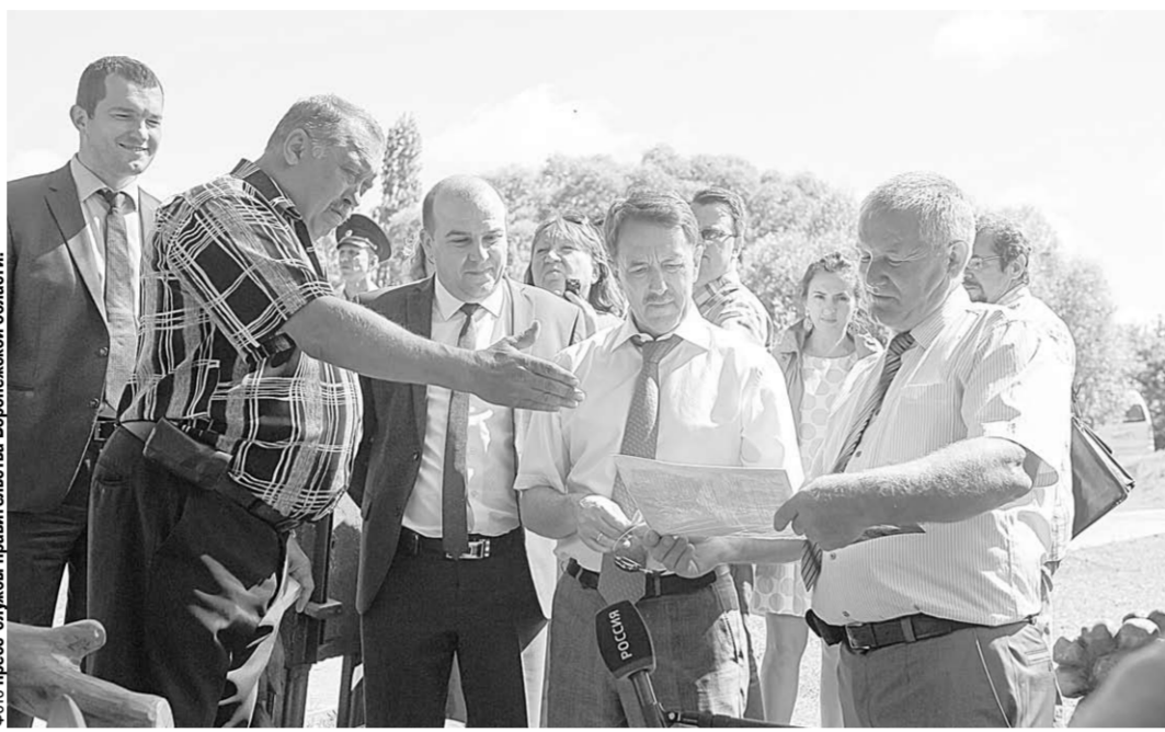
Родник в селе Октябрьское благоустроили силами ТОСа за счёт областного гранта.

Власть | В ходе поездки в отдалённый Поворинский район губернатор Алексей Гордеев поддержал усилия нового главы администрации «работать по-современному» и раскритиковал группу «антинародных» бизнесменов