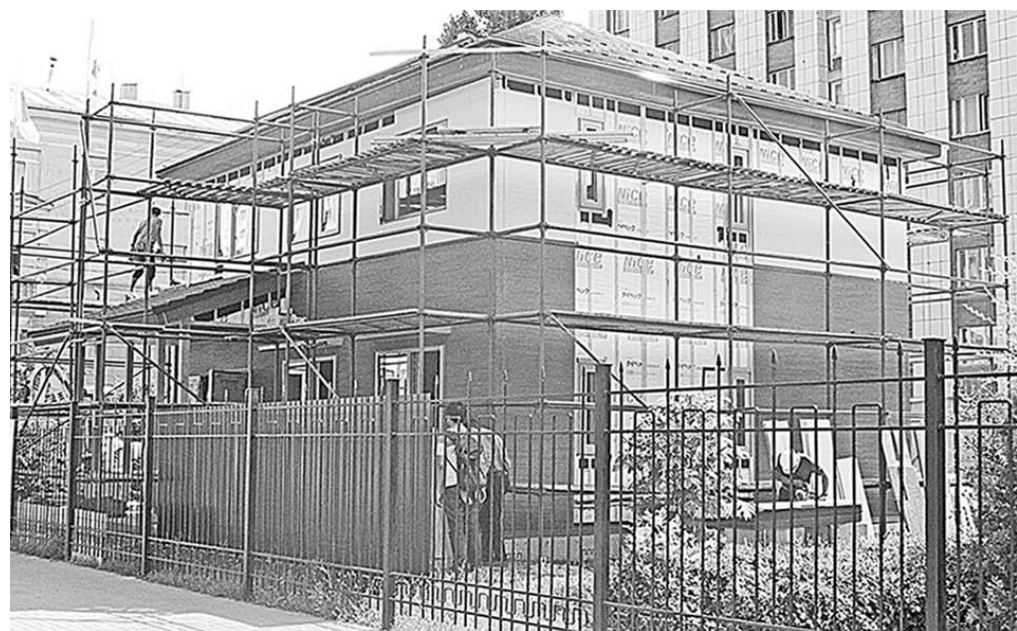
Дом назвали «умным» потому, что при его строительстве используются высокотехнологичные материалы, а вовсе не из-за того, что он будет напичкан электронными гаджетами, как думают многие.

Время перемен | В столице Черноземья полным ходом идут отделочные работы в доме, возводимом в рамках российско-японского сотрудничества