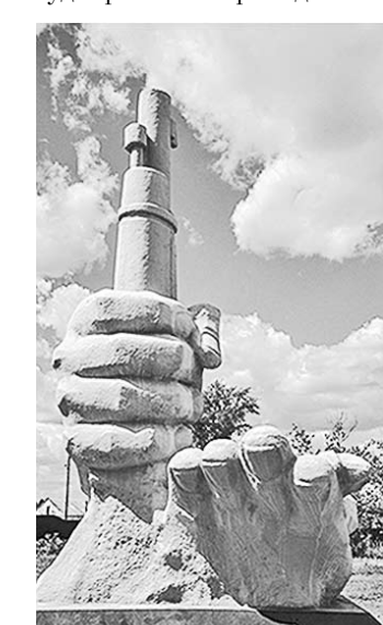
Памятник «Семь коммунаров» станет частью обновленного сквера.

Внутри вдоль дорожек появятся липы, можжевельник, плакучие ивы. Там же будут установлены скамейки и скамейки. Реализация проекта рассчитана на два года. Будущей весной тосовцам предстоит заасфальтировать дорожки для катания на роликах и велосипедов.