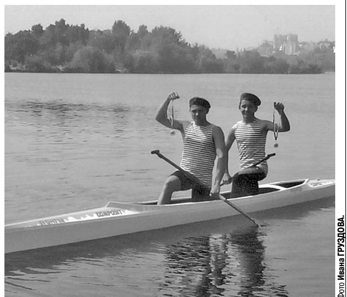
Заслуженные награды – гордость Горожанского казачьего кадетского корпуса.

– Призываю вас, дорогие друзья, принять деятельное участие в воспитании нашей молодежи! Чаще общайтесь с представителями юного поколения России с тем, чтобы донести до них информацию о сегодняшнем положении дел в стране, знакомить с её историей, рассказывать о её героях. Вышших офицеров не бывает! Передавайте свой богатый жизненный опыт, поддерживайте у молодых дух патриотизма, формируйте правильный взгляд на мир и на своё место в нём.