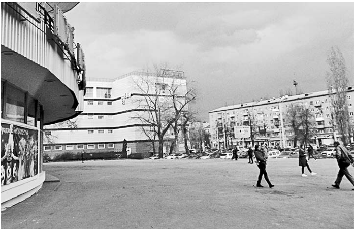
Апрель 2017-го. Спустя тридцать лет ничто не напоминает о событиях, случившихся возле цирка.

в которых носили очевидные признаки «самых кошмарных образов сталинской критики советского искусства», но в «Коммуне» данная тема, по сути, проигнорирована (возможно, как не подходящая «по формату»). Едва ли не единственные слабые отголоски её – пара статей о необходимости посылить качество репертуара ВИА и играющих в ресторанах оркестров («в вальмах нападками на Вoney М).