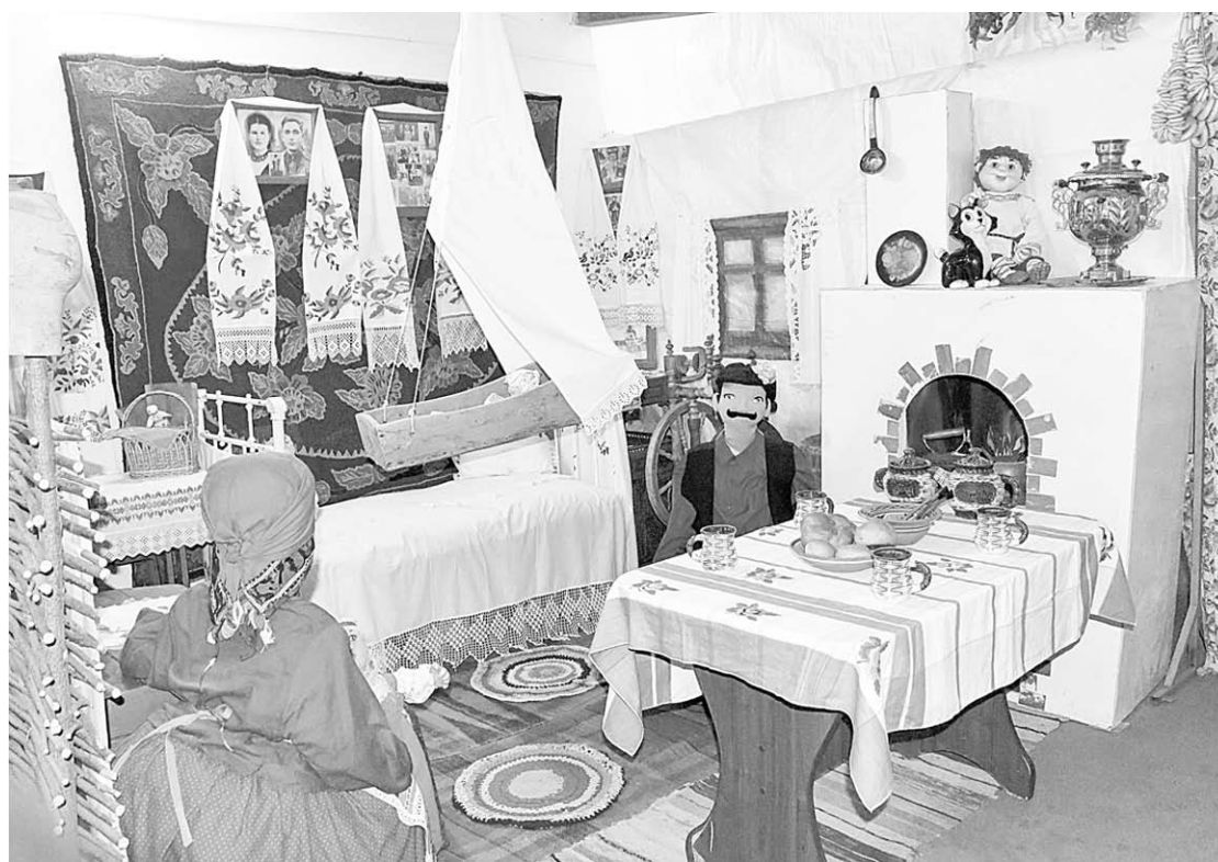
Мини-музей крестьянского быта в селе Усть-Муравлянка.

За оказанием помощи обратились в медучреждение с травмами различной степени водители автомобилей, а также чет-