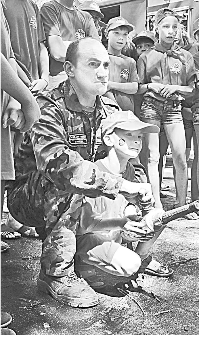
Дети ощутили себя настоящими пожарными.

Этот гостевой десант в лесной лискинский лагерь «Ракета» категорически отличался от многих предыдущих. Приехали к юным «ракетчикам» не просто люди мужественных профессий, а ещё и умеющие доверительно общаться и находить общий язык с детворой.