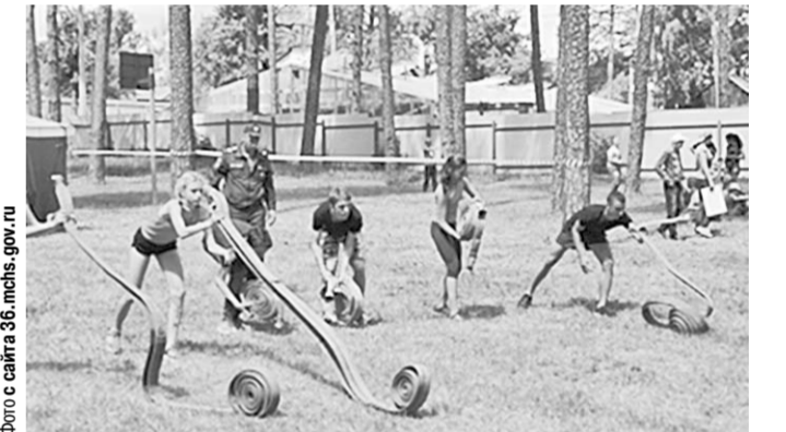
Во время состязаний.

Первую серию межлагерных соревнований спасатели провели на базе детского оздоровительного лагеря «Костер» 19 июля. Тогда в пожарно-спасательных состязаниях приняли участие семь юношеских команд из шести детских лагерей Воронежа. Еще более 200 юных воронежцев активно соперничали за свои лагерные команды. Вторую серию межлагерных соревнований спасатели провели ровно спустя месяц, уже во второй лагерной смене, на базе детского оздоровительного лагеря «Полёт». И тут спасателей ждал приятный сюрприз. Спустя неделю в адрес Главного управления МЧС России по Воронежской области поступил цифровой подарок от детей «Полёта». Это был видеоклип, смонтированный из сюжетов проводимых спасателями соревнований. Теперь спасатели проведут очередную, третью по счёту, серию соревнований.