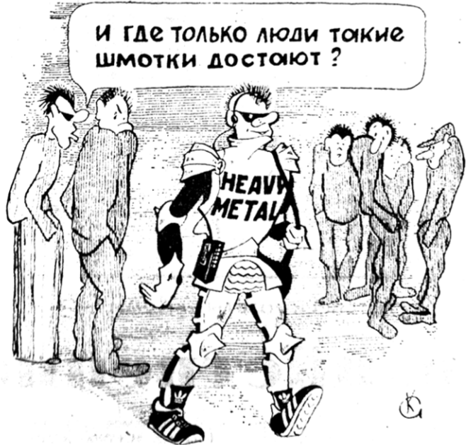
Такой карикатурой сопровождалась подборка откликов читателей «Коммуны» на статью «Около музыки...». №106, 7 мая 1987 года.

Листая подшивку «Коммуны» за 1987 год, мне так удалось отыскать ещё две статьи, подписанные В.Кленовским. Одна называется «На службе партии и народу» и посвящена «70-летию органов ВЧК – КГБ СССР». Вторая – «Рыцари революции».