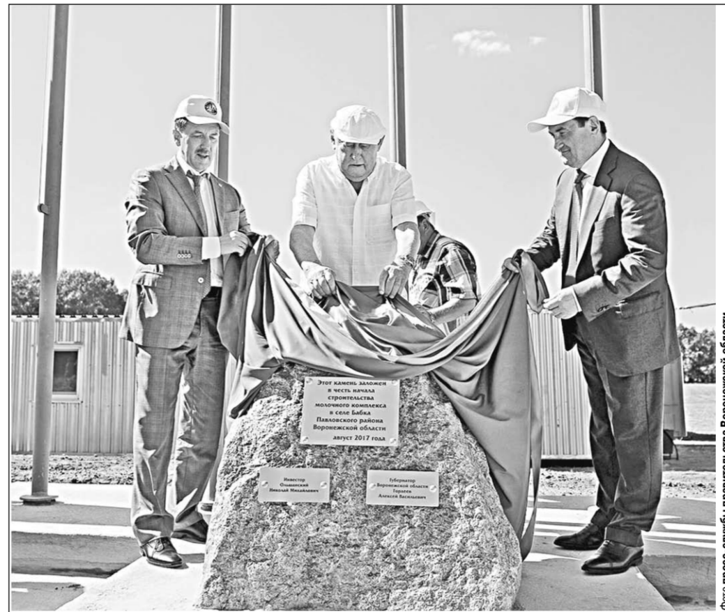
Здесь возведут современный молочный комплекс на 1200 голов дойного стада.

В свою очередь глава ГК «Автодор» Сергей Кельбах отметил, что компания уже работает над созданием дорог будущего, на дорогах Автодора уже есть пункты электростанции. Что касается вопроса развития парка беспилотных автомобилей, то Сергей Кельбах подчеркнул, что при их использовании пересечение с другими дорогами должны быть исключены.