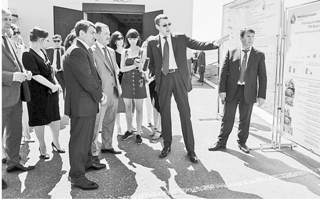
Алексей Гордееву и Игорю Левитину рассказали о водоподъемной станции, обеспечивающей два района Воронежа.

ЖКХ | Губернатор Воронежской области Алексей Гордеев уверен в том, что систему жилищно-коммунального хозяйства необходимо модернизировать