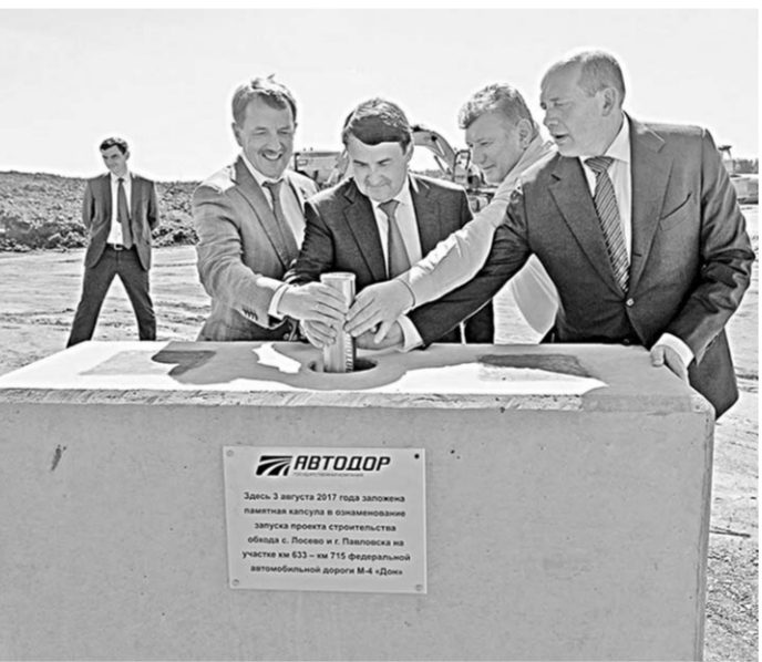
Строительству обхода Лосево и Павловска дали старт.

– Это знаковое и ожидаемое для нас событие – наконец-то начинается строительство обхода Лосево и Павловска... Просьба только одна – строить быстрее, чтобы не в 2020-м, а в 2019 году мы могли перерезать ленточку и порадоваться этому событию.