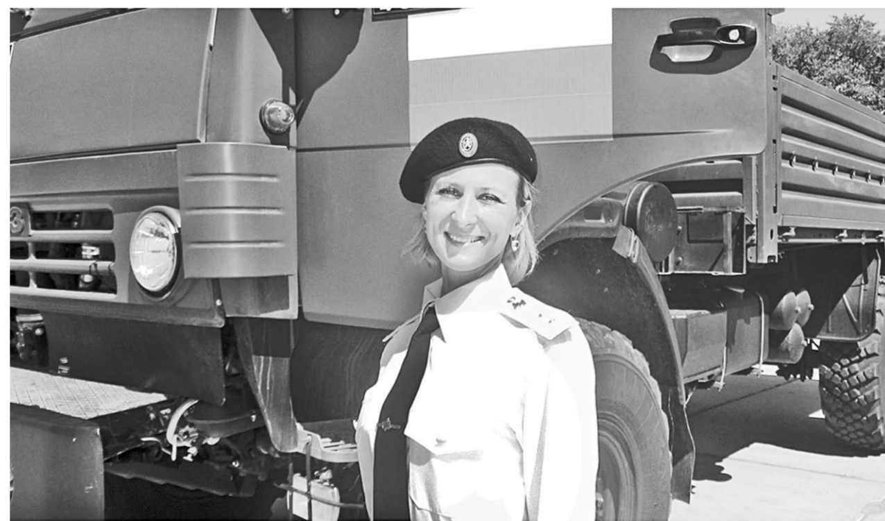
Красочным открытием, зрелищными гонками и автомобильным вальсом с участием женщин-водителей запомнилась зрителям первый день соревнований.

Рёв мотора, высокая скорость, скрип резины и резкие повороты – на протяжении нескольких часов участники индивидуальной гонки, командной эстафеты и конкурса капитанов соревновались на скорость и манёвренность и радовали зрителей высшим пилотажем. Особенно зрелищно смотрелось преодоление КамАЗами на время полосы препятствий. Водители тяжёловесных