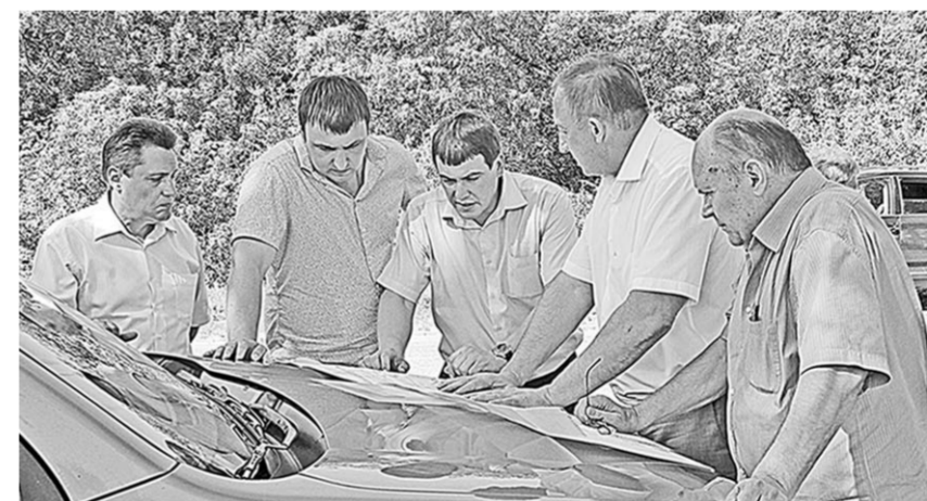
В ходе рейда по дорогам региона руководителям отрасли не раз приходилось склоняться над схемами, сверяя увиденное с тем, что было запланировано.

В итоговую проверочную поездку будут приглашены и участники общественных движений. Уже нарабатана такая практика взаимодействия с представителями общероссийского народного фронта «За Россию» и межрегиональной общественной организации «Женское движение».