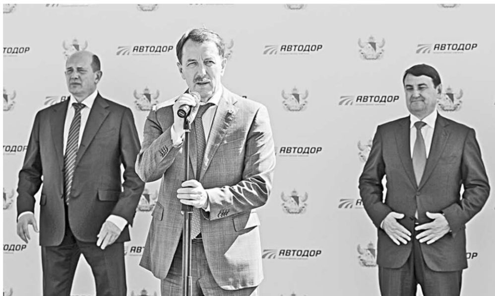
Глава области Алексей Гордеев уверен, что все работы будут выполнены очень качественно.

На территории, где появится современное сельхозпредприятие, в настоящее время ведутся только подготовительные работы. Зато специалисты ООО «Транстроймеханизация», входящего в группу компаний «Мостотрест», уже приступили к строительству нового платного участка трассы М-4 «Дон» в обход села Лосево и города Павловска. Дорога через Лосево – самый загруженный и проблем-