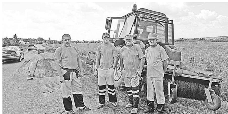
Вот они, незаметные труженики дорог, чьим трудом год от года магистрали и обычные сельские трассы региона становятся качественными и благоустроенными.

Но, отмечая положительные моменты организации работ, участники поездки особое внимание обращали на проблемы. Одна из болевых точек на карте региона связана со строительством же-