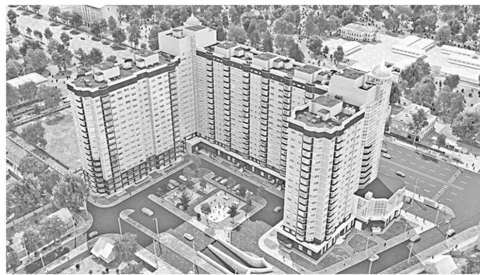
ЖК «Солнечный» стал украшением проспекта Труда.