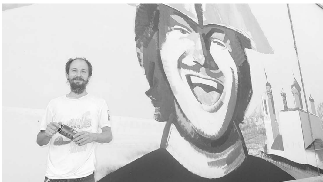
Проект «Стрит-арт» доказывает, что уличное граффити может не марать, а преобразять невзрачные стены городских зданий.

Уже сейчас многие мастера наносят последние мазки в свои композиции, преобразяя до неузнаваемости давно знакомые пейзажи. Так, стена пожарной части у останков «Работница» предстаёт перед нами полотном, на котором окутанные огнём пожарные спасают перекутанного малыша... Зрелищную композицию сменил вид на Адмиралтейскую площадь. В нём преобладают зелёные и голубые краски. Спокойные лазурные воды