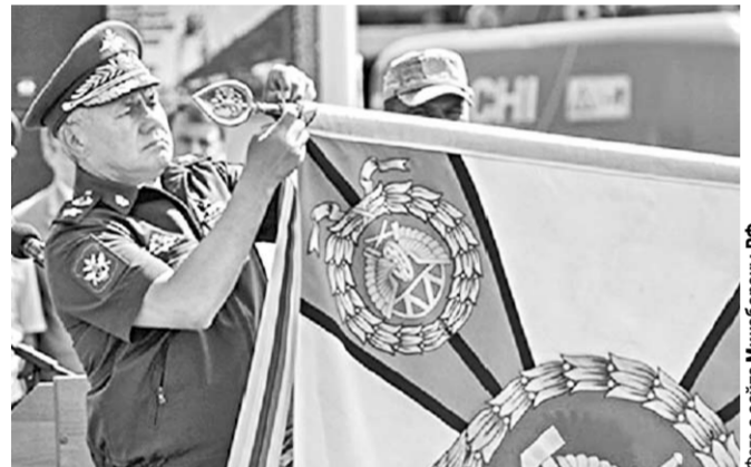
Министр обороны РФ генерал армии Сергей Шойгу прикрепляет к знамени части орден Жукова.

Под барабанный бой генерал армии Сергей Шойгу прикрепил орден Жукова и ленту к Боевому знамени части и поздравил личный состав со 166-летием со дня образования железнодорожных войск. В ответ прозвучал девиз: «Никто лучше нас!»