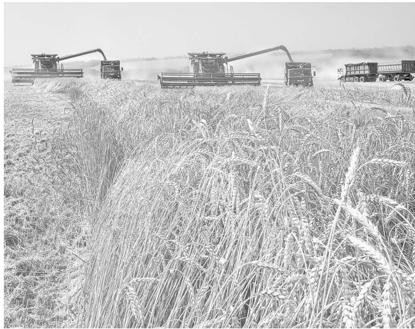
На бескрайних полях СХП «Новомарковское» — самая передовая техника, которая используется в Европе и России.

По словам сельского главы, ни одно культурно-массовое мероприятие без поддержки головного предприятия не обходится. Тут и ежемесячная оплата работы футбольного тренера местной команды, и выделение автобуса на выездные матчи, и реставрация памятника павшим героям в Новомарковке, и подарки вдовам и ветеранам Великой Отечественной войны.