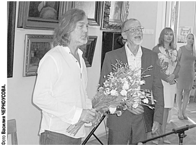
Перед открытием выставки Никас Софронов (слева) встретился с журналистами.

Среди тех, кто пришёл приветствовать гостя, был и первый заместитель председателя правительства Воронежской области Владимир Попов. Он выразил надежду на то, что пребывание в Воронежце подарит автору новые творческие идеи, которые будут воплощены в новых работах, и пожелал всем присутствующим массу приятных впечатлений от знакомства с работами этого автора.