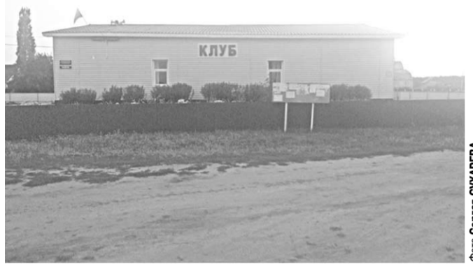
Клуб в селе Ольень-Колодезь — местный очаг досуга и культуры.