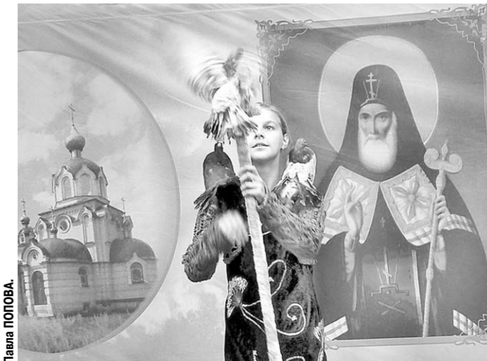
На сцене – дрессированные птицы.

У фестиваля нет богатых покровителей. Но обычные люди каждый год делают посильные пожертвования, помогая то новый храм достроить, то святой источник благоустроить. На очереди – школа. Значит, люди продолжают «строить храм в душе» – таков главный девиз фестиваля.