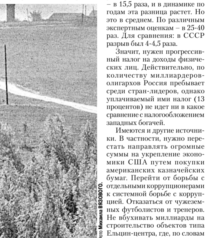
В каждую деревню, что позволяет не только создать там новые рабочие места, но и существенно повысить доходы населения, создать стимулы для благополучного проживания в деревне.

Существующая модель сельского развития, для чего необходимо обеспечить развитие института местно-