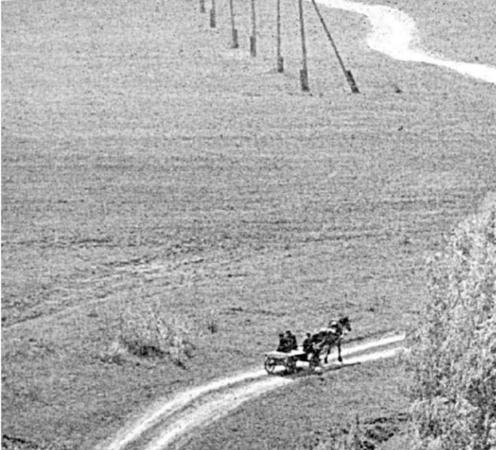
В каждую деревню, что позволяет не только создать там новые рабочие места, но и существенно повысить доходы населения, создать стимулы для благополучного проживания в деревне.

Из-за снижения поголовья животных в годы перехода к рыночной политике десятки тысяч рабочих мест, что не могло не вызвать отток рабочей