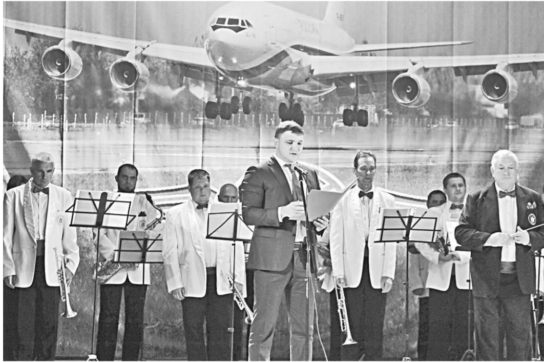
Заместитель председателя правительства Воронежской области Артём Верховцев читает приветственный адрес главы региона.