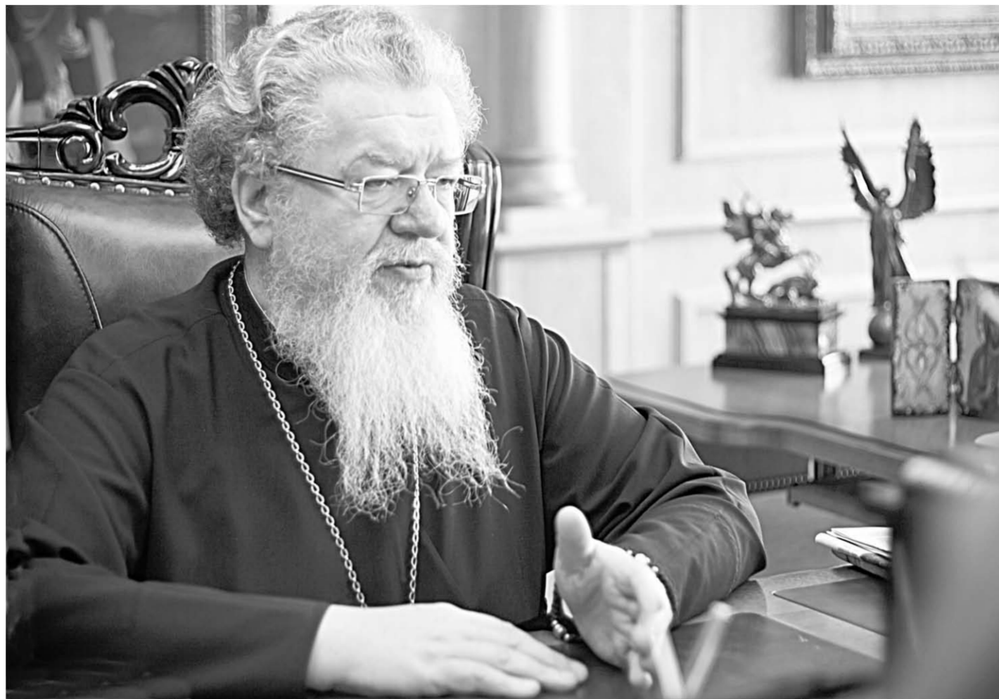
Митрополит Воронежский и Лискинский Сергей.

Отречение Императора Николая II от Российского престола, произошедшее 15 марта 1917 года, стало одним из ключевых событий Февральской революции и истории России XX века в целом. Несмотря на войну, оно стало праздником для большинства – этого давно желали. Царя никто не подержал. Даже Императорский Двор предал Царскую семью.