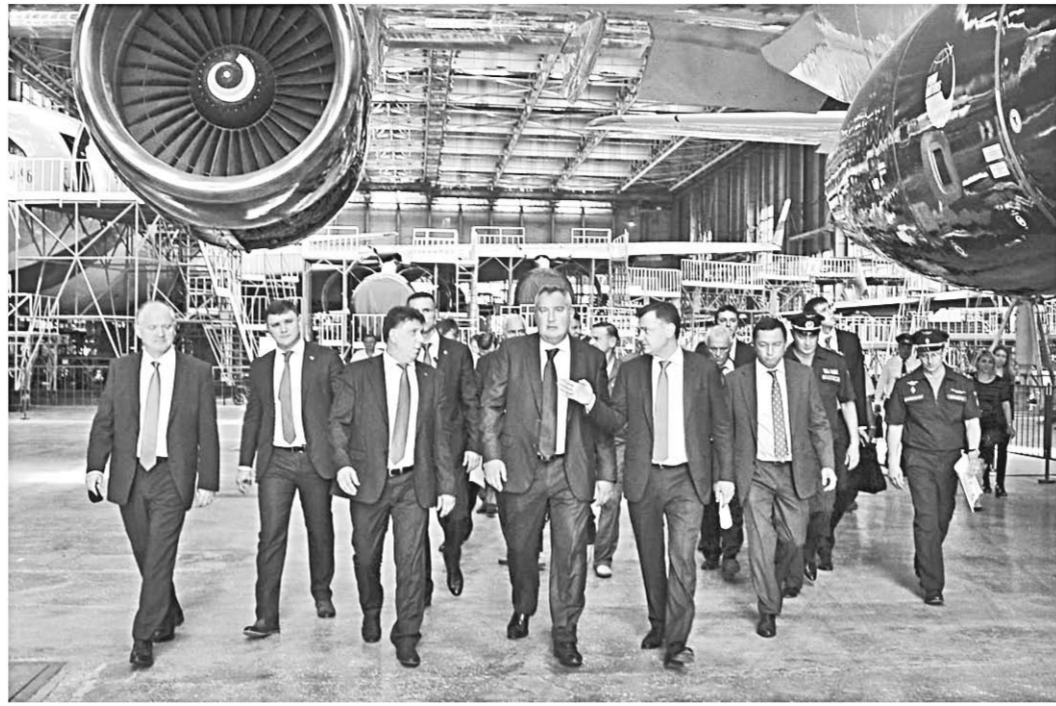
Дмитрий Рогозин посетил цех окончательной сборки.