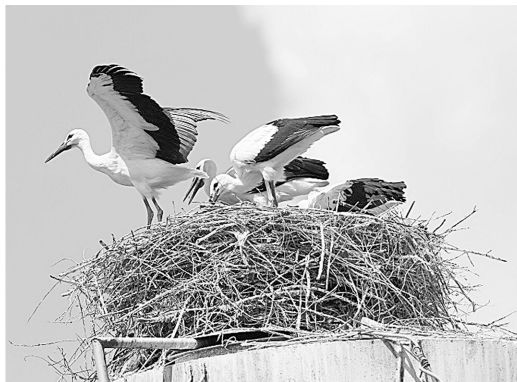
Детёныши белого аиста ждут своих родителей.

Мы и природа | Редкий белый аист живёт в охранной зоне Воронежского заповедника на территории Липецкой области в селе Никольские Выселки