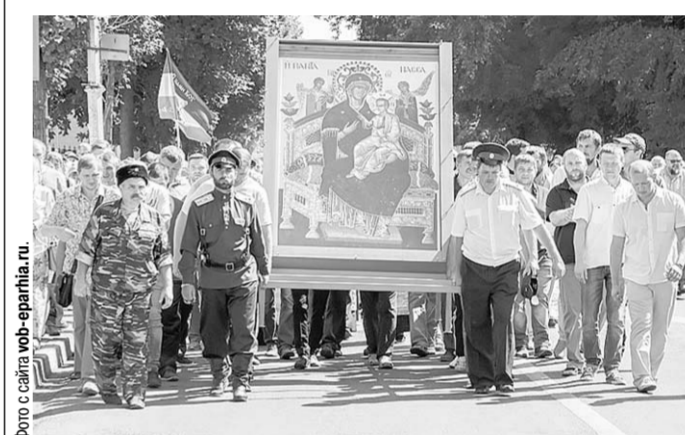
Крестный ход в пути к Задонску.

В этом году с крестным ходом совершилось перенесение чтимой иконы Божией Матери «Всецарица», написанной на Святой Горе Афон, из Благовещенского кафедрального собора в воронежский храм на улице Шникова, который будет освящен в честь этого образа Пресвятой Богородицы. В связи с этим обычный путь крестного хода был изменён — первая остановка была сделана в храме в честь иконы Божией Матери «Всецарица». Образ Пресвятой Богородицы священико-служителями внесли в храм, где отныне он будет иметь постоянное пребывание. После молебна, небольшой трапезы и краткого отдыха крестоходцы вновь взяли хоругви и иконы Воронежских святителей и продолжили путь, который благополучно завершился в Задонске, информирует сайт Воронежской митрополии.