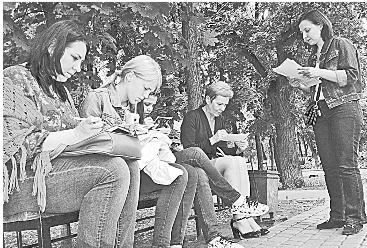
Английский на свежем воздухе объединил воронежцев разных профессий и возрастов.

Проводить занятия в парке «Орлёнок» организаторы планируют до наступления осенних холодов.