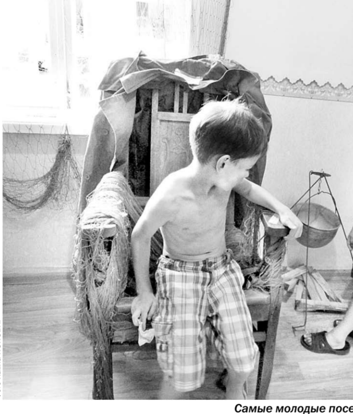
Самые молодые посетители музея у «кресла рыбака».

Таким образом, любимейшее многими поколениями место притягивает людей не веками, а тысячелетиями. Здесь нет привычных «огородных» соток возле домиков, зато есть большее богатство для его настоящих ценителей: чистейший воздух, прозрачные родники, «река-водохранилище», лодки, рыба. Отныне Рыбачий обещает стать и первым культурным центром в исторической дубраве.