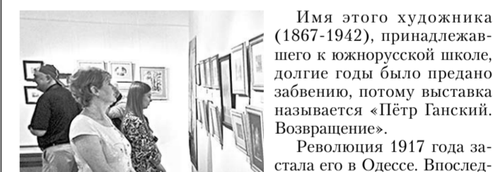
Первые посетители выставки.