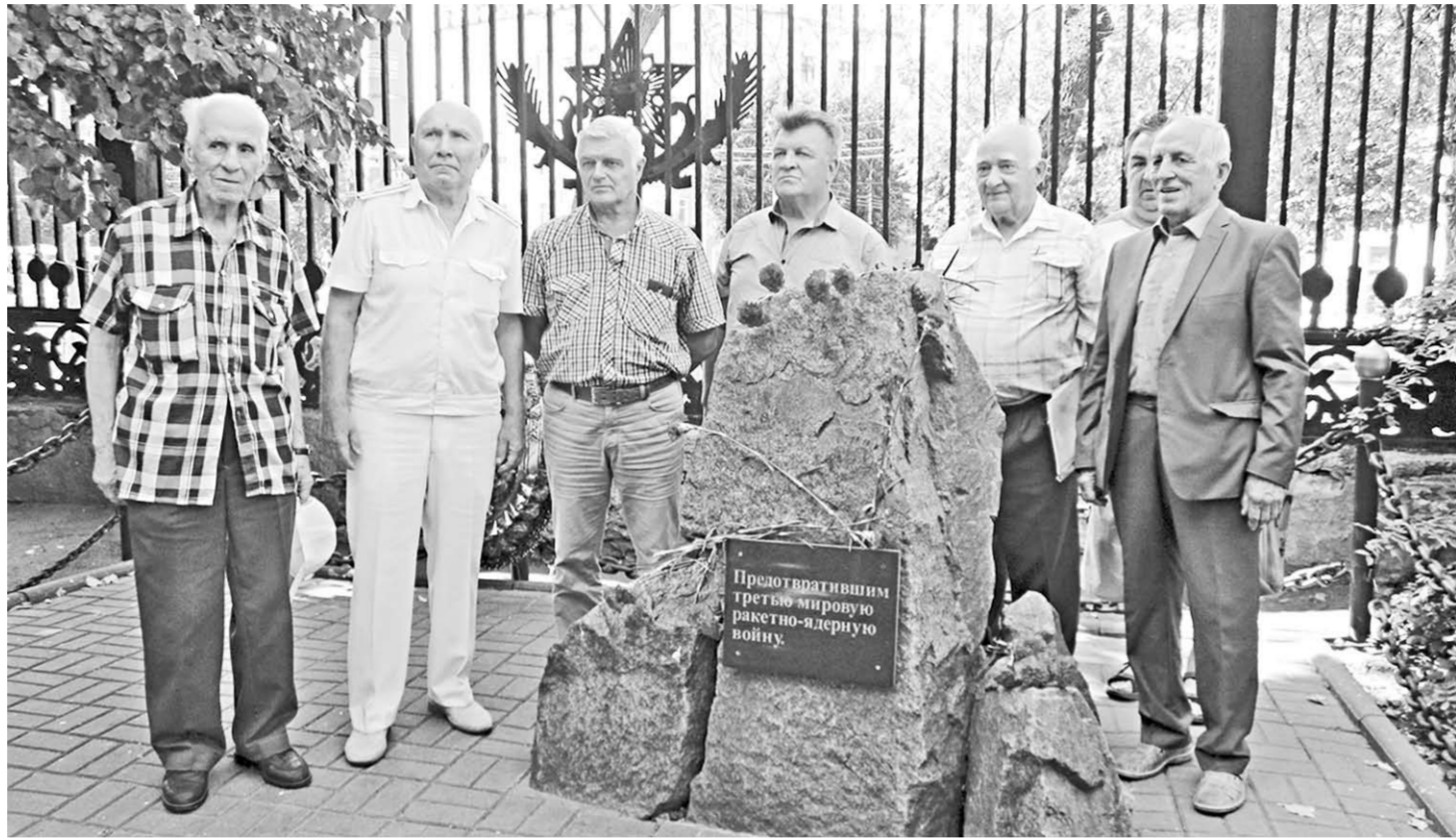
Участники конференции возложили цветы к памятному знаку «Предотвратившим третью мировую ракетно-ядерную войну» на территории Благоевещенского кафедрального собора.