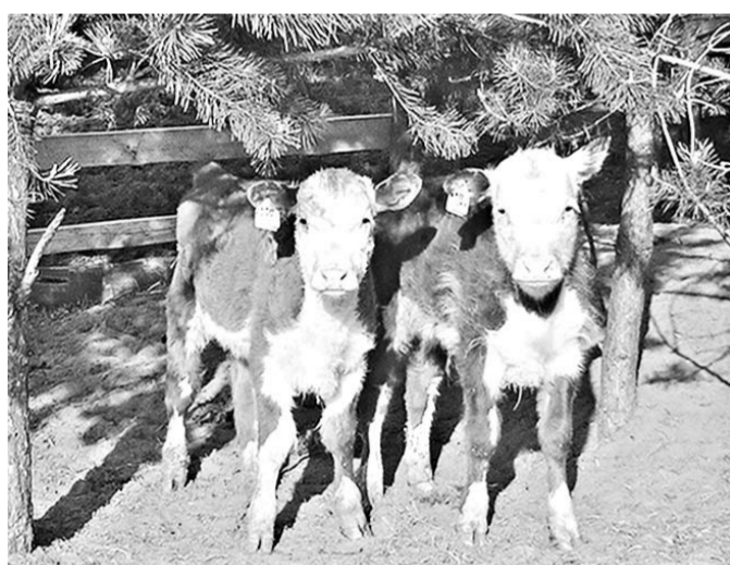
А третий теленок не захотел фотографироваться...