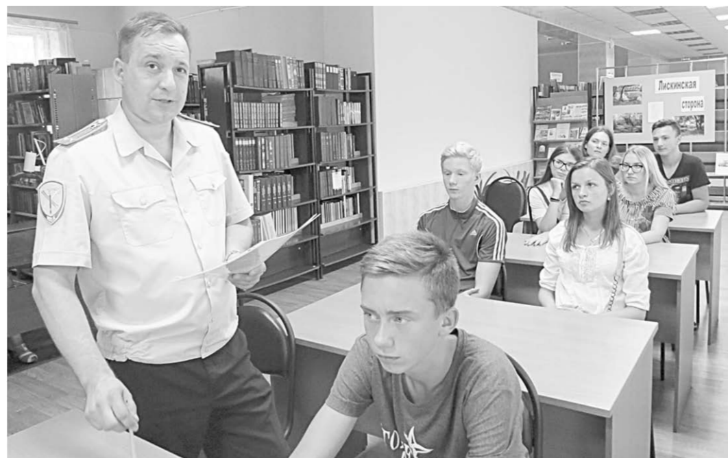
У молодых людей – вполне взрослые вопросы.