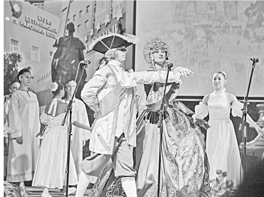
На сцене РДК «Октябрь» ожили картины истории Бутурлиновки.