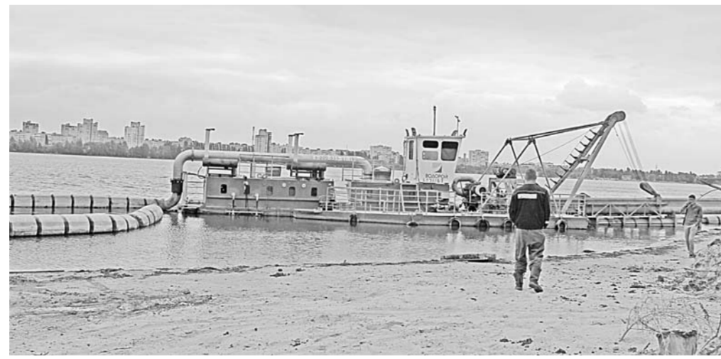
С помощью земснаряда поднимаются донные отложения.

Если воронежцы перестанут мыть в водохранилище автомобили, сбрасывать мусор и отходы и прекратят незаконно врезать канализационные трубы от своих домов в «ливнёвку», то через пять лет состояние воды улучшится без дополнительного вмешательства человека.