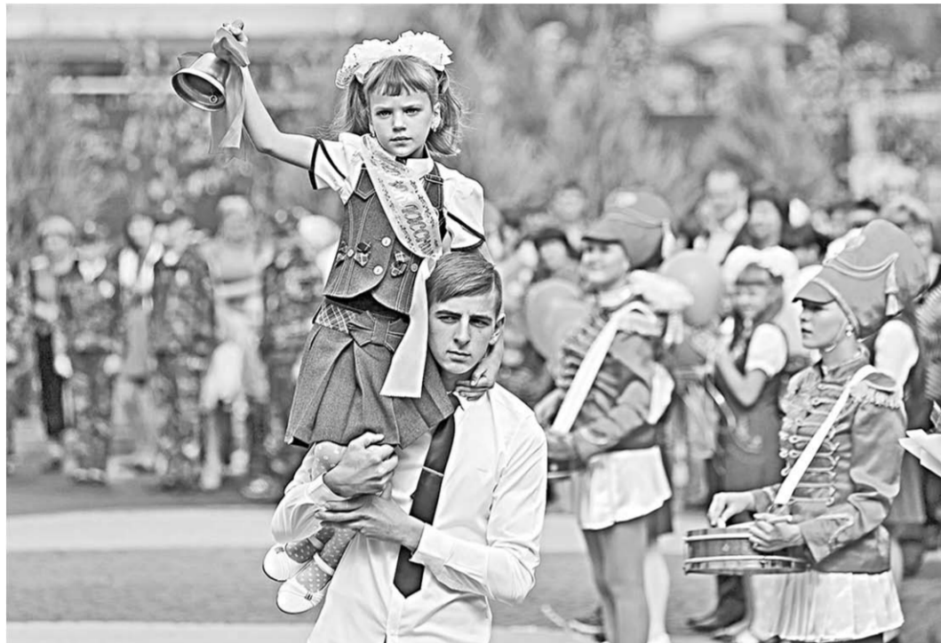
Первый звонок – всегда волнительное событие.

Власть | Эти слова произнёс губернатор Воронежской области Алексей Гордеев во время посещения Богучарского района