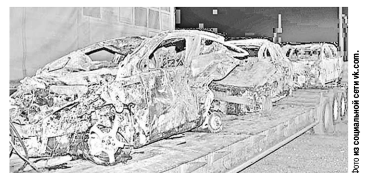
Некоторые автомобили, всплывшие после столкновения, превратились в груды искоржженного металла.

В Воронежской области полицией устанавливаются обстоятельства ДТП, которое произошло 3 сентября с участием более 30 автомобилей.