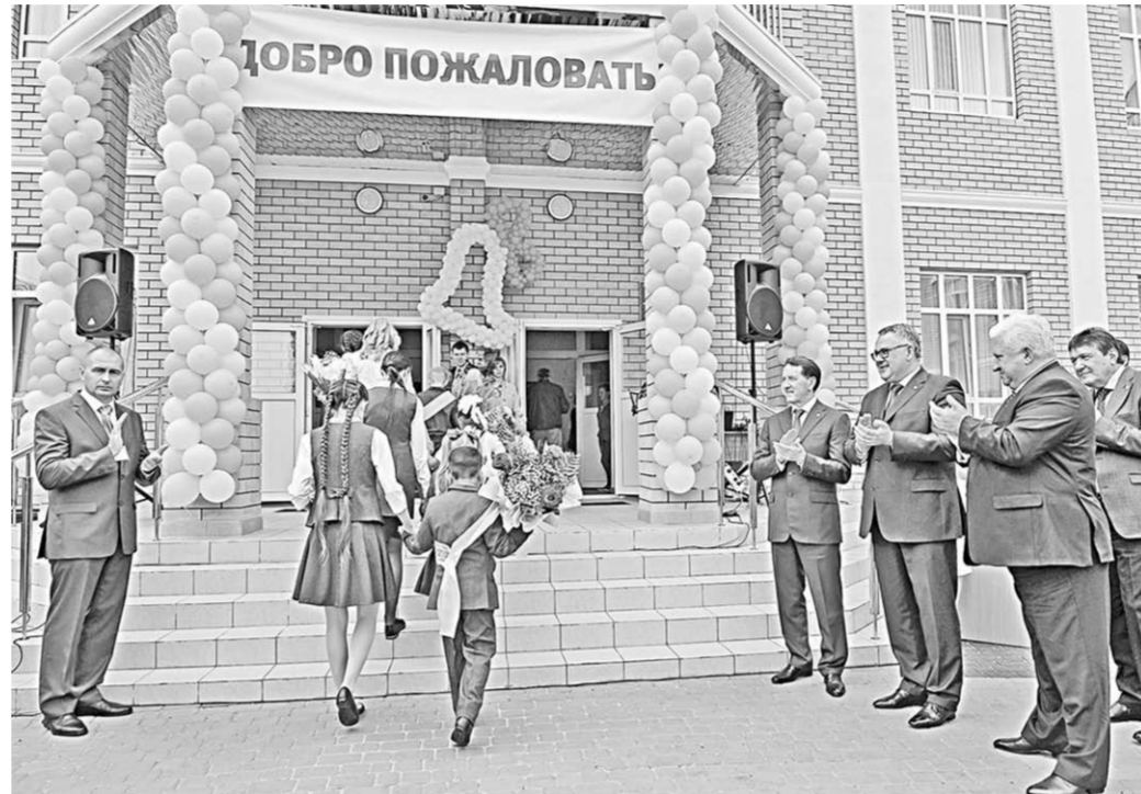
Новое здание школы распахнуло свои двери для ребят.

Глава региона принял участие в церемонии открытия новой школы в селе Радченское, ознакомился с тем, как благоустроивается село Данцевка и набережная в Богучаре, а также провёл встречу с руководством района.