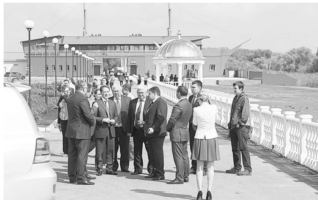
Реконструкция набережной в Богучаре идёт полным ходом.