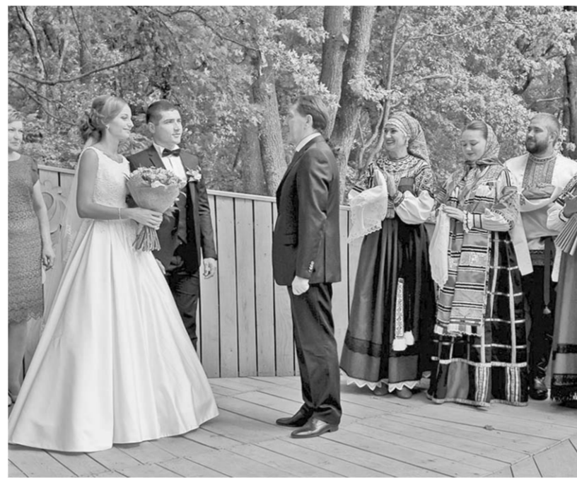
Молодёжкам губернатор пожелал счастья и добра.

— Я сегодня вспоминаю, когда восемь лет назад при-