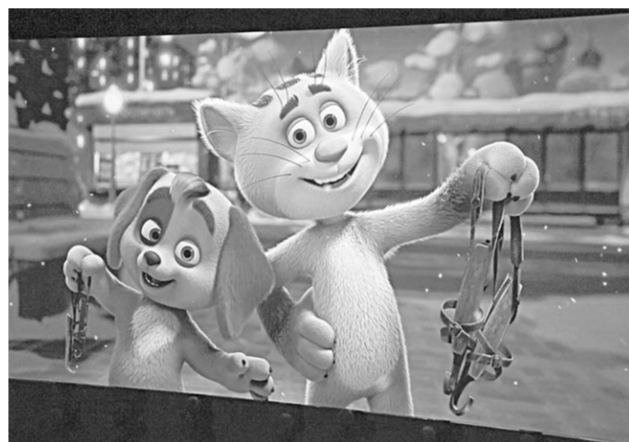
В жаркую Австралию кот Василий отправляется с другом – щенком Булькой.

Австралию, где познакомился с местными аборигенами – коалами, кенгуру, акулами и