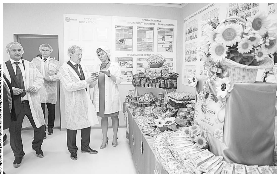
ООО «Агро-Спутник» осваивает кондитерское производство.