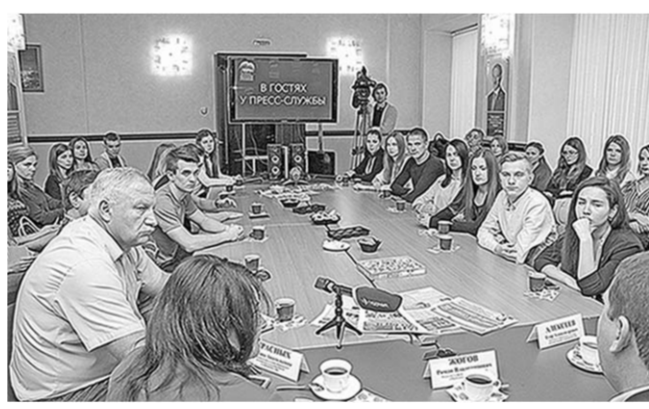
Разговор за «круглым столом» получился обстоятельным и деловым.