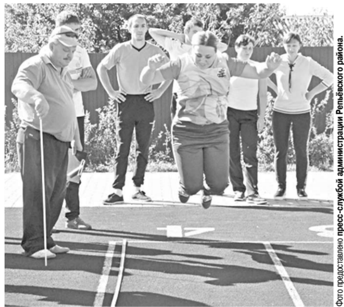
На стадион – за зарядом энергии!

Жители Репьёвского района отметили День физкультурника Воронежской области участием в массовых соревнованиях.