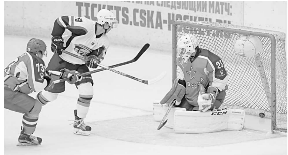
Трёх шайб, заброшенных «Бураном» в ворота подмосковной «Звезды», оказалось недостаточно для итоговой победы.

В первом матче на своём льду «Бурану» противостоял «Нефтяник» из Альметьевска. Затем 22, 24 и 26 сентября воронежцы поочередно встретятся с «Ижсталью» (Ижевск), «Молотом-Прикамье» (Пермь) и «Торосом» (Нефтекамск).