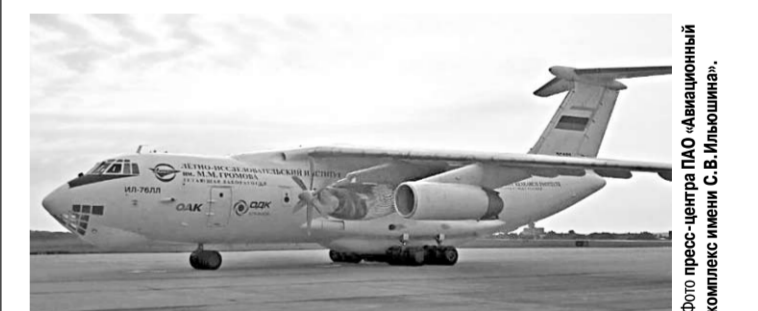
Вот такая она, воздушная лаборатория.

Первый вылет летающей лаборатории Ил-76Л с двигателем ТВ7-117СТ с винтом АВ-112 состоялся 12 сентября на территории ЛИИ имени М.М. Громова (г. Жуковский).