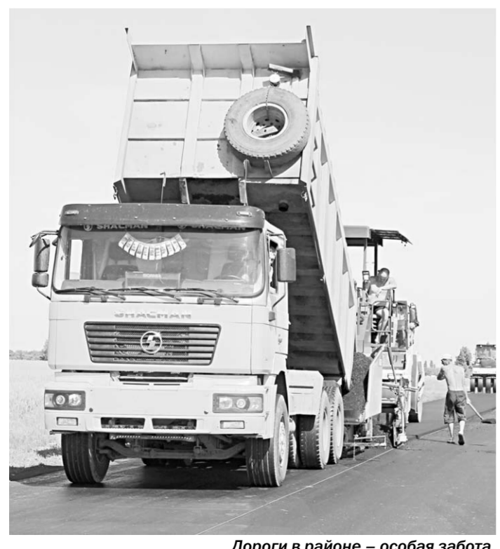
Дороги в районе – особая забота.

установить необходимое тренажёрное оборудование. Мы все – за здоровый образ жизни!