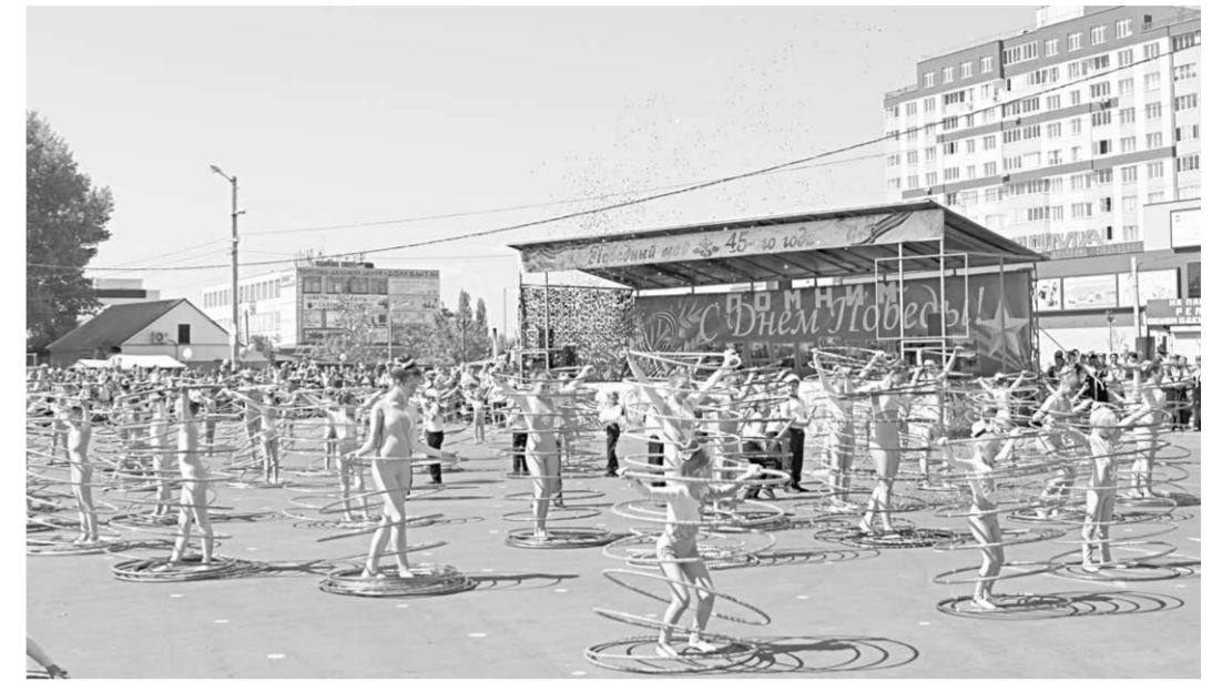
Выступление цирковой студии «Созвездие» на главной площади Новой Усмани.

установить необходимое тренажёрное оборудование. Мы все – за здоровый образ жизни!