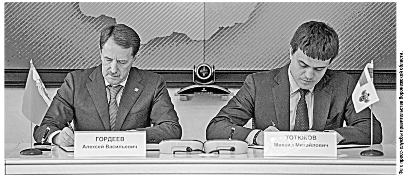
Воронежская область и Федеральное агентство научных организаций подписали Соглашение.

✓ Время пришло, и мы готовы к обсуждению того, как вновь собрать воедино научные силы и сделать так, чтобы наука приносила реальную помощь. Понимание такое есть на уровне как регионального правительства, так и аграрного бизнеса, — подчеркнул губернатор.