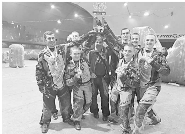
Верхнехавские пейнтболисты произвели настоящий фурор на престижном турнире в Москве.

Пейнтбол – это командная игра с применением пневматического оружия, стреляющего шариками с краской. Соревнования верхнехавских спортсменов были 23 команды не только из крупных городов России, но и из Финляндии, Эстонии, Белоруссии, Украины и Молдовы.