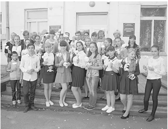
Участники акции «Белый цветок».

Участниками акции стали 12 образовательных учреждений, храмы Русской Православной Церкви и предприниматели. В Эртильском Доме детского творчества прошел мастер-класс по изготовлению поделок для данной акции. В течение недели волонтеры раздавали на улицах, в общественных местах, организациях, магазинах белые бумажные цветы. Всего в ходе акции «Белый цветок» в районе собрано 214 тысяч 35 рублей, которые пойдут на лечение тяжелобольных детей.