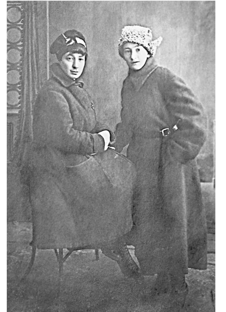
Студентки медицинского факультета ВГУ. 1920 год.

В Воронеже появилось много новых людей: профессоров, преподавателей, студентов. Студенты-юрьевцы