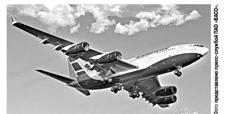
Ил-96-300 CU-T1250 совершает контрольный облёт.

Воронежский самолёт авиакомпании Cubana успешно завершил первый контрольный облёт.