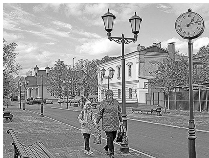
Радует глаз «Бобровский Арбат».

А совсем недавно зона туристического маршрута продолжилась ещё дальше. Часть улицы 22 Января преобразилась до неузнаваемости. Тротуары с обеих сторон существенно расширили и выложили брусчаткой. Вдоль улицы поставили парковые скамейки, вазоны для цветов, смонтировали необычные для нашего времени светильники XIX и часы у начала пешеходной зоны. Движение транспорта здесь ограничено, он может доставлять только продукты в магазины, расположенные на улице. Через несколько дней здесь высажат саженцы остролистного клёна, и тогда «Бобровский Арбат» станет для горожан местом отдыха и прогулок.