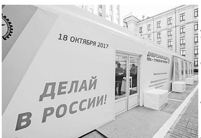
Ставка на отечественное производство – основной мотив выставки коммуникационных комплексов.

Организаторами конференции «Диверсификация оборонно-промышленного комплекса в сфере телекоммуникаций и связи – стратегия перемен»,