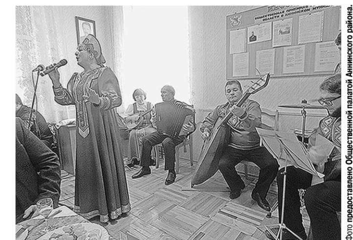
Для женщин звучали песни.

В Аннинском краеведческом музее отметили Международный день сельских женщин.