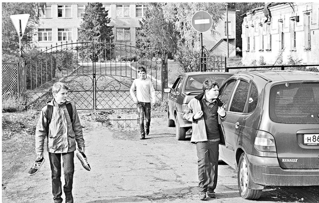
Вот уже месяц и утром, и днём территория возле Рождественской школы напоминает автостоянку. С ходу найти машину родителей ребят бывает непросто.