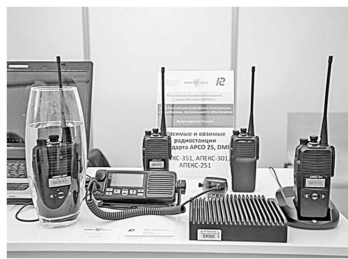
У российских производителей средств связи достаточно компетенций для выпуска конкурентоспособной продукции.

Участники конференции обсудили целый ряд вопросов, касающихся рынка продукции телекоммуникации и связи, мер господдержки диверсификации оборонно-промышленного комплекса, создания оптимальных ры-