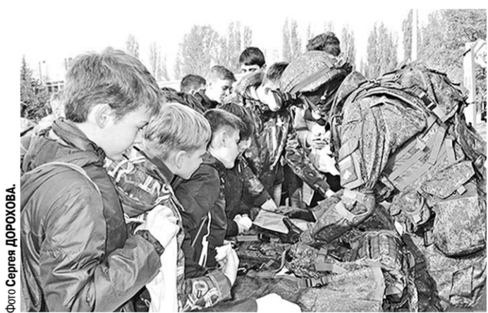
Школьники с интересом изучали военное снаряжение.

Традиционная военно-патриотическая акция собрала на территории пункта десятки молодых людей. Среди них можно было встретить не только призывников, но и школьников, учащихся техникумов Воронежа и области, которые в своё время тоже отправятся служить в Вооружённые силы России.