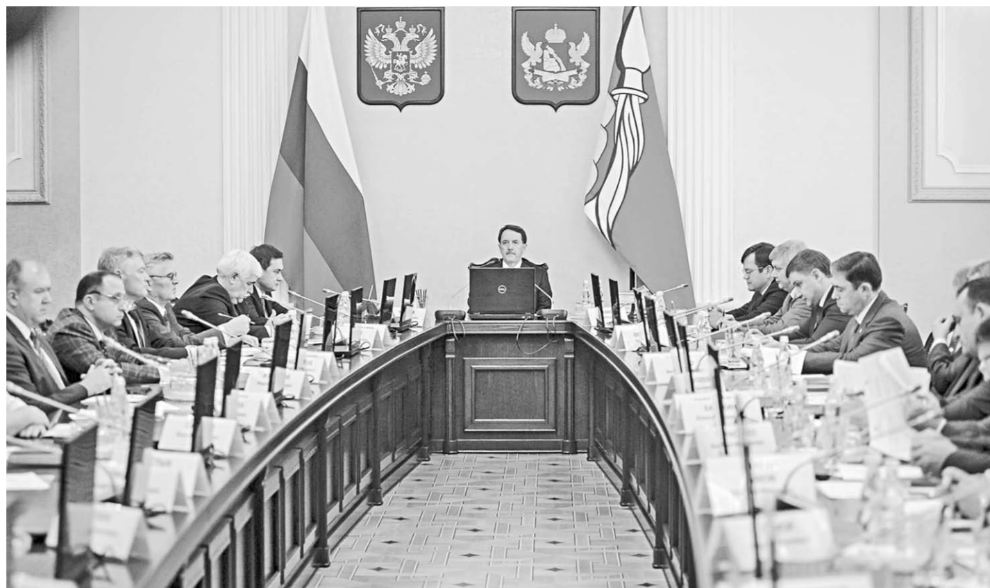
Во время заседания правительства Воронежской области.

Несмотря на негативные тенденции в макроэкономике, внутренние условия развития региональной экономики в отчётном периоде складывались