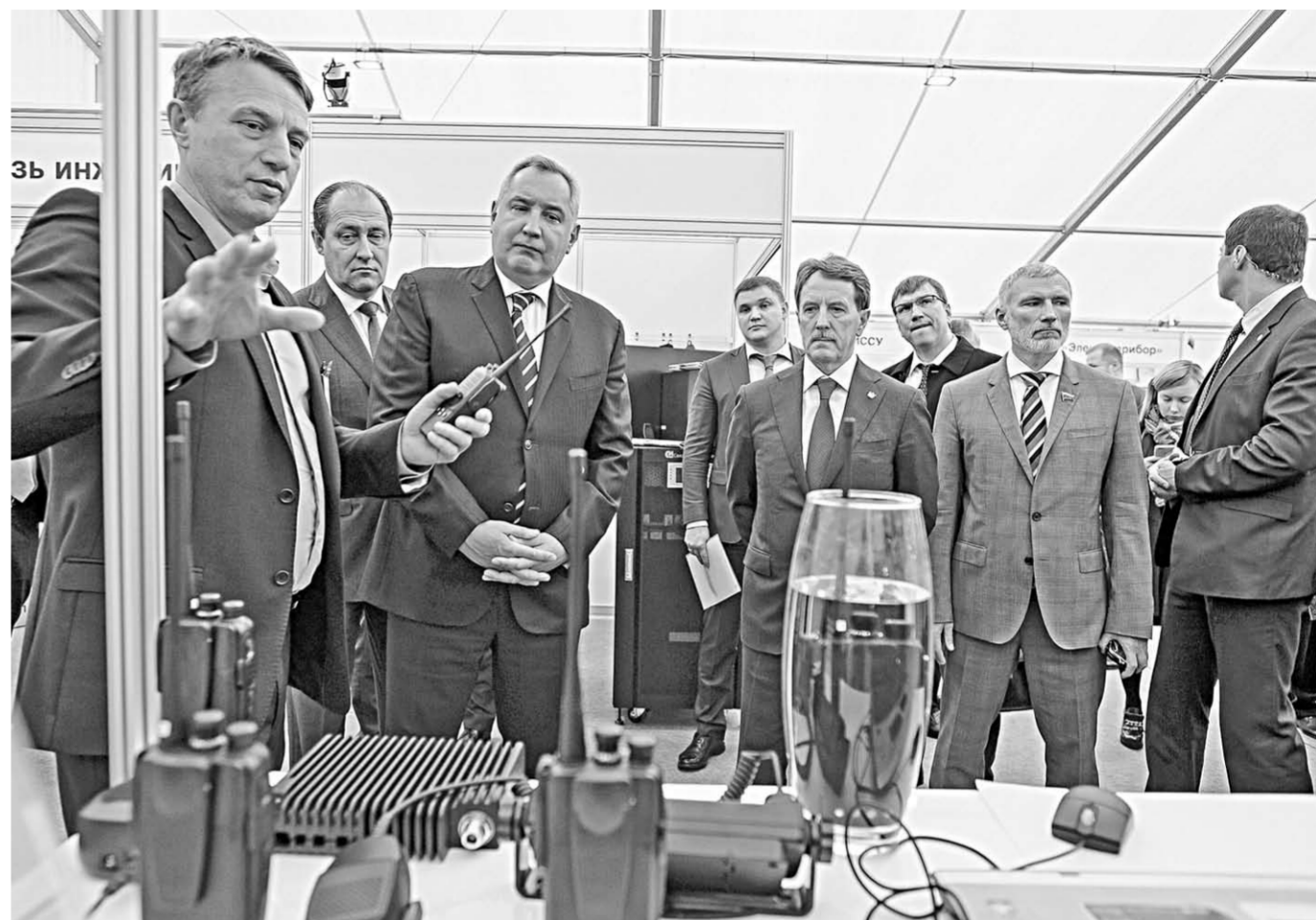
Алексей Гордеев и Дмитрий Рогозин осмотрели выставку, экспонаты на которую предоставили 14 крупных организаций.

Зампред Правительства РФ сказал, что хоть и существует достаточное количество мировых разработок, патентов в области связи, но, обладая существующей базой, главное не повторять то, что есть у других, а научиться рисковать и не бояться экспериментов. В качестве положительного опыта в