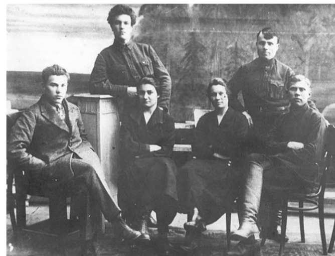
Бюро университетской комсомольской ячейки. 1926 г.

ГРЕБЕННИКОВ. «Воронежская коммуна», 11 января 1925г.