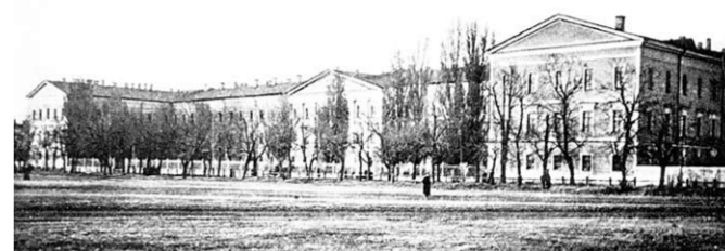
Михайловский кадетский корпус, в котором разместился Воронежский университет.